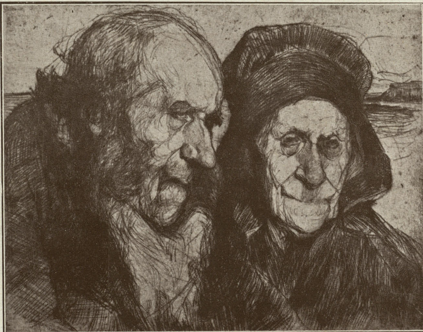
Les épaves (punta seca)

Mélancolie , y d'aquells delicadíssims «Sentiers.» Méla Mutermilch nasqué a Varsovia en 1872, y's donà a conèxer per primera vegada en 1902 a París, hont resideix actualment.