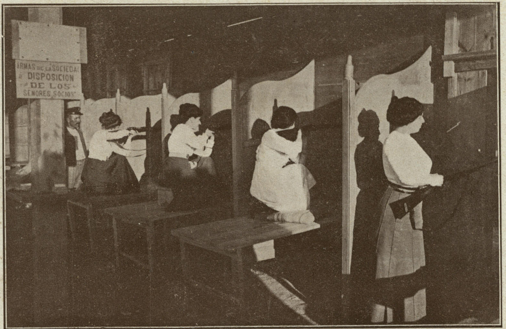
Les barcelonines tirant ab maüser

Plaunos, donchs, ab motiu del enllàs, repetirli la nostra simpatia que desd'ara compartirà sa gentilíssima esposa a qui les catalanes, per nostra veu, saluden com una nova amiga.