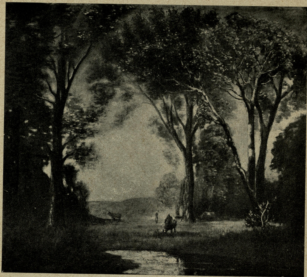
VORES DE RIU