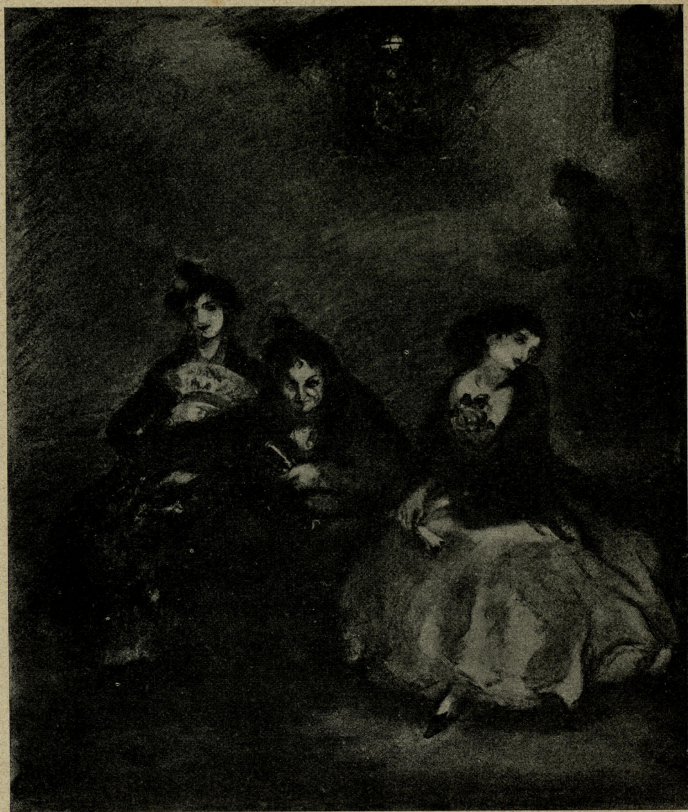
UN BANC DE LA MACARENA