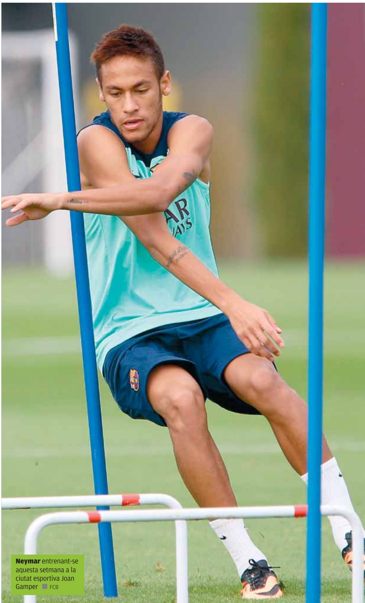
Neymar entrenant-se aquesta setmana a la ciutat esportiva Joan Gamper

VÈNCER I CONVÈNCER • El Barça visita Mestalla, un camp sempre difícil, obligat a millorar la imatge dels últims partits MÉS ROTACIONS • Martino ha deixat fora de la llista Xavi i Alexis, i tot indica que Messi i Neymar seran titulars