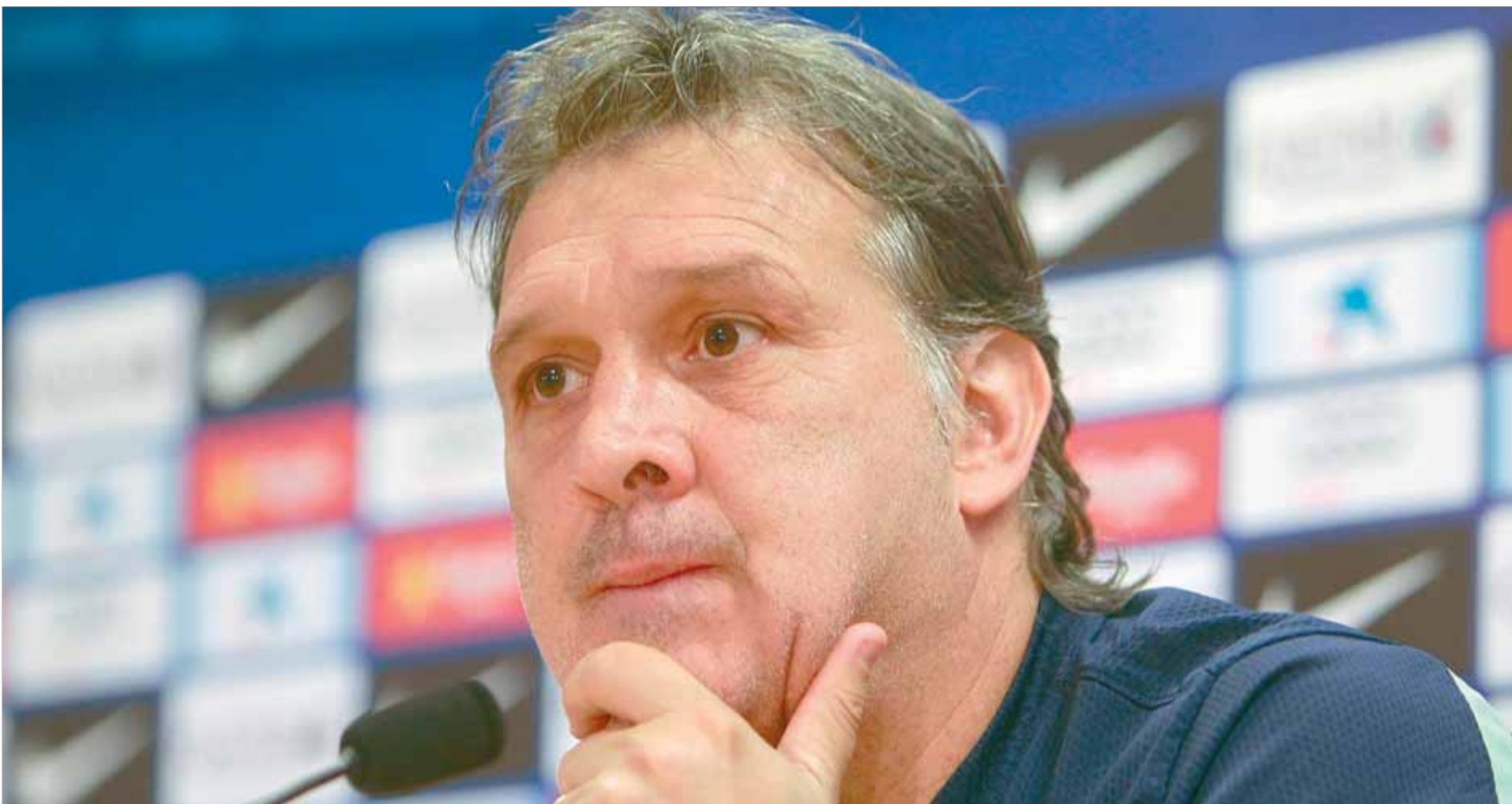
Gerardo Martino durant la roda de premsa d'ahir al matí, a la ciutat esportiva del FC Barcelona

Martino. Abans de la visita al València, del qual espera que avui surti a l'atac, l'entrenador del Barça reconeix que els seus jugadors estan lluny del seu millor nivell però celebra l'efectivitat demostrada en aquest inici de temporada