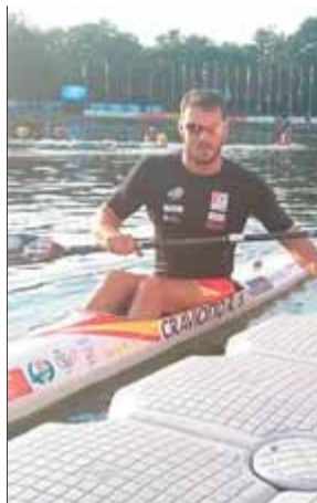
Saül Craviotto en el mundial de Duisburg ■ EL 9

El doble medallista olímpic Saül Craviotto lluitarà per les medalles en el K-1 200 m del mundial després de finalitzar en la segona posició de la seva semifinal i guanyar-se una plaça en la final. Tot i que el lleidatà té el setè millor temps (34.812) dels nou finalistes, tots els registres estan molt ajustats entre els aspirants al títol. El millor temps és per al suec Petter Öström, campió d'Europa aquest any, amb 34.326. Els grans favorits no van fallar i estan presents en la final. El campió olímpic a Londres, el britànic Edward McKeever, va fer 34.773, mentre que el polonès Piotr Siemionowski –que va ser campió mundial al