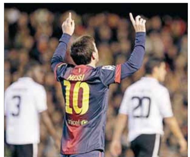
Messi celebra el seu gol en el partit de la temporada passada a Mestalla

lla. El seu balanç contra el València en la lliga és d'onze gols en catorze partits. En alguns es va erigir en protagonista, com en el de fa dues temporades, en què va fer quatre gols en la victòria per 5 a 1 al Camp Nou. El 2010, també al coliseu blaugrana, els va clavar un hat-trick . ■