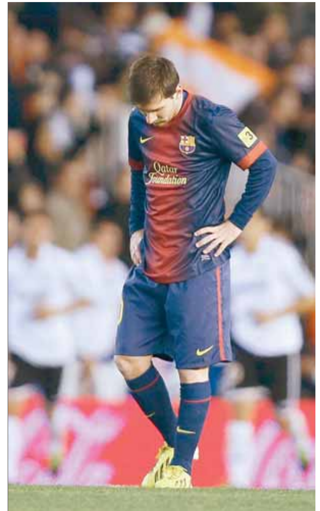
Messi capcot després d'un gol del València

Malgrat aquestes estadístiques, també cal dir que l'últim cop que el València s'ha imposat als blaugrana a casa seva va ser en la temporada 2006/2007 i que ho va fer per 2 a 1. El conjunt valencianista serà molt perillós després de la seva derrota contra l'Espanyol de la jornada passada i els jugadors sortiran extramoti-