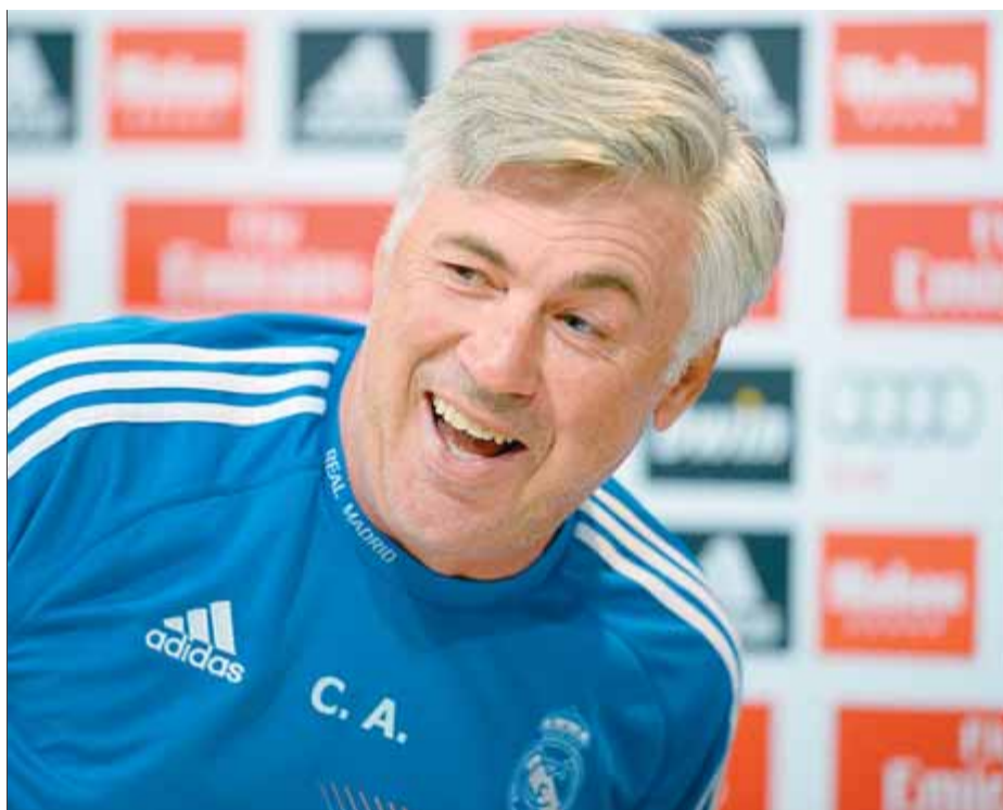
Ancelotti, ahir en la roda de premsa, somrient

Madrid. Els de Valverde arriben invictes al Bernabéu, que espera impacient la presentació del gal·lès. Ancelotti torna a deixar el capità a la banqueta, tot i que diu que tindrà la seva oportunitat