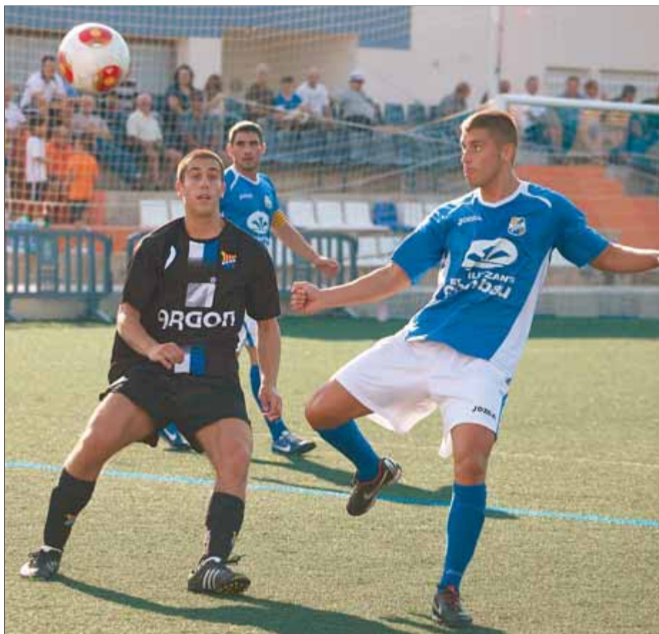
Bonaventura observa com un jugador de la Rapitenca rebutja la pilota en el duel d'ahir

Els jugadors de Xavi Punsí van tornar a sortir al camp amb una marxa més que el rival. La intensitat figuerenca va provocar molts problemes al conjunt del Montsià. La defensa de la