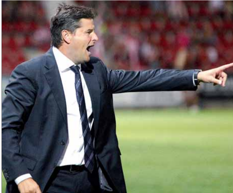
El tècnic asturià, en ple partit ahir a Montilivi

El Numància va ser força millor que el Girona durant la primera meitat. “He vist el rival que m'esperava, amb molt de joc, jugadors de banda interessants i un doble pivot dels millors”. El mig del camp del Girona, en canvi, no va acabar de funcionar amb l'esquema dels dos primers partits, amb Richy, Matamala i Timor. El canvi d'esquema va coincidir amb el pas endavant de l'equip, ja en la segona part. “Aquesta setmana