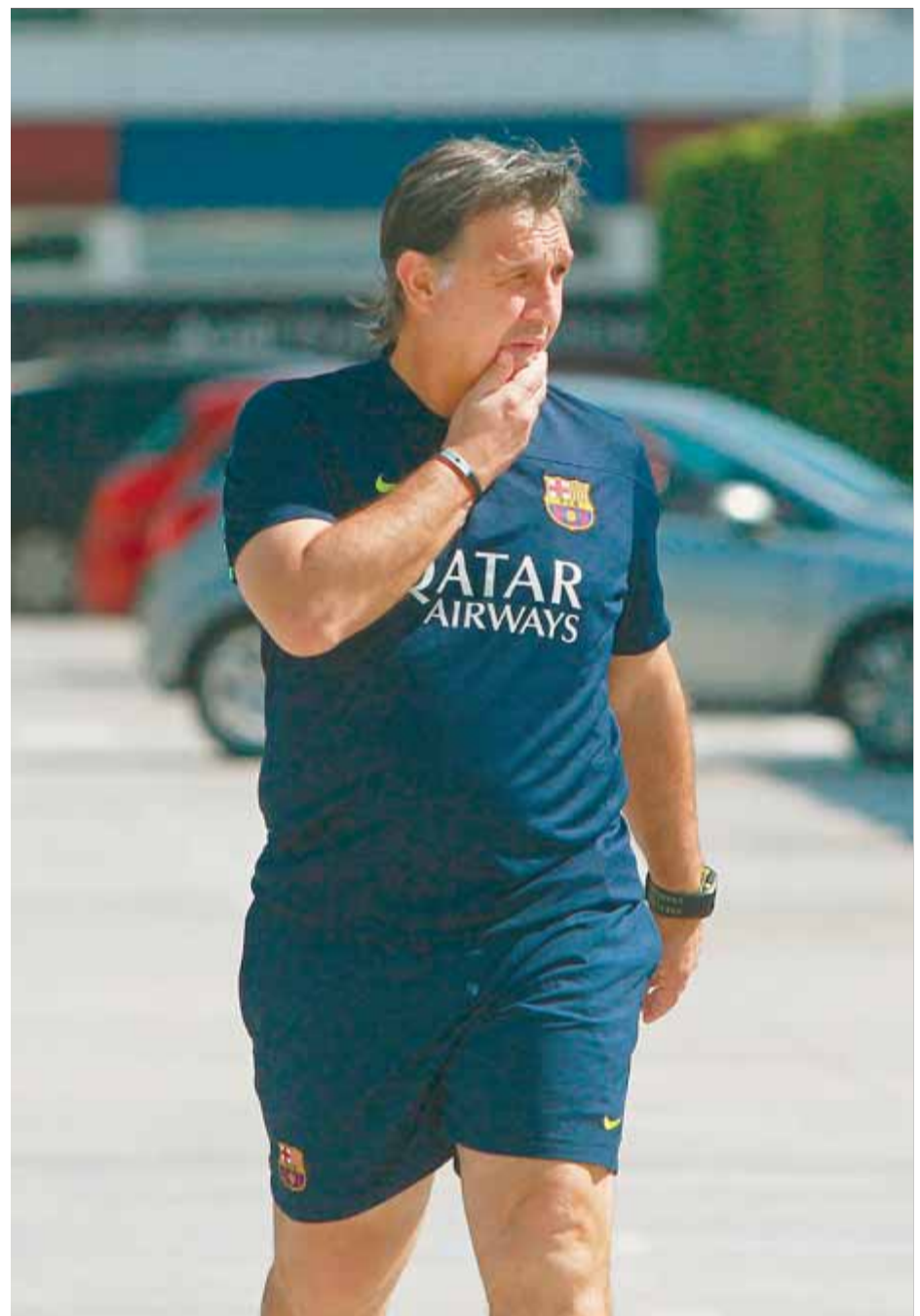
Gerardo Martino dirigint-se a la sala de premsa de la ciutat esportiva

Martino ha demostrat ja en aquest breu temps que fa que és a Can Barça que és un entrenador amb les idees molt clares i que està disposat a marcar perfil propi, malgrat que respecta moltíssim la tasca feta pels seus predecessors al càrrec. Al marge de les rotacions, també ha introduït alguns matisos tàctics dins l'equip i ha canviat alguns costums, com pot ser la de no tornar el mateix dia del partit i les concentracions. També ha demostrat tenir caràcter i fermesa en la seva gestió de la inclusió de Neymar en l'equip titular, ja que no ho va fer fins al quart partit oficial de la temporada o en la gestió dels minuts de Messi sobre el camp. El va canviar contra el Llevant quan quedaven força minuts i no se'l va endur a Màlaga. ■