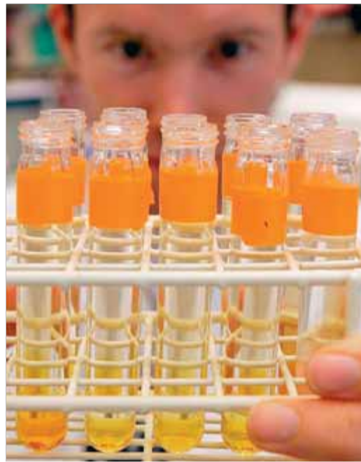
Unes mostres per analitzar

El de Rio de Janeiro és un dels 33 laboratoris que l'AMA tenia acreditats arreu del món en aquest 2013 per treballar amb les diverses federacions esportives i organismes de lluita contra