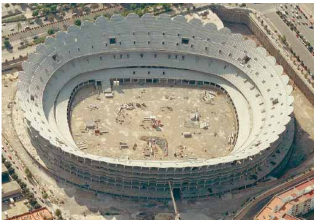
La construcció del nou estadi valencianista, el nou Mestalla, està paralitzada des del 2009

547 milions. El deute del València CF va arribar a aquesta xifra el juny del 2009 i va provocar una ampliació de capital i la necessitat de demanar un préstec.