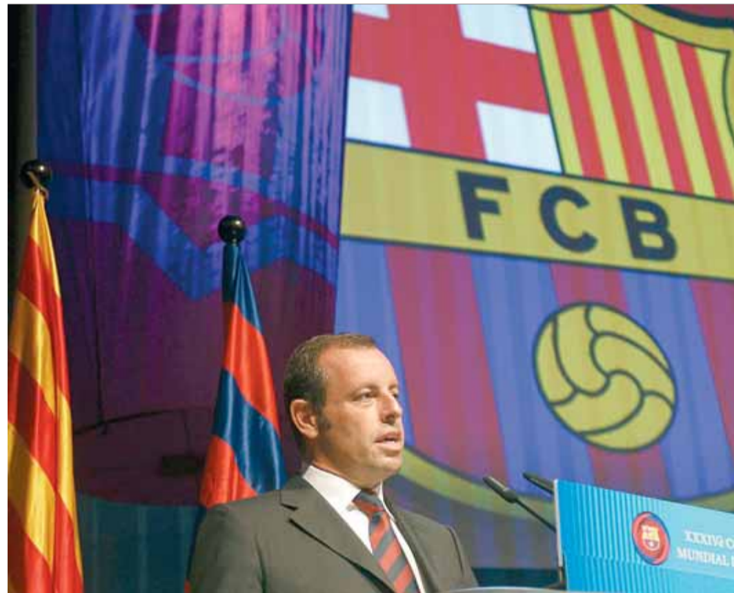
Sandro Rosell en el congrés mundial de penyes

És cert que el curs 2013/14 ha arrencat bé pel que fa a l'apartat dels resultats, amb un ple de victòries en les tres primeres jornades de lliga i la