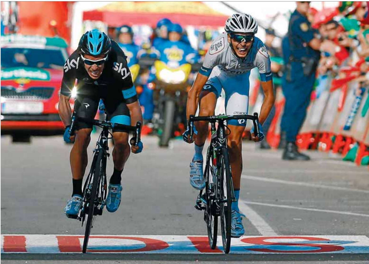
El francès Warren Barguil (Argos), a la dreta, supera a la línia de meta el colombià Rigoberto Uran (Sky)

Vuelta. Un atac de Joaquim Rodríguez va posar a prova el líder, que per primer cop va cedir alguns segons. La victòria va ser per al francès Warren Barguil, que ja ha guanyat dues etapes