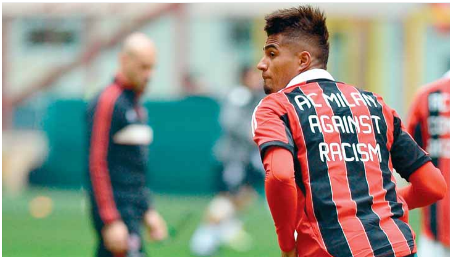
Kevin-Prince Boateng, un dels afectats pel racisme a Itàlia, amb una samarreta contra la discriminació de races durant la temporada passada

Balotelli: les amenaces inciten Hi ha un futbolista a qui totes li ponen. Ja sigui per les seves actuacions al terreny de joc o per les ex-