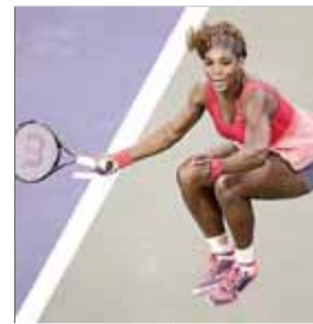
SERENA WILLIAMS TENNIS

El corredor català no es dona per vençut i el seu atac d'ahir en l'última pujada va crear dificultats al líder de la cursa, que va cedir uns segons.