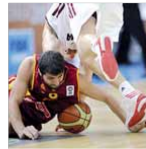
CAMPIONAT EUROPA BÀSQUET

La nord-americana ja acumula cinc títols de l'obert dels Estats Units després del seu triomf contra Victoria Azarenka en la final d'aquest any.