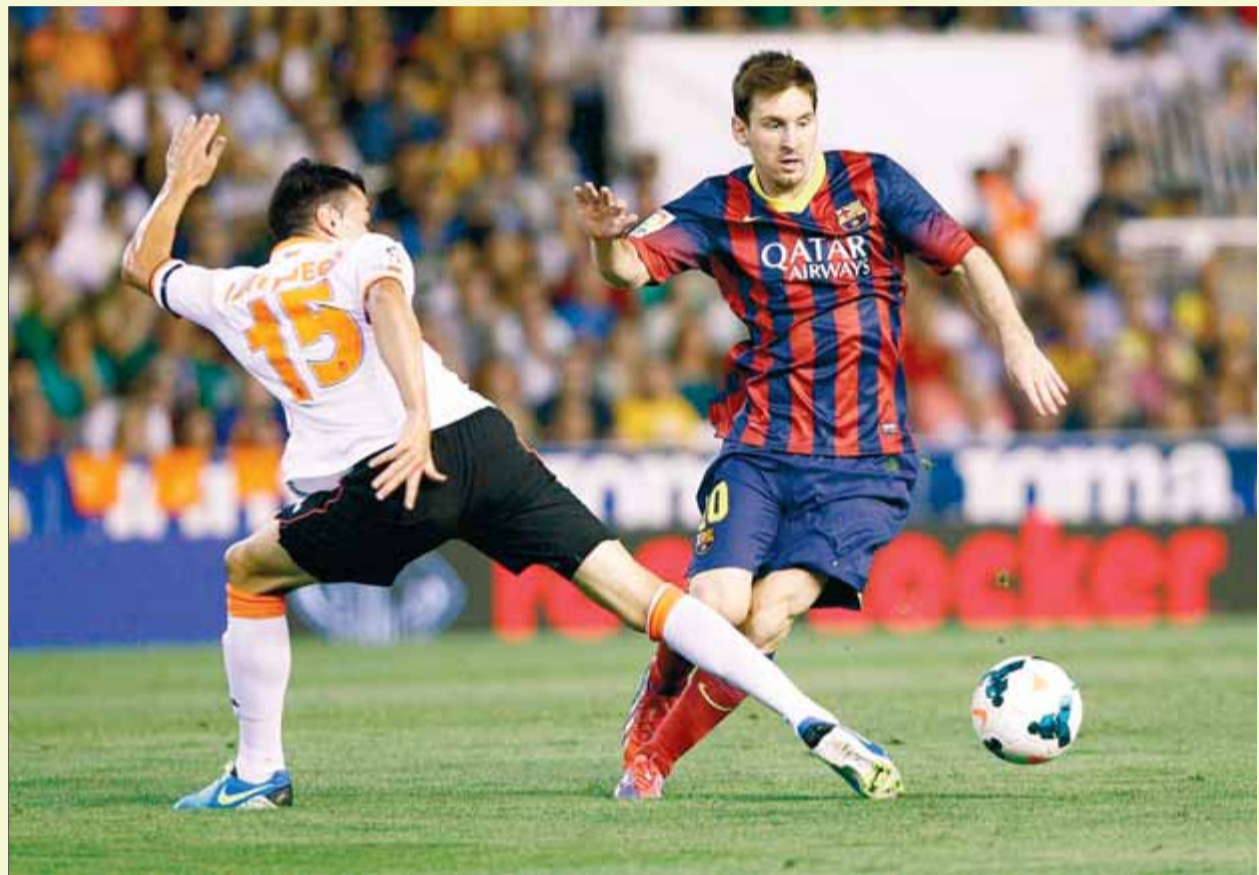
Messi en una acció del partit que el Barça va jugar a Mestalla

En l'entrevista a TV3, Rosell va deixar caure amb certa innocència aquesta petita bomba, que, vista la repercussió que ha tingut en els mitjans, sembla com si aquests haguessin redreçat el tret erroni llançat pel president del Barça i, així, evitar atiar un crisi a la institució, tot just en el moment en què algunes veus alerten de la falta de feeling entre la presidència i la