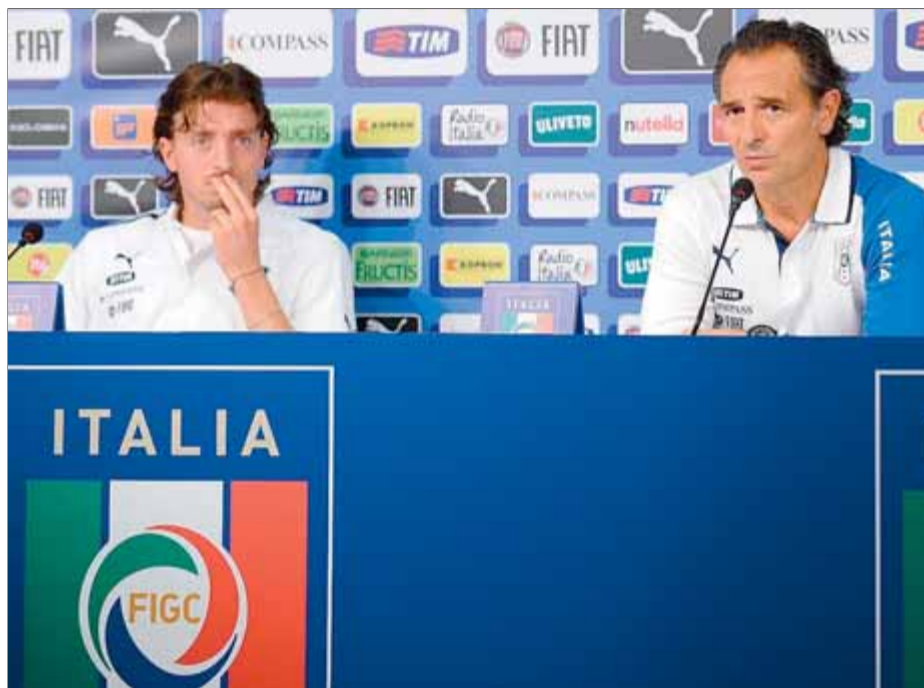
Montolivo i Prandelli, ahir, en la roda de premsa de la selecció italiana

Una situació ben diferent és la que viu la selecció francesa de Didier Deschamps, que després de la derrota contra Espanya (0-1) i de l'empat a zero amb Geòrgia no li queda més remei que guanyar avui a Bielorrússia si no vol agreujar els seus problemes. Els bleus , segons a tres punts d'Espanya, acumulen cinc partits sense marcar –amb partits amistosos i classificatoris– i no poden fallar més. Amb el primer lloc molt difícil, França aspira a ser una dels vuit millors segones per jugar la repesca. ■