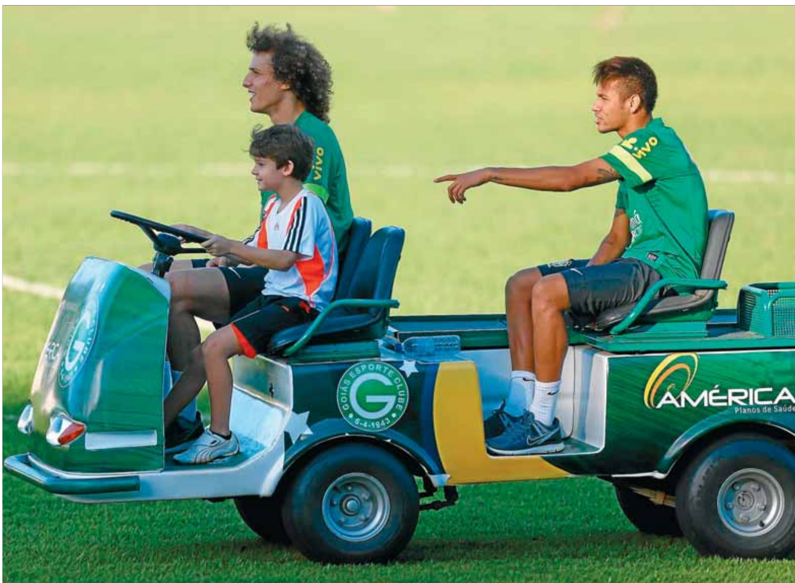
Neymar i David Luiz, durant un entrenament de la selecció brasilera de futbol

Optimisme. Després de golejar Austràlia amb una actuació estel·lar de Neymar, una Brasil farcida d'il·lusió s'enfrontarà aquesta matinada a Portugal, que es presenta a Boston sense Ronaldo