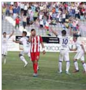
GIRONA FC FUTBOL

L'equip va donar una molt mala imatge al camp del Jaén, que era el cuer de la segona divisió A i que encara ni tan sols havia puntuat.