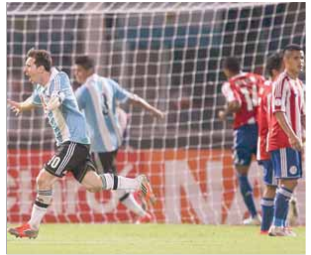
Messi celebra el gol que va marcar, fa just un any, contra el Paraguai en el partit que es va jugar a l'Argentina

Amb 26 anys complerts el mes de juny passat –en farà 27 en ple mundial–, Messi arribarà a la màxima cita futbolística en el punt més àlgid de la seva carrera. Només les lesions que ha patit en aquests darrers mesos li han impedit rendir al nivell habitual, però si arriba al Brasil en plenitud de condicions, molt pocs dubten que aquest pot ser el mundial de Messi. La fase de classificació, en què el combinat entrenat per Alejandro Sabella lidera el grup sud-americà amb autoritat des de l'inici, i en què el 10 blaugrana ha brillat partit rere partit –amb 8 gols és tercer en la llista de golejadors darrere d'Higuaín (9) i Luis Suárez (10)– és la millor prova que aquesta Argentina arribarà al mundial 2014, com a mínim, molt més preparada i amb més garanties de proclamar-se campió respecte de fa quatre anys. Una altra dada és que de l'última derrota del combinat argentí amb Messi al camp, en fa gairebé dos anys (l'octubre del 2011, a Veneçuela). Des d'aleshores, en partits oficials, sis triomfs i cinc empats que han portat els de Sabella a la possibilitat de segellar la classificació per al mundial, amb encara dues jornades per disputar-se de la fase de classificació. Que mai cap selecció europea hagi guanyat un mundial en territori americà també juga a favor seu. ■