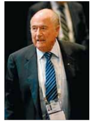
Joseph Blatter, dissabte a Buenos Aires

FIFA. El president negociarà un torneig d'hivern pel risc d'un clima massa calorós