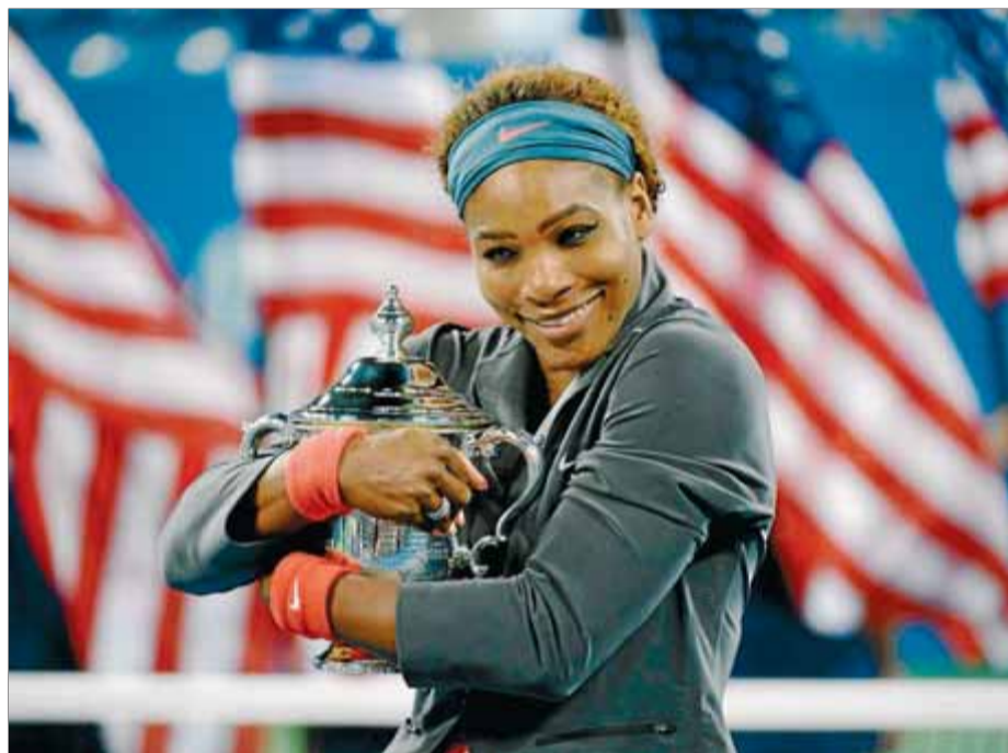
Serena Williams abraça el trofeu de campiona de l'obert dels Estats Units

Amb Xaràpova fora del mapa per lesions i el flirteig continu amb el veritable poder de jugadores com ara Radwanska, Errani, Kerber i Kvitova, que no acaben de transformar el seu talent en eclosió, Williams (1) i Azarenka (2) van reiterar el seu domini i van fer via sense grans titubejos per les parts oposades del quadre per tornar a trobar-se en una final molt digna a pesar de les complicades condicions meteorològiques que, d'una manera o d'altra, acostumen a irrompre a Flushing Meadows. Els més de 20.000 testimonis presencials van comprovar que el vent s'havia escolat a la festa i que dificultava la precisió dels cops guanyadors, sobretot les fuetades de la nord-americana, acostumada a jugar més al límit. Les con-