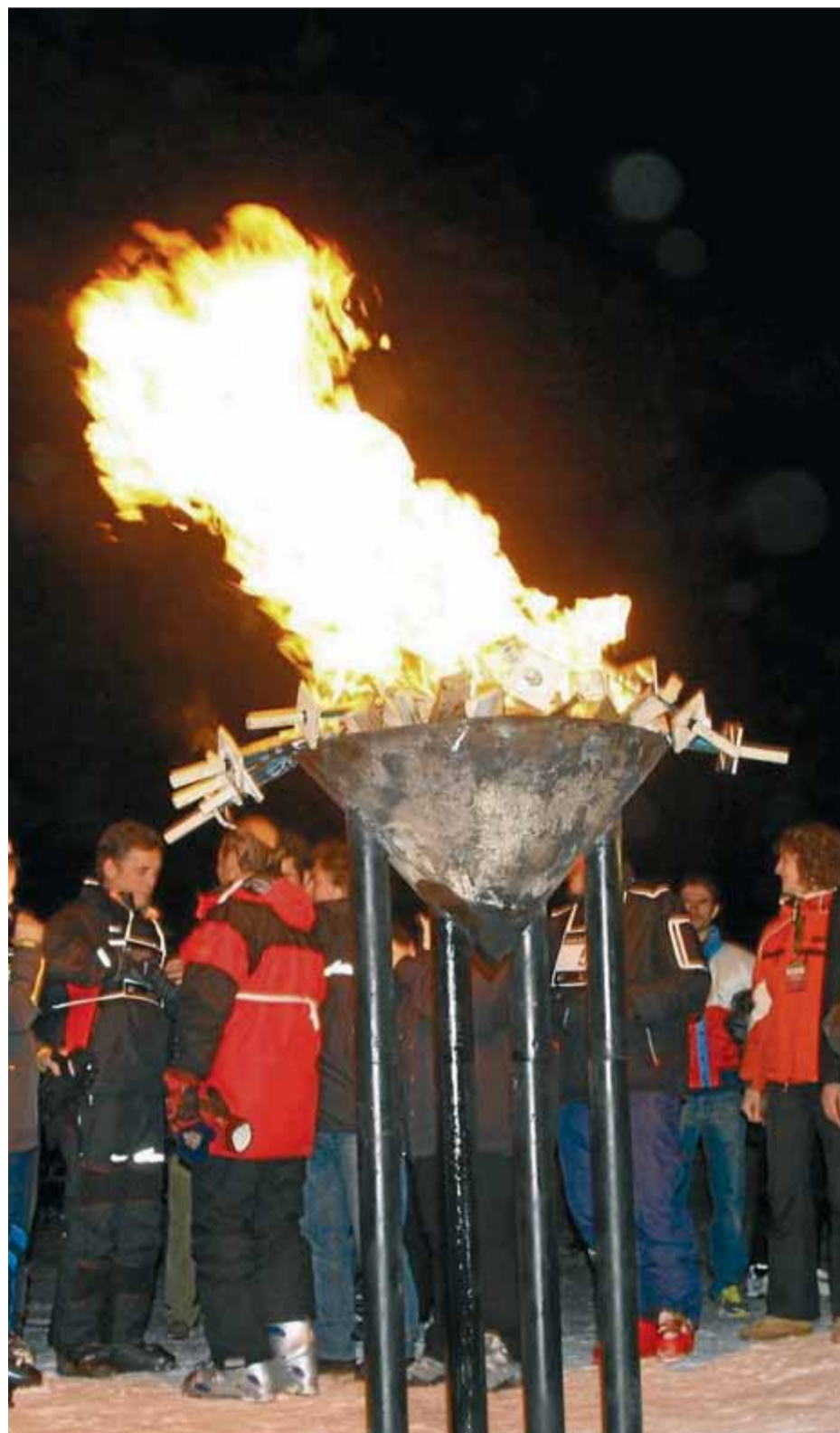
Acte de promoció de la candidatura catalana fet a Masella l'hivern passat

Trias també va dir ahir que aquest és un projecte que ha d'ajudar el Pirineu, tot i que va descartar que les proves es puguin repartir per tota la serralada: "Aniríem a perdre." ■