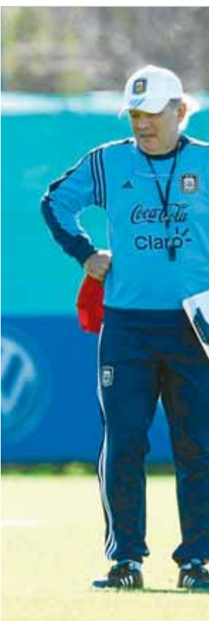
Messi reposa en un entrenament de la selecció argentina al costat d'Alejandro Sabella

El repòs del millor futbolista del planeta, de fet, convé tant al club blaugrana com a la seva selecció. El Barça el vol fresc per afrontar el moment decisiu de la temporada, que arribarà entre els mesos de març i maig, i l'Argentina, per quan hagi de jugar la fase final de la copa del món, el mes de juny. En tot cas, Tata Martino ja ha donat mostres que no vol que les cames de Messi suportin més esforç del que sigui necessari: el va substituir en el minut 71 del primer partit de lliga, contra el Llevant, quan el marcador assenyalava un clar 6-0. Aquell dia Sabella seguia el partit des de la llotja de l'estadi i va poder prendre'n bona nota. ■