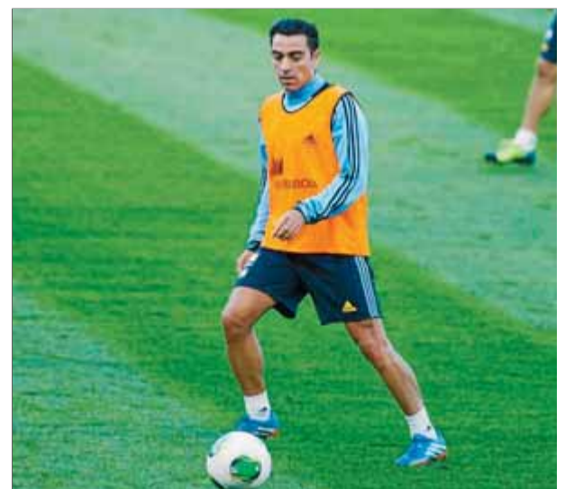
Xavi, en l'entrenament d'ahir

Mentrestant, el blaugrana Cesc Fàbregas es va mostrar content amb el seu rol a la selecció: “Cada vegada em sento més important i amb més pes de la selecció; tinc ganes de continuar així”. ■