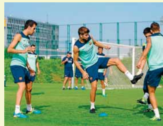
Busquets i Piqué, durant l'entrenament d'ahir