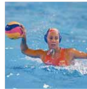
SELECCIÓ JÚNIOR WATERPOLO

L'equip que presideix Llorenç Serra Ferrer va baixar de primera i ara és el cuer de la segona divisió A, havent rebut vuit gols en dos partits.