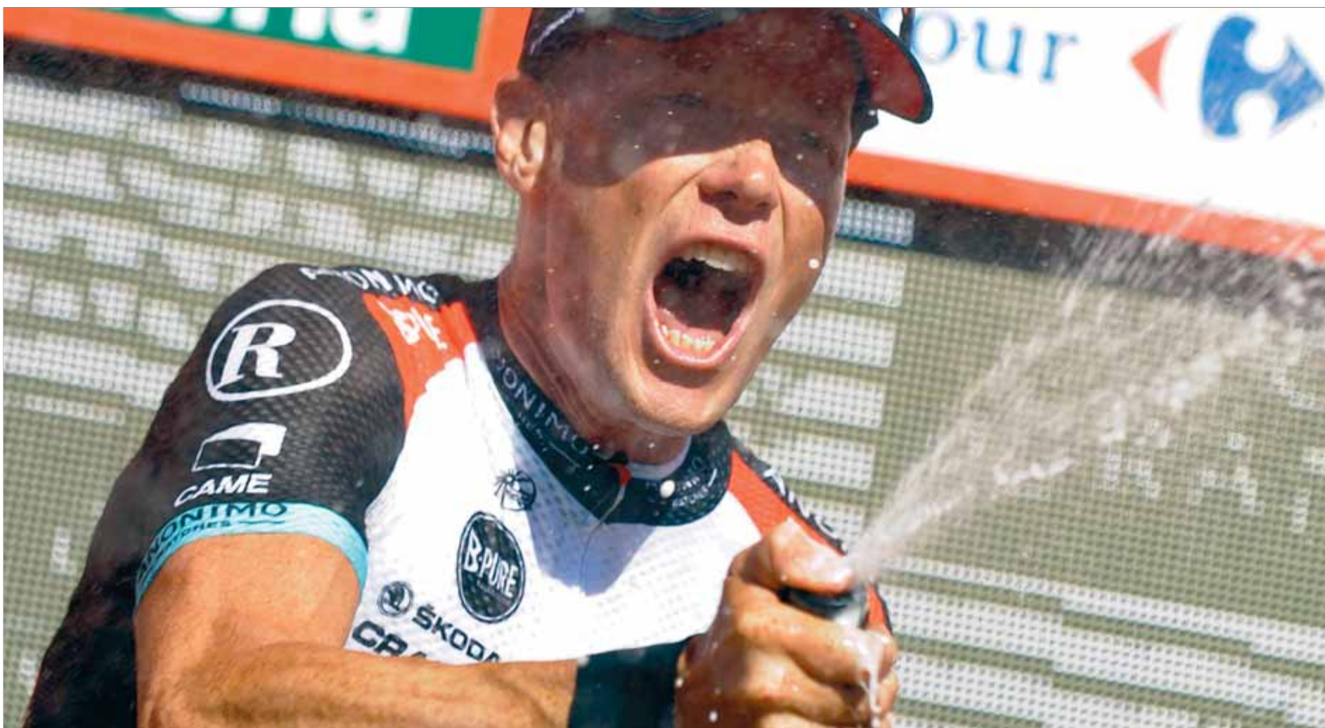
Horner (41 anys) celebra la victòria d'etapa i el lideratge provisional en la Volta a Espanya