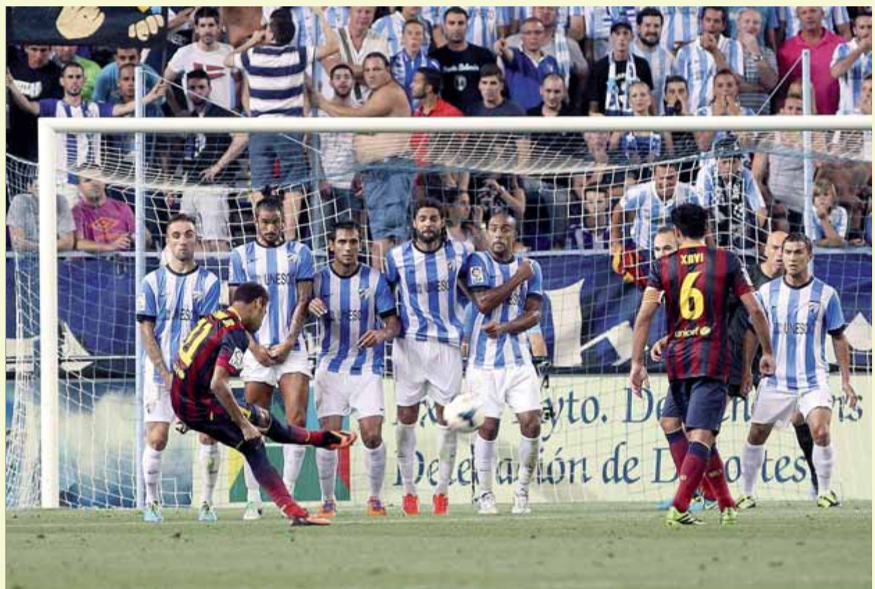
Neymar llançant una falta en el partit de diumenge a Màlaga