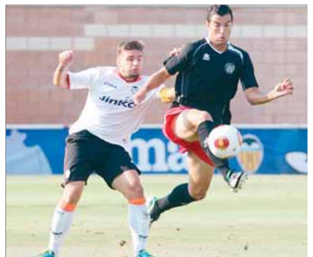
Una acció del partit que va disputar l'Hospitalet al camp del València B el dissabte passat