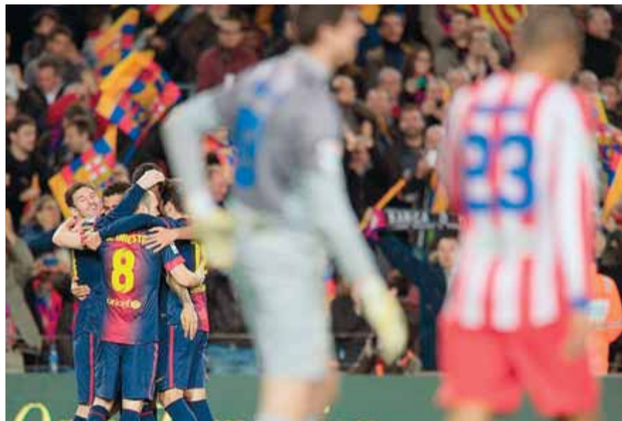
Els jugadors celebrant un dels quatre gols que van fer la temporada passada

I encara hi ha més, molt més, ja que tenint en compte que al conjunt que