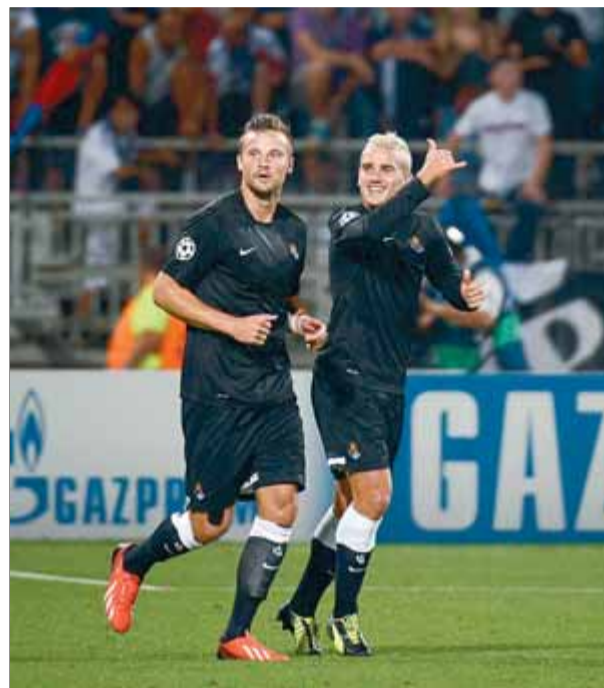
Seferovic i Griezmann , en el partit d'anada a Lió

Avui l'Arsenal d'Arsène Wenger vol confirmar la seva recuperació, després d'haver perdut la setmana passada en la primera jornada de Premier contra l'Aston Villa, fent valer el resultat de l'anada contra el Fenerbahçe (0-3) i també fixant-se en el darrer partit de lliga, en què va derrotar el Fulham a Craven Cottage, deixant una bona imatge en el joc, tant ofensivament com defensivament. També avui mateix, l'Àustria de Viena i el PAOK volen donar la sorpresa de la jornada. El primer ho té millor, ja que va vèncer el Dinamo de Zagreb, a Croàcia (0-2), mentre que els grecs volen aprofitar el resultat de l'anada (1-1) per convertir el seu estadi en un infern i eliminar el totpoderós Schalke 04 alemany. El Legia i l'Steaua de Bucarest