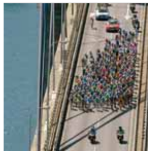
VUELTA A ESPANYA CICLISME

Felicita pel Twitter la selecció espanyola femenina de waterpolo pel títol mundial, 24 dies després, en veure la repetició de la final per Teledeporte.