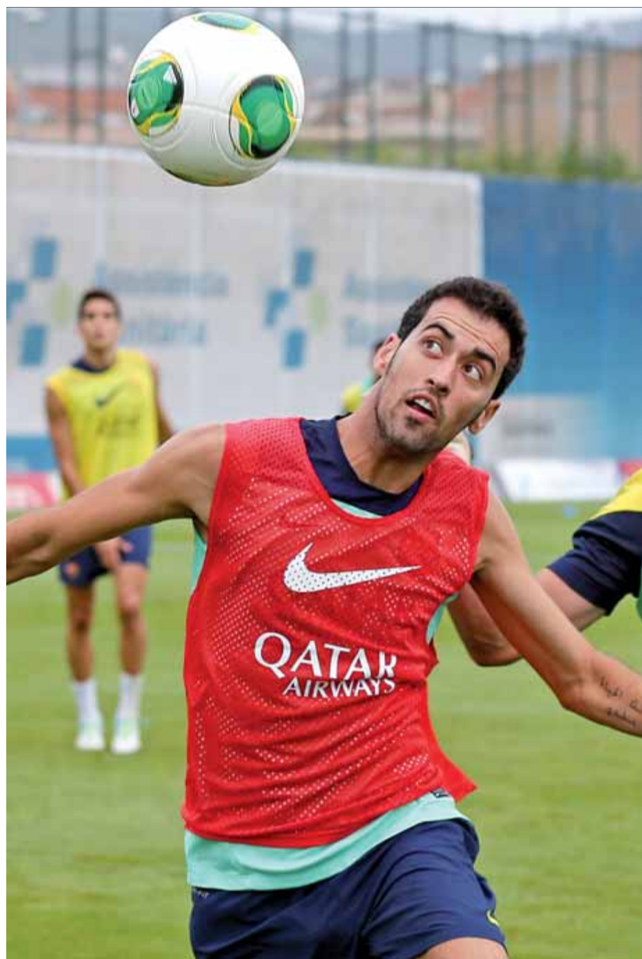
El migcampista de Badia, durant la sessió de recuperació d'ahir a la ciutat esportiva

Pel que fa als valors de futur de la plantilla, aquest estiu també s'ha signat l'ampliació de contracte de Cristian Tello, fins al juny del 2018, així com la de Rafinha (2016) i Gerard Deulofeu (2017), cedits al Celta (Rafinha) i l'Everton (Deulofeu) per tal que acumulin més minuts a l'elit. ■