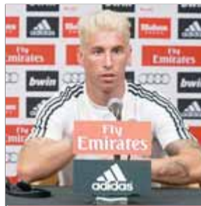
SERGIO RAMOS FUTBOL

Felicita pel Twitter la selecció espanyola femenina de waterpolo pel títol mundial, 24 dies després, en veure la repetició de la final per Teledeporte.