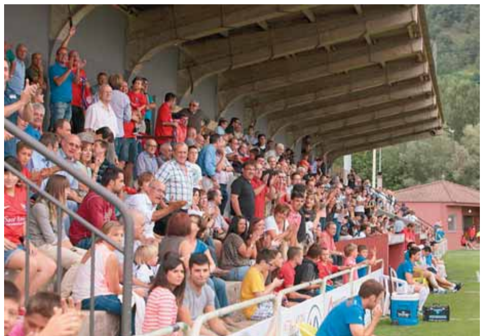
Imatge d'un dels laterals del municipal de Llagostera, a la part superior, durant l'estrena de l'equip a segona B. A sota, l'aspecte de la tribuna en el primer partit de l'Olot ■ JOAN SABATER