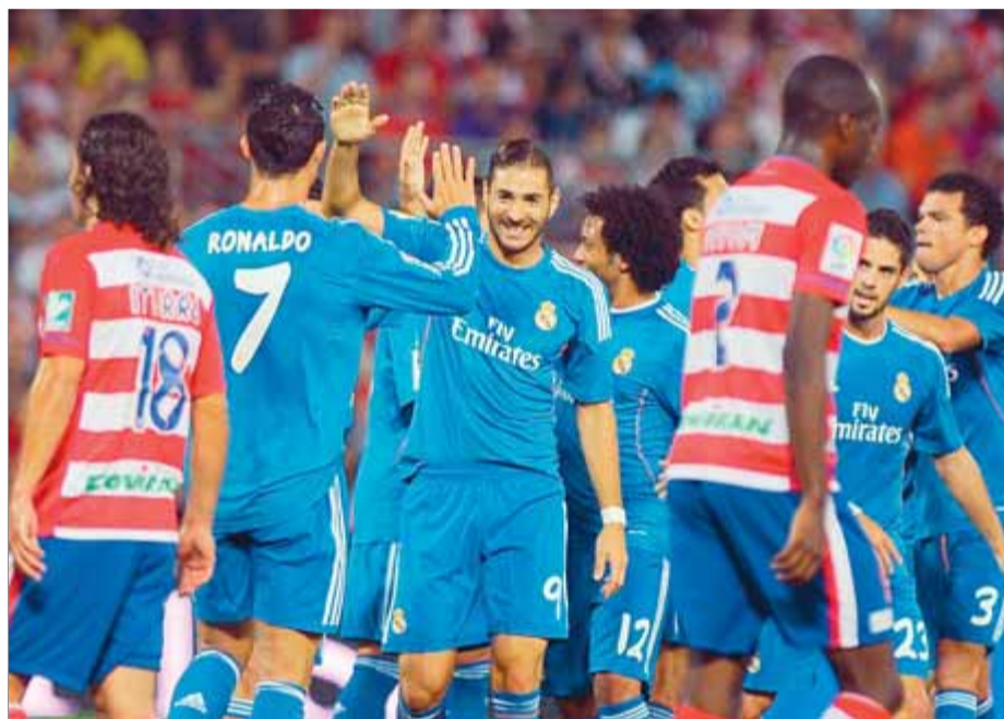
Benzema, celebrant amb Cristiano el gol del Madrid

Més llenya al foc. Diego López va tornar a ser ahir el porter titular del Madrid després d'una jornada de protesta de l'afició blanca en l'homenatge a Raül, on la graderia del Bernabéu es va definir a favor d'Iker Casillas. Són moments difícils per al capità i per a l'estabilitat del club blanc, que podria acabar amb la sortida del porter cap a un altre equip. La veritat és