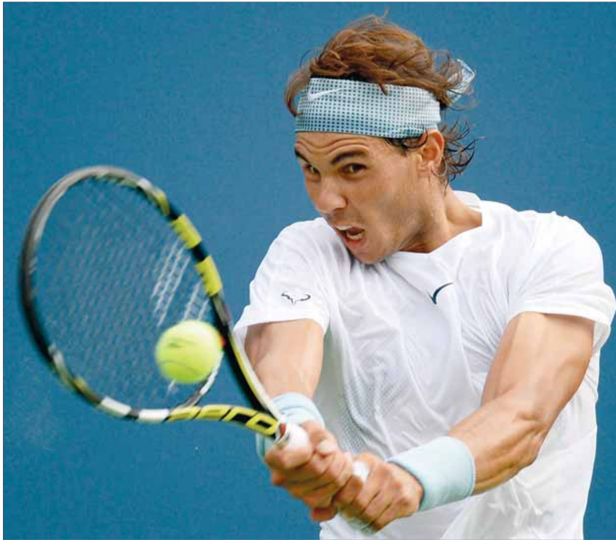
Rafael Nadal colpeja la bola en el partit contra Harrison en l'Obert dels Estats Units

L'australià va guanyar el primer set (6-3) en 33 minuts —el més ràpid dels cinc—, però la reacció de Ramos va ser immediata i va guanyar els dos següents, per 3-6 i 4-6. En tots dos va trencar el servei del seu rival un cop, i no va donar cap possibilitat a Tomic per poder trencar el seu. El quart set va començar bé per al maresmenc i, després de fer un trencament al seu rival, tenia un 3-4 i el servei a favor seu. Tomic, però, va lluitar per