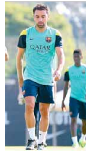
El terrassenc, en un entrenament recent

nyador.” També apunta els retocs que està introduint el tècnic en el joc, com ara el canvi a un marcatge més individual en les jugades d'estratègia. “Estem treballant molt la sortida de la pilota i les jugades a pilota aturada, que tan importants són en el futbol actual”, destaca Xavi. ■