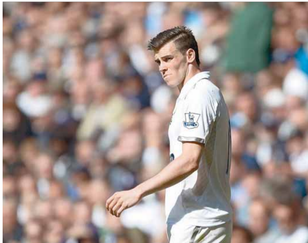
Gareth Bale , en una imatge d'arxiu, espera pacient mentre el Madrid acaba d'enllestir les gestions per convertir-lo en el nou fitxatge més car del futbol d'elit

Qüestionar les xifres gegantines que mouen els grans clubs de futbol és un debat tan recurrent com estèril, que s'atia cada estiu amb l'ober-