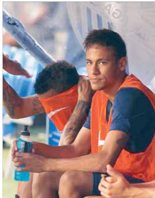
Neymar, a la banqueta de La Rosaleda

Han passat els tres primers partits oficials de la temporada –dos de lliga i l'anada de la final de la supercopa d'Espanya– i crec que el moment perquè Neymar ocupi el lloc que li correspon a l'onze titular del Barça ja ha arribat. Em costaria molt d'entendre que el davanter brasiler repetís suplència després dels bons minuts jugats contra l'Atlético de Madrid al Vicente Calderón i contra el Màlaga a La Rosaleda. Sí, ja ho sé, que amb prou feines han estat seixanta minuts en dos partits, però les sensacions que se'n van desprendre és que la presència de Neymar sobre el camp ara mateix és més necessària que mai. Encara estem a l'agost, falta frescor en el joc i en la