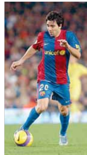
Deco, en un partit de lliga amb el Barça

també la UEFA, tres lligues i tres copes, i en el Chelsea va continuar guanyant: una lliga, dues FA Cup i una Community Shield. El 2010 va fitxar pel Fluminense, on va guanyar dos Brasileirões, i on dimecres passat va disputar els seus últims minuts com a professional. ■