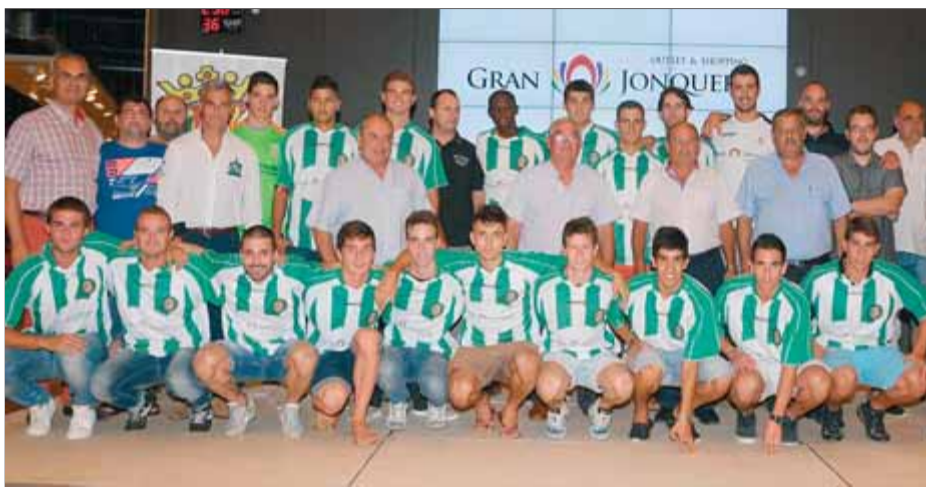
Presentació de la plantilla de La Jonquera per a la temporada 2013/2014 ■ ÀNGEL REYNAL