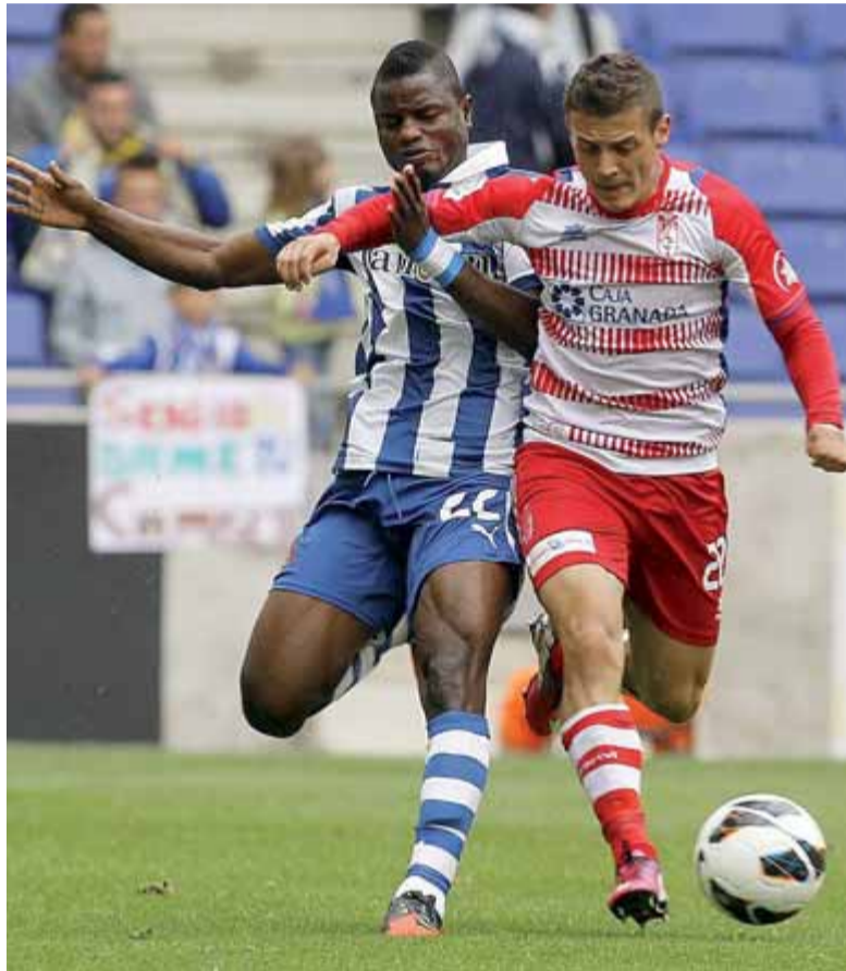
Córdoba (esquerra) i Torje (dreta amb Wakaso) són els nous reforços blanc-i-blau