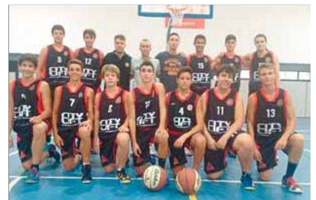
L'equip del cadet del Club Escola Bàsquet Girona