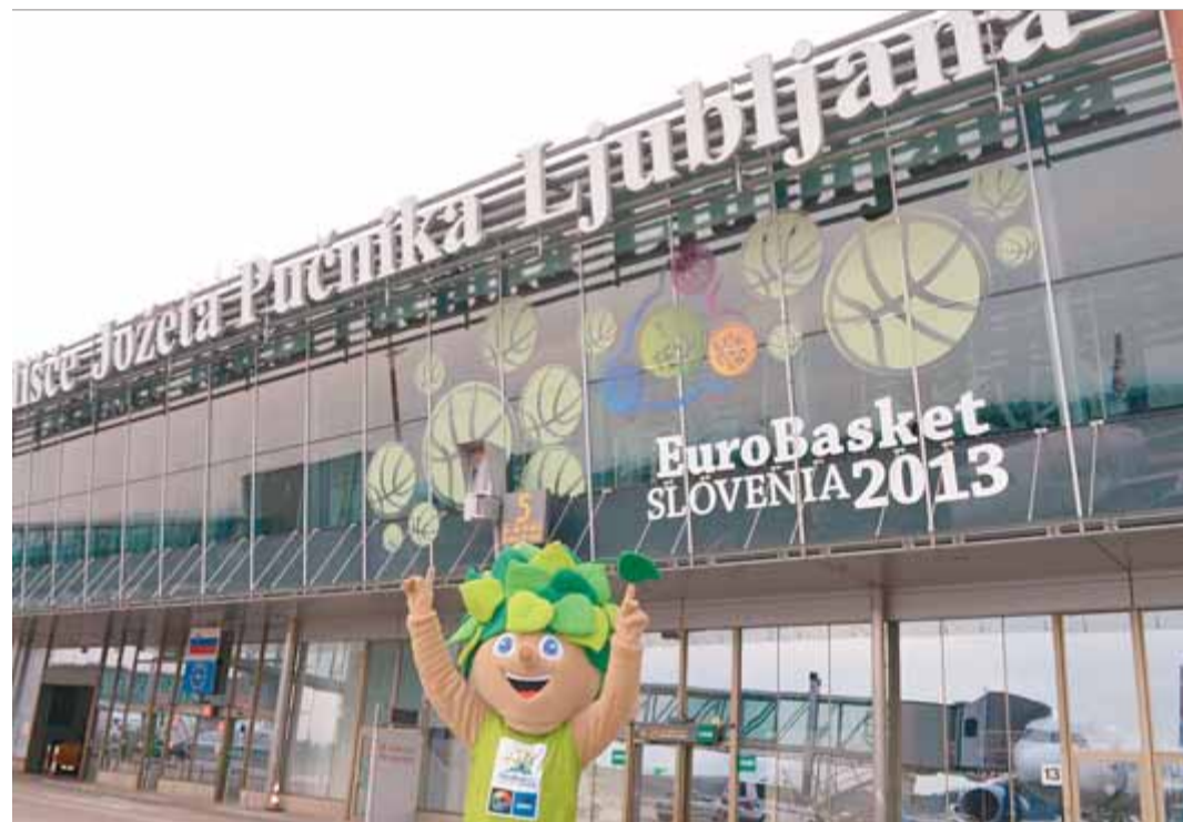
Una instantània de l'aeroport de Ljubljana, ben decorat per a l'ocasió

El sistema de competició en l'europeu és atractiu per a l'aficionat ara: 90 partits en 19 dies. Però des del punt de vista d'un aspirant al títol, és una bajanada: 11 duels en menys de tres setmanes per al campió. L'escàs marge de recuperació obliga a engegar motors a mig gas i, en aquest sentit, en la primera fase molts dels favorits no s'aplicaran al màxim—cinc partits en sis dies— ja que en principi cap hauria de patir per treure el cap entre els quatre millors, de sis en total, a cada grup. En cas contrari, tots saben que a