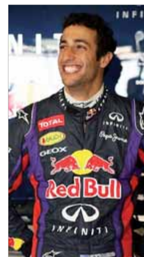
Daniel Ricciardo, company de Vettel

conegut, i un jove Damon Hill." Ricciardo, de 24 anys, va debutar en la F-1 el 2011 i ha disputat 42 GP i té un setè lloc (a Xangai, aquest any) com a millor resultat. "Des que vaig arribar a la F-1 que esperava aquest moment. Estic preparat. No he vingut aquí per fer el desè, vull els millors resultats", afirma. ■