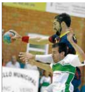
El Bordils i el Barça ■ L.S.

El Bordils inicia avui la recta final per arribar en un bon moment a l'inici de la divisió d'honor Plata, de la qual es disputarà la primera jornada el 14 de setembre. Els blanc-i-verds disputaran dos partits abans de la lliga. El primer serà avui contra el Banyoles (21 h), que aquesta temporada s'estrena a la primera estatal, i el dimarts dia 10 s'enfrontarà a la Roca, un dels aspirants al títol de la primera estatal, en el Memorial Narcís Aliu, que