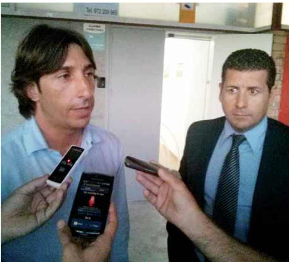
El secretari tècnic i el president, ahir al vespre a Montilivi ■ X.M.