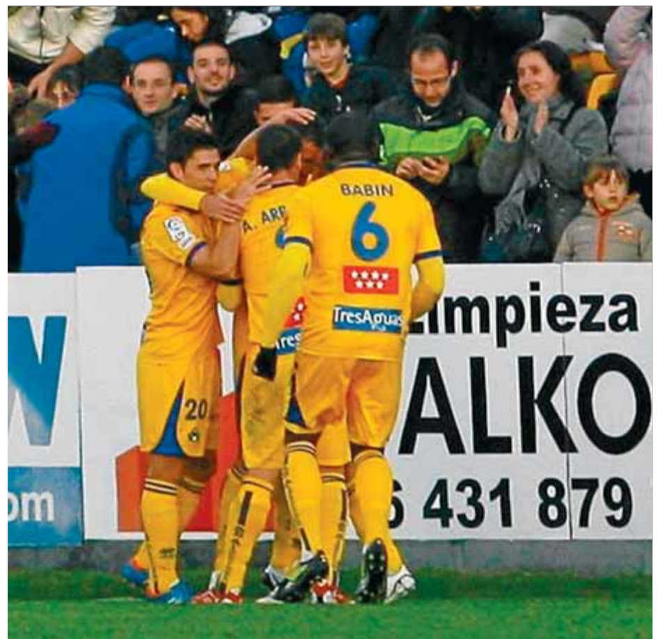
L'Alcorcón ha tornat a començar molt fort la lliga