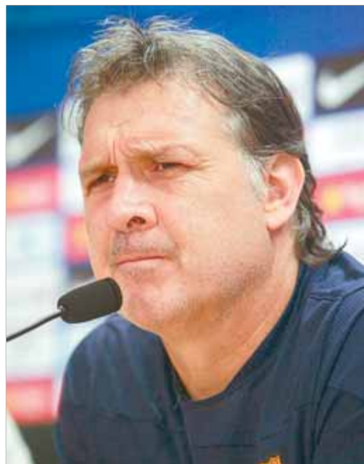
Martino no ha volgut cap central

Neymar i res més. Perquè Gerardo Martino ha considerat que no li feia falta cap reforç més. Ni el