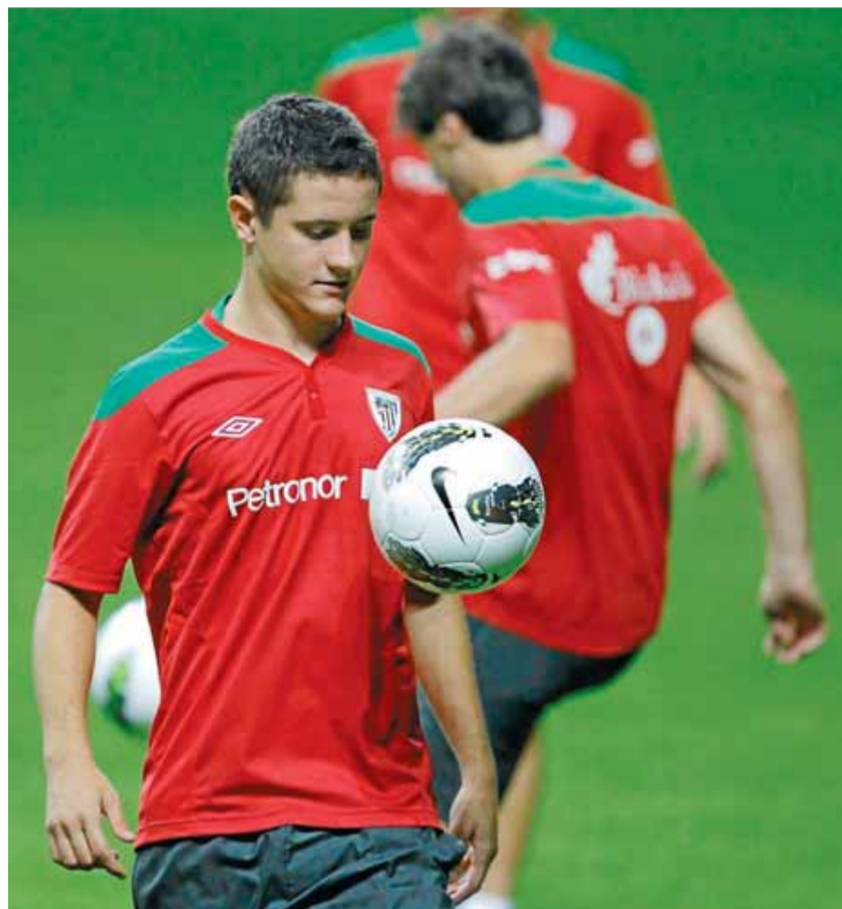
Mesut Özil, en el partit contra el Betis del debut de lliga del Madrid. A la dreta, Ander Herrera en un entrenament de l'Athletic

Internacional. El campió anglès també fracassa en el fitxatge d'Ander Herrera i Khedira, i tan sols pot lligar Fellaini en el darrer dia de mercat. Rècord de l'Arsenal per incorporar Mesut Özil