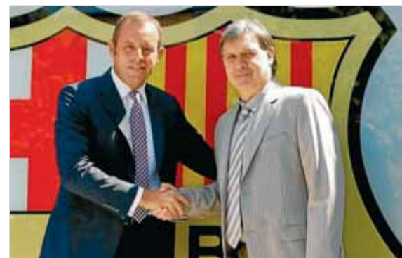
Rosell i Martino, el dia de la presentació oficial

Sandro Rosell va detallar com es va cuinar el relleu a la banqueta i l’aposta final per Gerardo Tata Martino. “És veritat que jo poso un nom sobre la taula, però la feina després la fa Zubi”, va explicar el president blaugrana, i va desvincular l’entorn de Leo Messi de la decisió presa, tal com es va comentar: “No vaig consultar el pare de Messi per fitxar Martino.” De fet, Rosell ja coneixia el tècnic argentí de la seva etapa al Brasil com a director per llatinoamèrica d’una important multinacional de roba i material esportiu. “Un dels equips que vam patrocinar era el Libertad d’Asunción, que llavors tenia d’entrenador Tata. Aquest equip seria aquí com l’Atlético, i el va fer campió quatre anys seguits. Quan anava a Asunción per feina veia els seus partits, anava als entrenaments i sovint sopava amb ell a casa del que