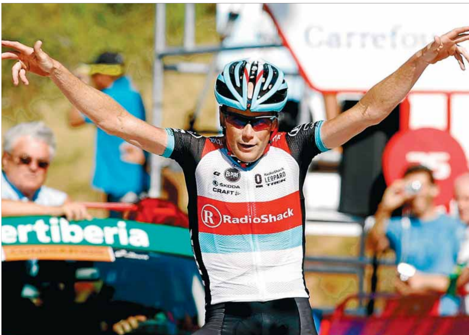
Horner celebra la segona victòria en la ronda espanyola que li va permetre recuperar la primera posició

Vuelta. El nord-americà va guanyar la primer etapa d'alta muntanya, cap dels favorits li va poder seguir el ritme, i va tornar a vestir el mallot de líder després del segon triomf parcial