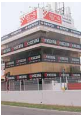
La torre de control ja llueix la nova denominació ■ EL 9

Canvi de nom. El Circuit de Catalunya oficialitza l'aposta per la metròpoli catalana