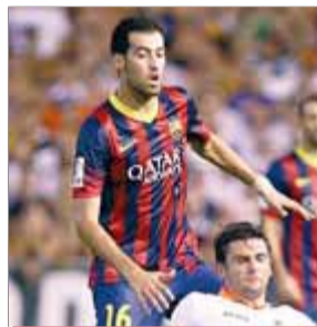
SERGIO BUSQUETS FUTBOL

Les molèsties de Mes-talla han acabat en lesió. De moment no va amb la selecció, però sembla que podria jugar el Barça-Sevilla del dia 14.