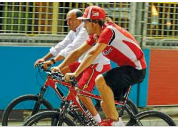
Fernando Alonso, pedalant pel circuit de Singapur

Ciclisme. El pilot de Ferrari compra la llicència de l'equip UCI i n'evitarà la desaparició anunciada fa quinze dies