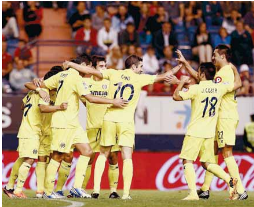
Els jugadors del Vila-real celebrant un gol a Pamplona, aquest cap de setmana

Una temporada després, però, el conjunt de la Plana ha tornat. I ho ha fet de la millor manera possible i amb la gestió més eficaç i eficient de la lliga. Amb la incorporació al gener de Jonathan Pereira a cost zero i la cessió amb opció de compra del francès Jérémy Perbet, el club valencià va aconseguir l'ascens i ara, després d'haver-se disputat tres jornades, els de Marcelino García Toral tenen els mateixos punts que el Barça, el Real Madrid i l'Atlético, és a dir, han guanyat els tres partits. El tècnic asturià en té bona part de culpa. Marcelino no només és estimat al Madrid pel fet de ser l'entrenador de l'ascens, ho és també per la manera de fer jugar l'equip. Laterals ofensius, un mig del camp constructor i confiança