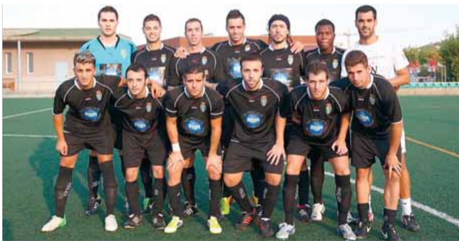
Bona part de la plantilla del Peralada abans de disputar un partit amistós