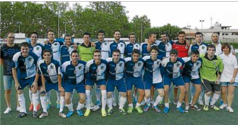
La plantilla del Banyoles abans de disputar un partit de pretemporada