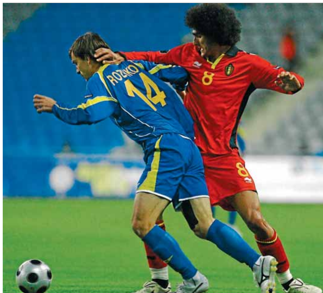
Marouane Fellaini (25 anys), a la dreta, pressiona el jugador del Kazakhstan Rozhkov

El dos referents de l'equip belga són el capità i central del Manchester City Kompany (27 anys) i el mitja punta del Chelsea Hazard (22), que ha iniciat la temporada a un nivell altíssim. La porteria és a les mans d'un dels millors porters del moment, Courtois (21), de l'Atlético de Madrid, i hi ha un suplent de nivell, Mignolet (Liverpool, 25 anys); a la línia defensiva, Vermaelen (Arsenal, 27) fa parella amb Kompany al centre (cap dels dos, però, podrà jugar divendres contra Escòcia per lesió), mentre que el lateral esquerre és per a