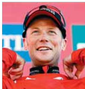
CHRIS HORNER CICLISME

La nedadora sabadellenca va fer el cinquè lloc en la clàssica travessa Capri-Nàpols i va quedar subcampiona del circuit de maratons d'aigües obertes.