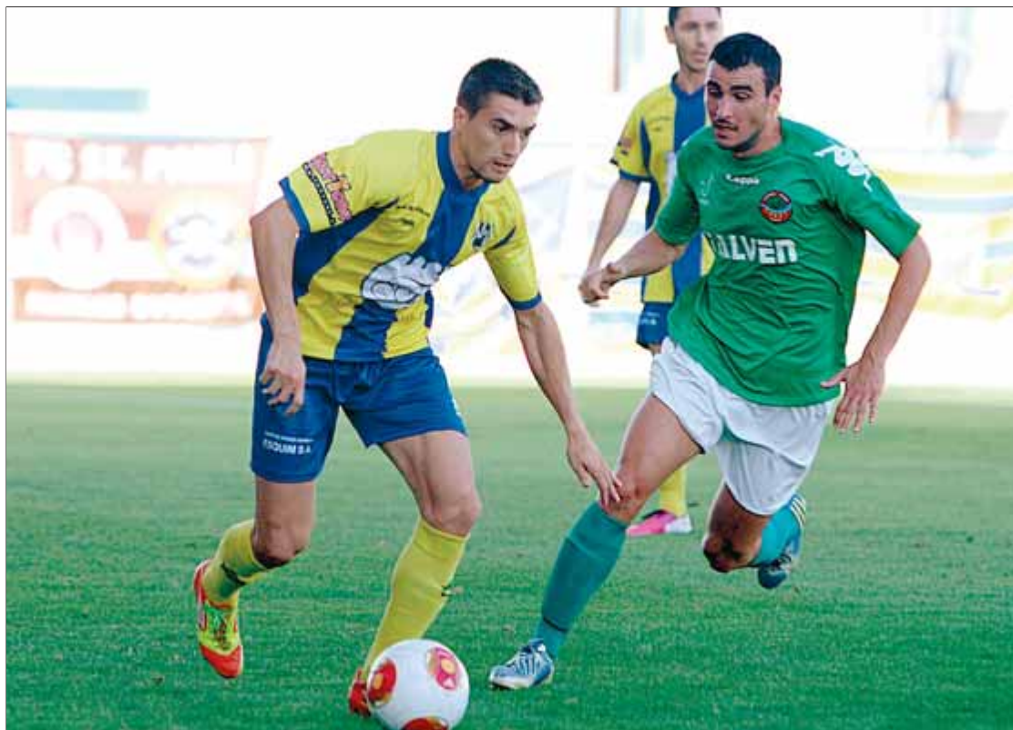
Una acció del duel del cap de setmana passat entre el Palamós i l'Ascó ■ LLUÍS SERRAT

EL NIVELL DE LA LLIGA. En la tercera divisió d'enguany crec que es poden fer dos grups. Penso que un serà el dels equips amb més experiència en la categoria, més fets a la tercera divisió. L'altre seria el dels equips que van pujar el curs passat, que es van adaptant a la tercera divisió i també els que han aconseguit l'ascens aquest mateix estiu. Entre els favorits al títol, segur que l'Europa i el Cornellà ocuparan la part alta de la classificació. Són les dues plantilles més competitives de tercera divisió i l'any passat ja van lluitar per guanyar el títol. Ara tenen experiència i, a més, penso que el Cornellà s'ha reforçat molt bé.