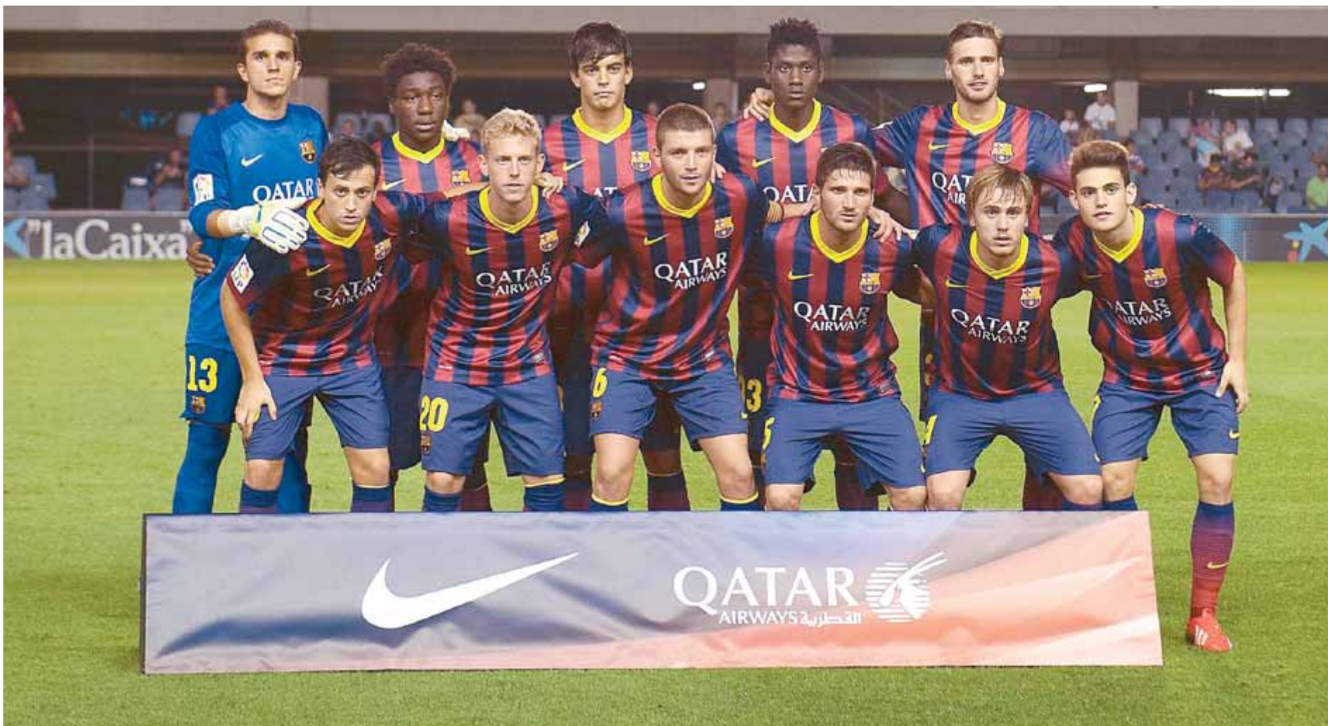
El Barça B té una plantilla amb una mitjana d'edat de 19,58 anys, la més baixa de la segona divisió A

Barça B. El filial, que ha perdut referents com ara Gerard Deulofeu, Rafinha, Sergi Roberto, Luis Alberto i Marc Muniesa, tanca la seva plantilla amb tretze cares noves i aposta per la joventut