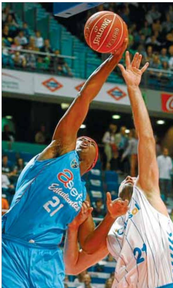
Kirksay, pugnand amb Bogdanovic per un rebot

El Fiac Joventut sempre va mirar-lo de reüll i en veure que continuava sense equip, va fer una ofensiva la setmana passada per incorporar-lo. Li va fer arribar, això sí, una proposta amb data de caducitat