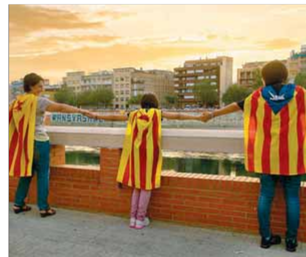
Una cadena humana com a assaig de la Via Catalana als ponts de Tortosa

demanat el Barça és no trepitjar la gespa i no tancar el Museu. Aquest ramal comptarà amb personalitats del món de l'esport que vulguin donar suport a la Via Catalana. ■