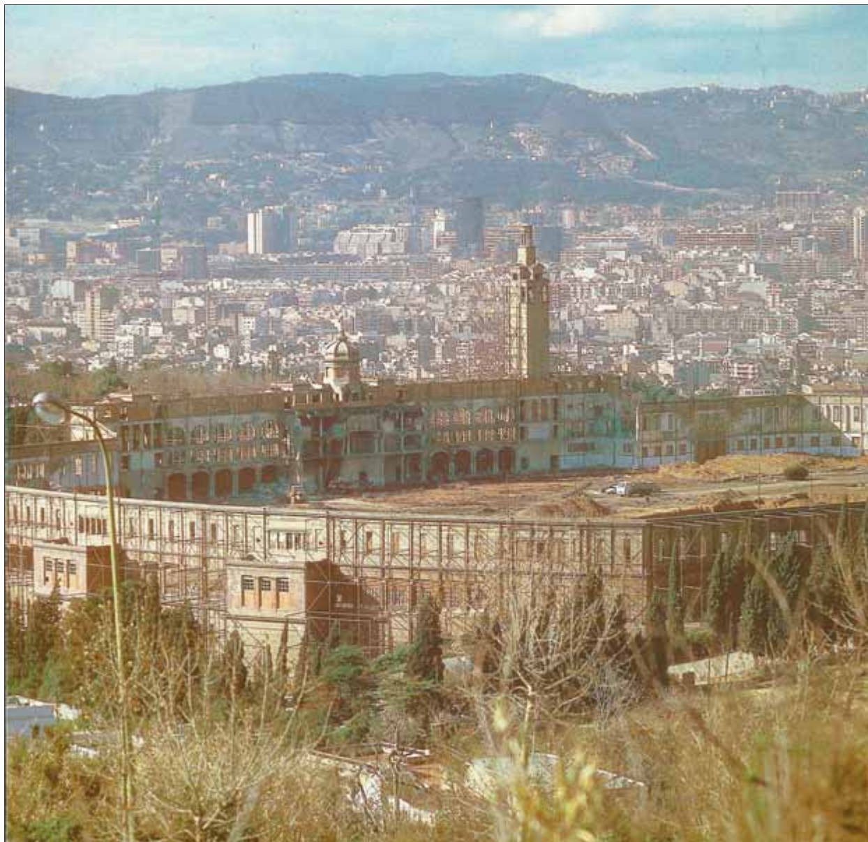
Una imatge de l'estadi de Montjuïc abans de l'inici de la remodelació ■ EL 9

Un mes més tard, el 16 de desembre, el ple del COE va aprovar "veure amb bons ulls l'interès de Barcelona per ser seu olímpica el 1992". No va ser una decisió unànime: l'expresident de la federació de tir va votar-hi en contra. El representant dels mitjans d'informació audiovisuals, Joaquín