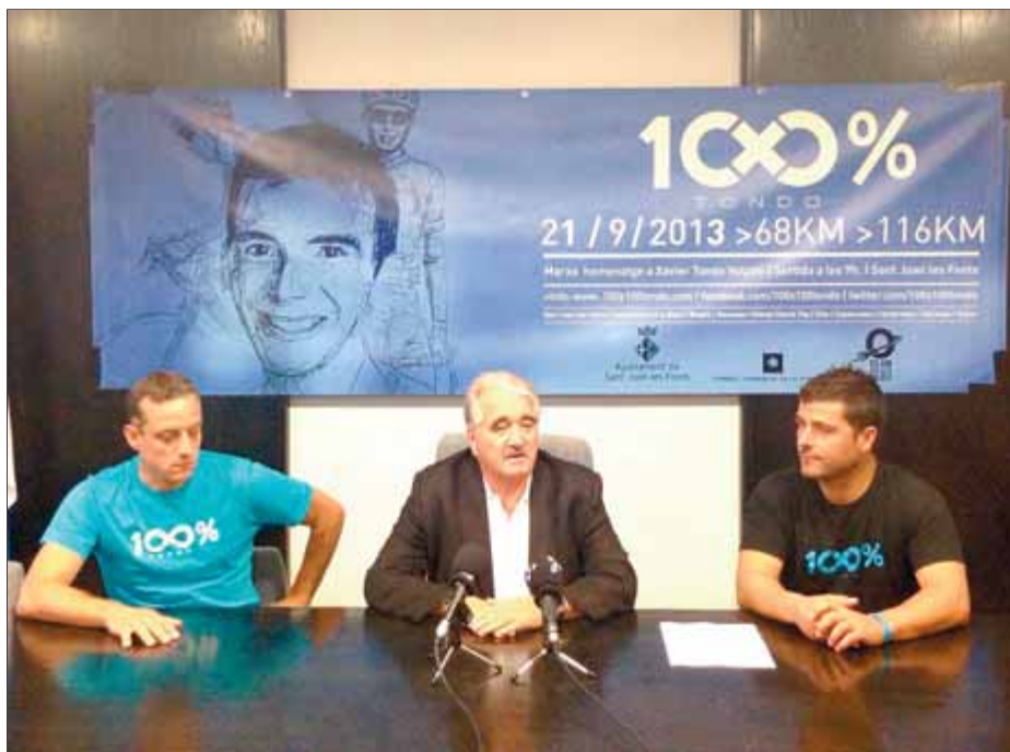
Una moment de la presentació a l'Ajuntament de Sant Joan les Fonts