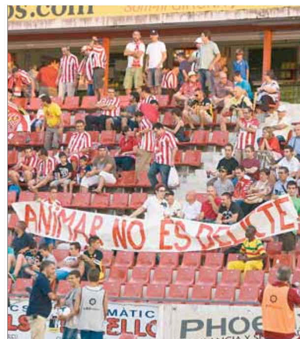
La pancarta que es va veure a Montilivi dissabte ■ L.L.S.

De cara al futur, Pegenaute es mostra obert a la possibilitat que tornin a la grada: "No és un problema d'estar dret o assegut, és qüestió de tenir un comportament cívic i no provocar. Si compleixen la llei, poden animar fins i tot drets", va manifestar. ■