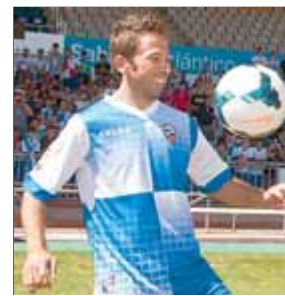
RAÚL TAMUDO FUTBOL

El nord-americà s'ha convertit en la sorpresa de la primera meitat de la Vuelta, i amb 41 anys se situa entre els principals favorits a la victòria final.