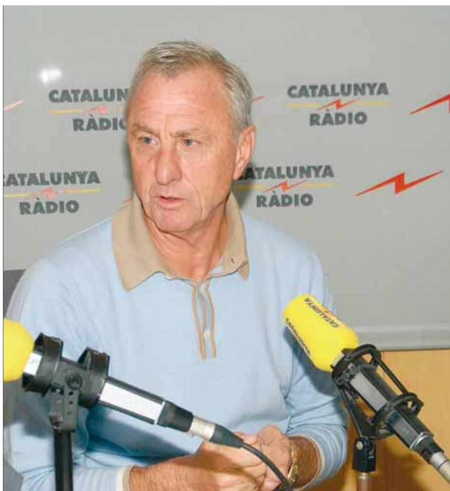
Johan Cruyff, en una entrevista a Catalunya Ràdio

Cruyff considera que la negativa a complir el contracte podria deure's a un "problema personal" amb Rosell perquè, segons va dir, des de la fundació del Barça ja ho tenen tot pre-