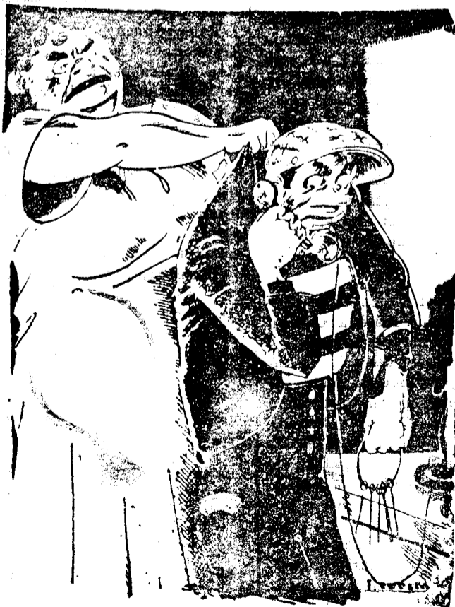
EL SEXO DEBIL

Es de notar en el acuerdo de 12 de noviembre de 1929, a más de una monstruosa ilegalidad, una notoria contra-