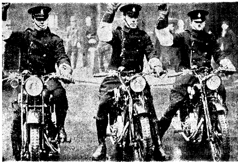
Londres.—Para el mejor reglamento de la Circulación.— Tres policías de la nueva brigada montada en motocicleta y especialmente destinada a hacer respetar las ordenanzas de la circulación.— Clisé Consorcio.