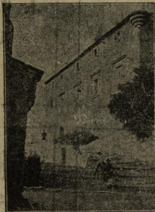
Castell de Orriols