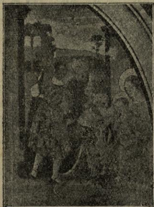
Ntra. Sra. del Mont. — Retaule

rato arriba el Capellà, qui ens saluda afablement. En l'endemà a les 5 del matí som cridats pel mosso del Santuari: ens llevem poguent contemplar la sortida del sol que, d'aquest enlairat lloc, resulta imponderable. La tremontana, que en tóta la nit ha bufat, fa que sia més fred el temps (4 graus). Una grossa carolina que hi ha resta ben badada, donant senyal de bon temps. Esmorzem vora la llar, visitem l'església que conté una esplèndida orga, el campanar ornat de tres grosses campanes i el cambril on s'hi venera la imatge de la Verge. Contemplem la immensa vista que és fruiex al cim distingint una munió de pobles, viles, ciutats, santuaris i muntanyes, per nosaltres visitats. A les 8 amb tota recansa deixem tan encisador lloc remar-