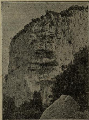
Ntra. Sra. del Mont Cingles de Roca Pastora

ciant als guardadors del Santuari per les atencions verament sol·lícites que ens tingueren, devallant pel camí de la Font de Falgàs i Lladó passant per la dressera de forta baixada i la tradicional pedra ressoladora . Visitem les interessants esglésies de Sta. Maria i Sant Feliu; dinem a càn Ferrer, en el carrer de Besalú, casa recomenable per tots conceptes pels excursionistes. A la una i mitja sortim de Lladó per la carretera que a poques passes enllaça amb la de Figueres. Passem Avinyonet i Vilafant arribant a Figueres prop les quatre. En el tren mensatger arribem a Girona a les set de la tarda contents i satisfets de tan bella i atraient excursió.