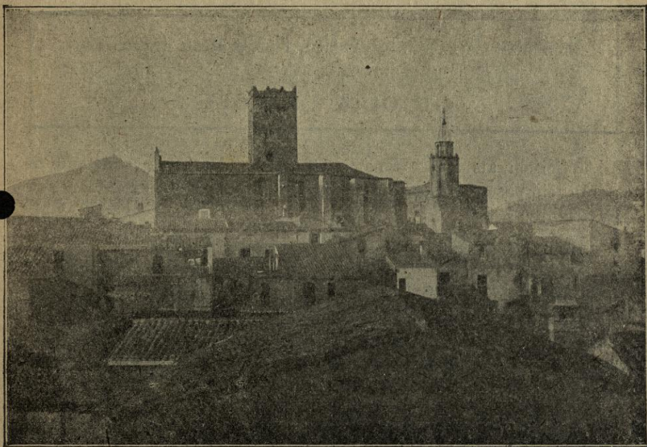
BREDA - Vista general del Monestir