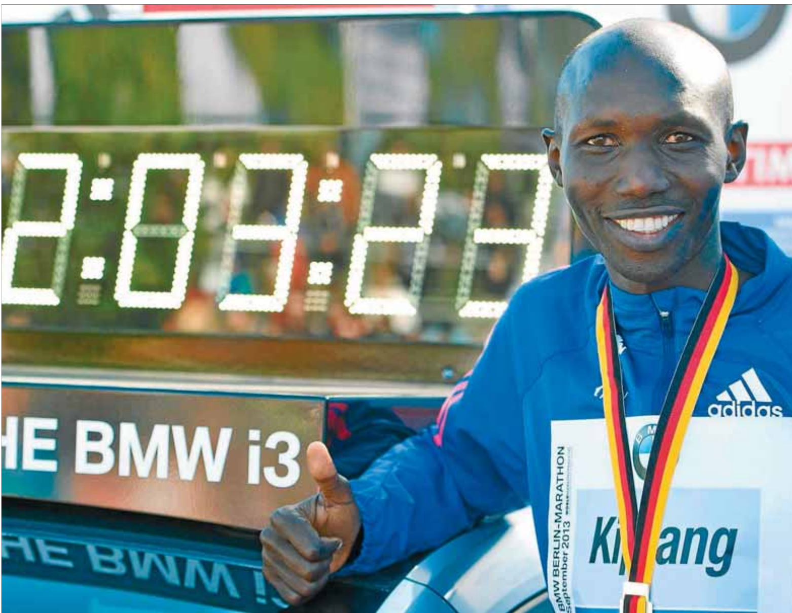
Wilson Kipsang Kiprotich posa al costat del nou registre de referència en marató