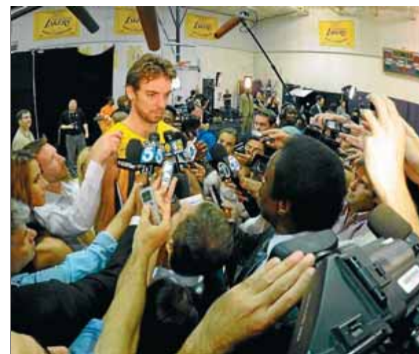
Pau Gasol, rodejat de periodistes