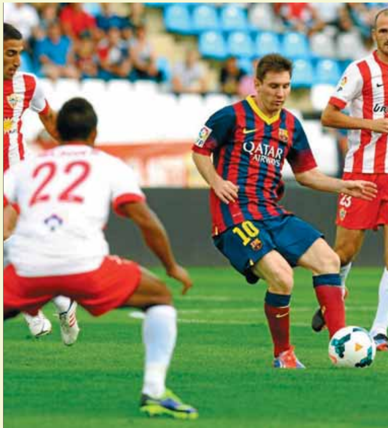
Messi elabora una de les seves magistrals jugades contra l'Almeria

Parafraçant els Scorpions jo diria que mal pesi a alguns, crec que la majoria dels barcelonistes encara s'estimen l'estil de joc del Barça. Martino potser no és un gran creador, però és un magnífic gestor de l'equip que ha tingut la responsabilitat de dirigir. Ha gestionat perfectament el sistema de rotacions al mig del camp entre Xavi, Iniesta i Cesc, la qual cosa és lògic que doni una major discontinuïtat a la forma de l'equip, però que permet mantenir en un magnífic estat de forma aquesta línia bàsica per al sistema de joc blaugrana. A Almeria va demostrar aquesta coherència quan amb la lesió de Messi no va caure en la temptació fàcil de fer sortir Neymar, sinó que va optar per fer entrar Xavi i apostar per un major control del joc i una major possessió. Un propòsit que no es va aconseguir en la primera part, sobretot amb un Almeria esperonat per la marxa de Messi, però que Tata va poder instaurar en el segon temps aprofitant la mitja part. Per cert, en l'apartat de les rotacions, cal anotar també la incògnita de si la lesió de Messi no hauria estat molt pitjor si Martino no hagués forçat algunes de les