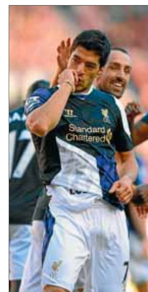
Luis Suárez

Suárez al límit del descans. El Sunderland va reaccionar amb un gol d'oportunitisme de Giaccherini, però Sturridge tornaria a aparèixer amb velocitat per assistir per segona vegada Suárez, que va retrobar-se amb el sabor del gol. ■