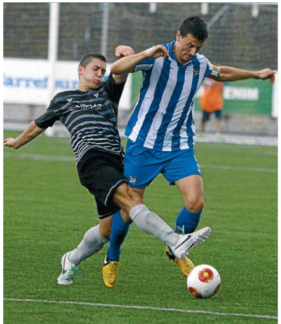
Murga aguanta la pressió d'un rival del Gavà ■ LLUÍS SERRAT

Després d'uns minuts de relaxament, després de l'inici boig, el Figueres va anar guanyant terreny al rival fins que, en el 38',