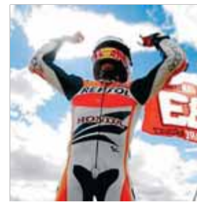
MARC MÁRQUEZ MOTOCICLISME

El capità del Barça va completar ahir un altre entrenament amb el grup i cada vegada està més a prop de poder tornar a jugar. Ell és optimista.