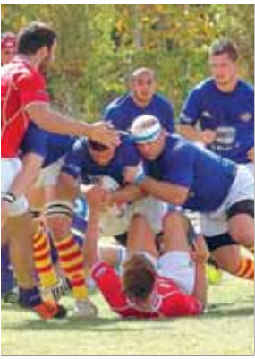
Els catalans van superar l'equip de Madrid ■ EL 9

Rugbi. La Santboiana sap patir i guanya al Complutense