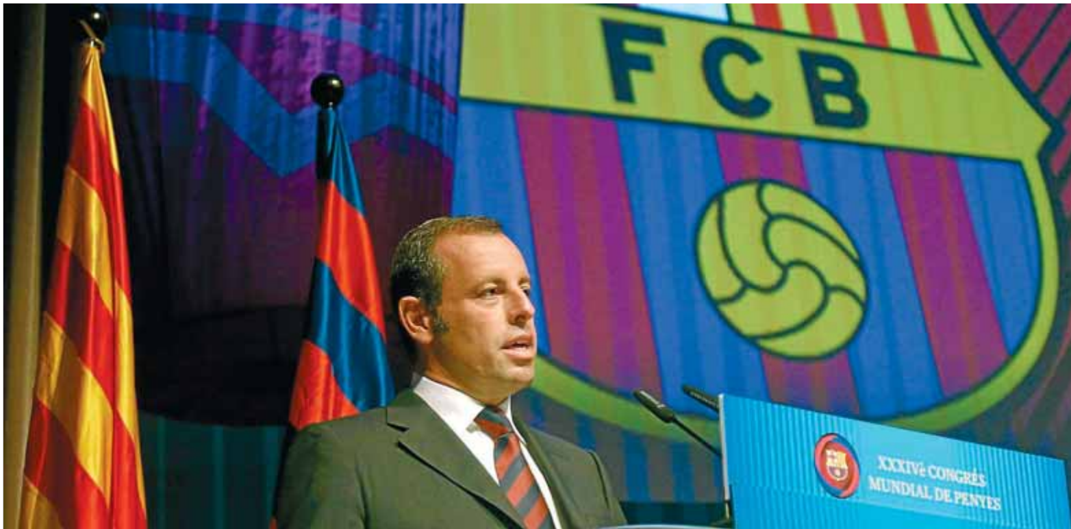
Sandro Rosell, president del FC Barcelona. Avui un grup de socis inicien els tràmits per presentar una moció de censura contra ell