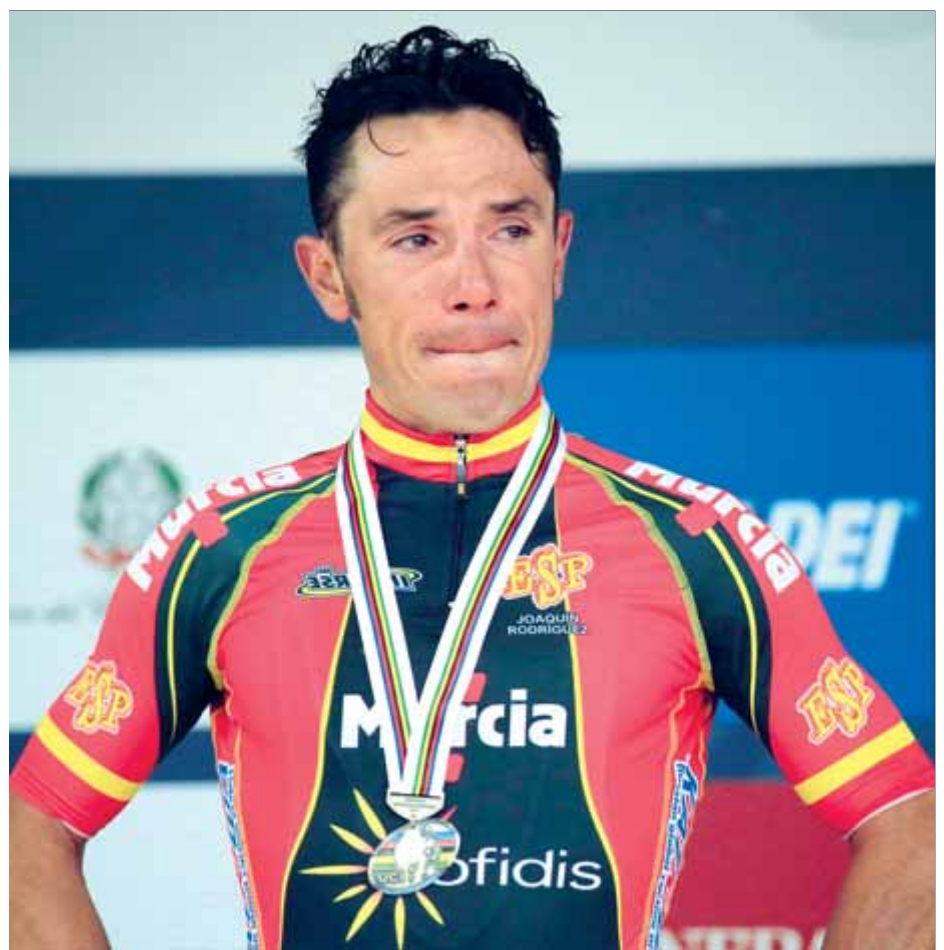
Joaquim Rodríguez, amb llàgrimes als ulls després de perdre la medalla d'or ■ EFE

Purito es resigna, a la mateixa línia de meta ■ EFE