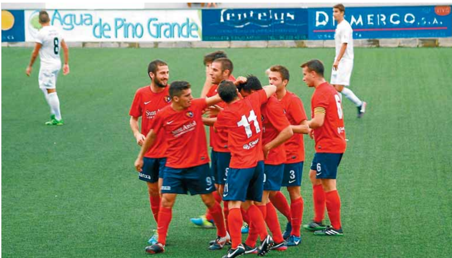
Els jugadors de l'Olot celebren un dels quatre gols del matx contra l'Olímpic de Xàtiva

Efectivitat màxima. L'Olot goleja l'Olímpic (1-4) i aconsegueix la primera victòria fora de casa. Els de Vilchez no van perdonar en els metres finals i abans del descans vencien 0-3 (43')