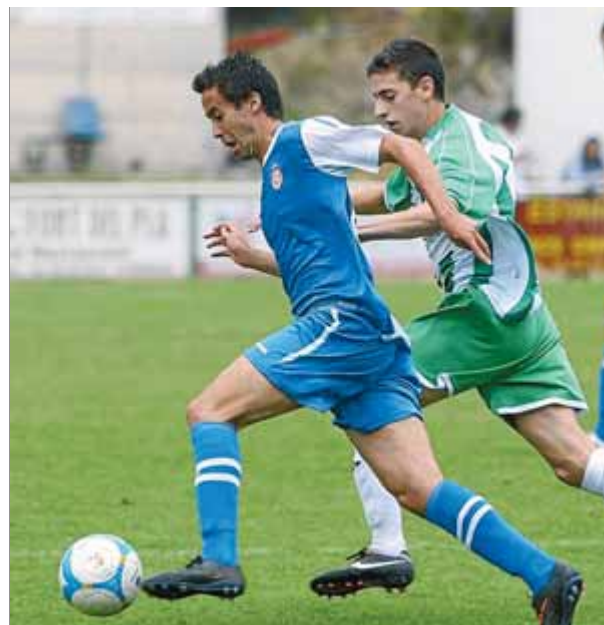
Una acció del partit jugat ahir a la Jonquera