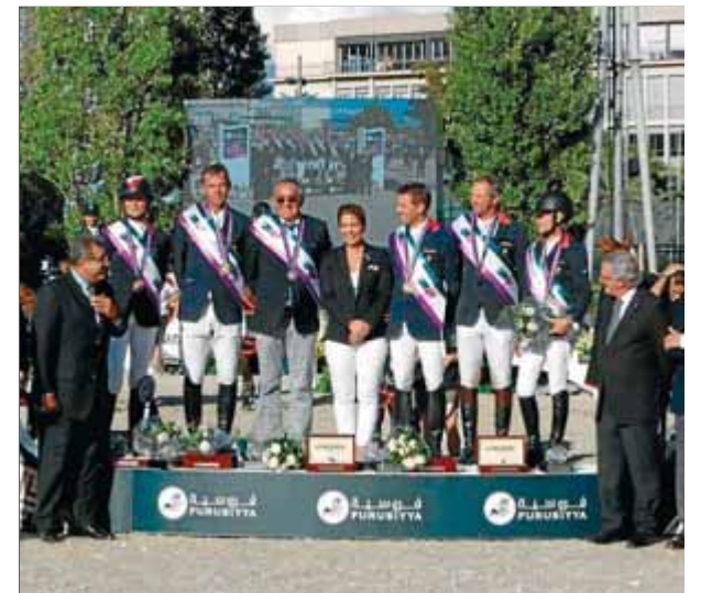
L'equip francès, en el podi

el seu equip a la segona posició. El podi el va completar l'equip d'Irlanda, seguit d'Holanda, Bèlgica, el Canadà, Ucraïna i la Gran Bretanya. L'holandès Jeroen Dubbeldam va ser escollit com a millor genet de la final per un jurat format per l'expilota de motos Alex Crivillé i l'extennista Conchita Martínez. ■