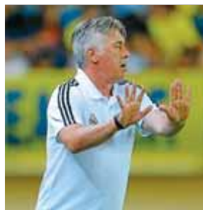
CARLO ANCELOTTI FUTBOL

De campió només n'hi ha un, però la plata que va aconseguir el de Parets del Vallès en el mundial de ciclisme de la Toscana, té gust d'or.