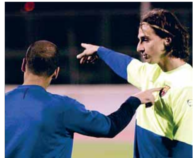
Pep Guardiola i Zlatan Ibrahimovic, discutint en un entrenament, el desembre del 2009, als Emirats Àrabs

sa, com col·legials davant del mestre". Per acabar, a més d'elogiar Mourinho, Ibrahimovic creu que el de Santpedor ha escollit el Bayern "perquè és un equip que funciona també sense ell i era complet", a més d'afegir que "ha portat nous jugadors, però no els necessita". ■