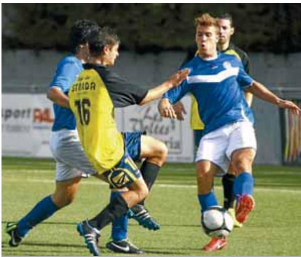
Imatge d'arxiu d'un matx del Vidrerenc a Bescanó ■ L. S.