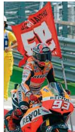
Marc Márquez, amb la seva bandera

va el seu club de fans– i Marc Márquez. El guanyador de Moto GP no es va aturar al lloc on oferien les banderes espanyoles (el mateix en les tres curses) i va seguir fins que va trobar el lloc on li van subministrar la seva. Aquests són els fets. De les intencions, que en parlin els protagonistes. ■