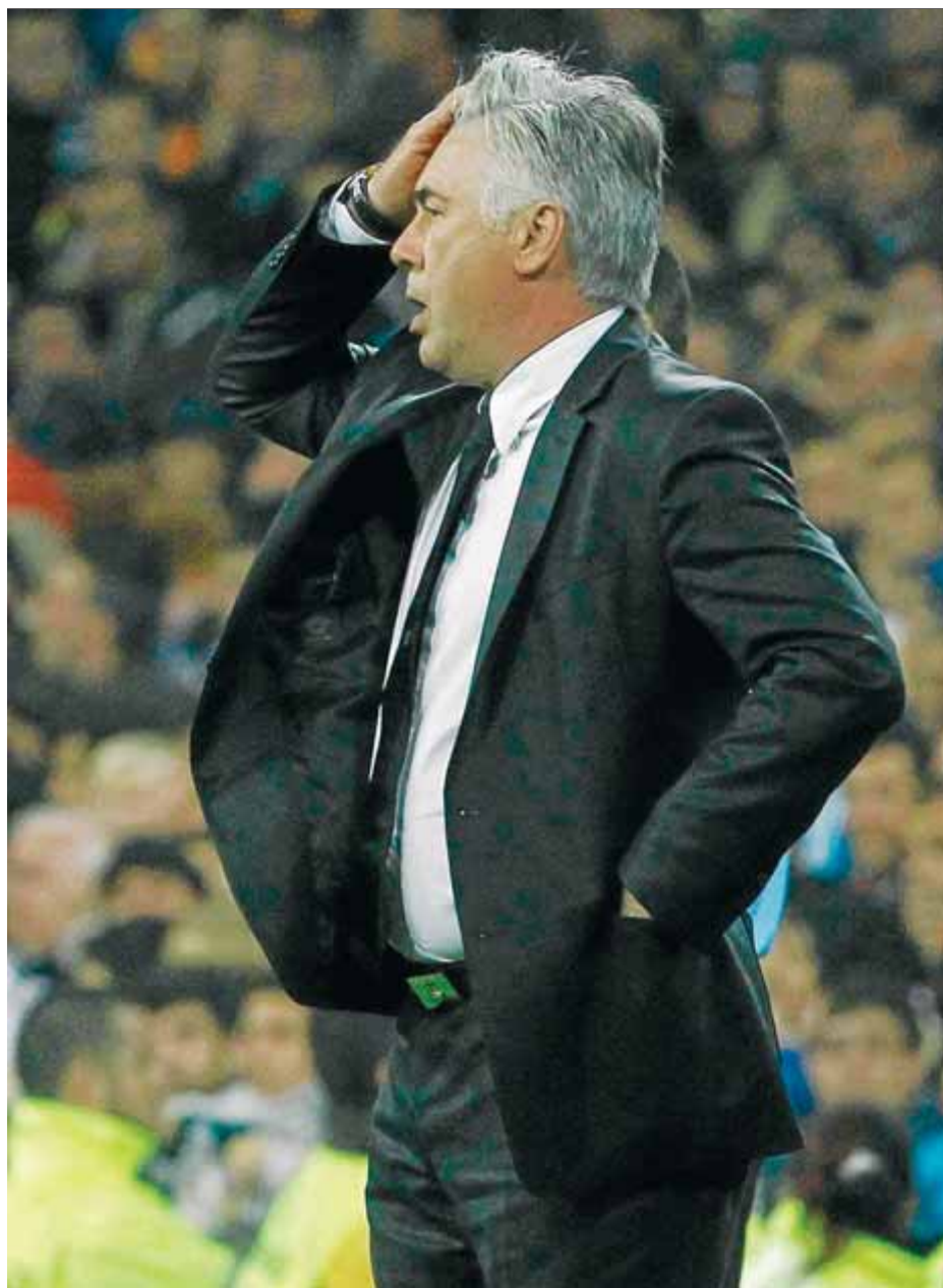
Ancelotti no troba l'engranatge per al seu Madrid

Possiblement, al jugador que més li estigui afectant la marxa de l'alemany sigui Cristiano Ronaldo, solitari i tenallat en les seves accions. Isco ha entrat amb el peu dret al club, però no ha estat capaç d'explotar les virtuts del portuguès com ho fes el jugador de l'Arsenal, el seu màxim assistent. Precisament Cristiano va ser dels pocs jugadors que va treure el cap per la zona mixta del Bernabéu, i ho va fer per exculpar de la situació a Ancelotti, dirigint totes les seves crítiques a ell mateix i, per extensió, als seus companys. "Cal reflexionar, ens ha faltat ritme i mobilitat", va dir Ramos, que va recordar, no obstant això, que l'important "no és com es comença sinó com s'acaba", va sentenciar l'astre de Setúbal intentant apagar l'enèsim incendi que viu el Bernabéu. ■