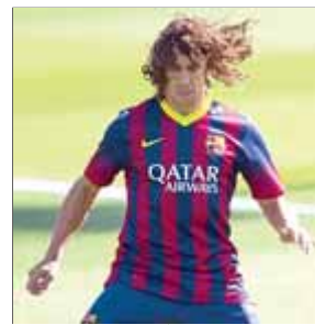
CARLES PUYOL FUTBOL

El tècnic italià comença a ser qüestionat. El Madrid ja ha deixat escapar cinc punts en la lliga i no juga bé. Contra l'Atlético, va rebre els primers xiulets.