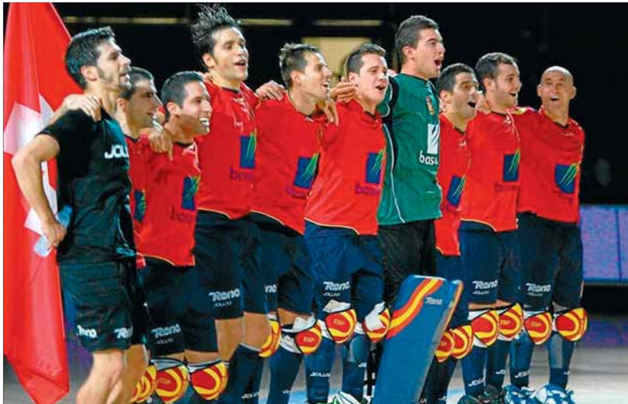
Els jugadors de la selecció espanyola celebren el títol mundial després de la final