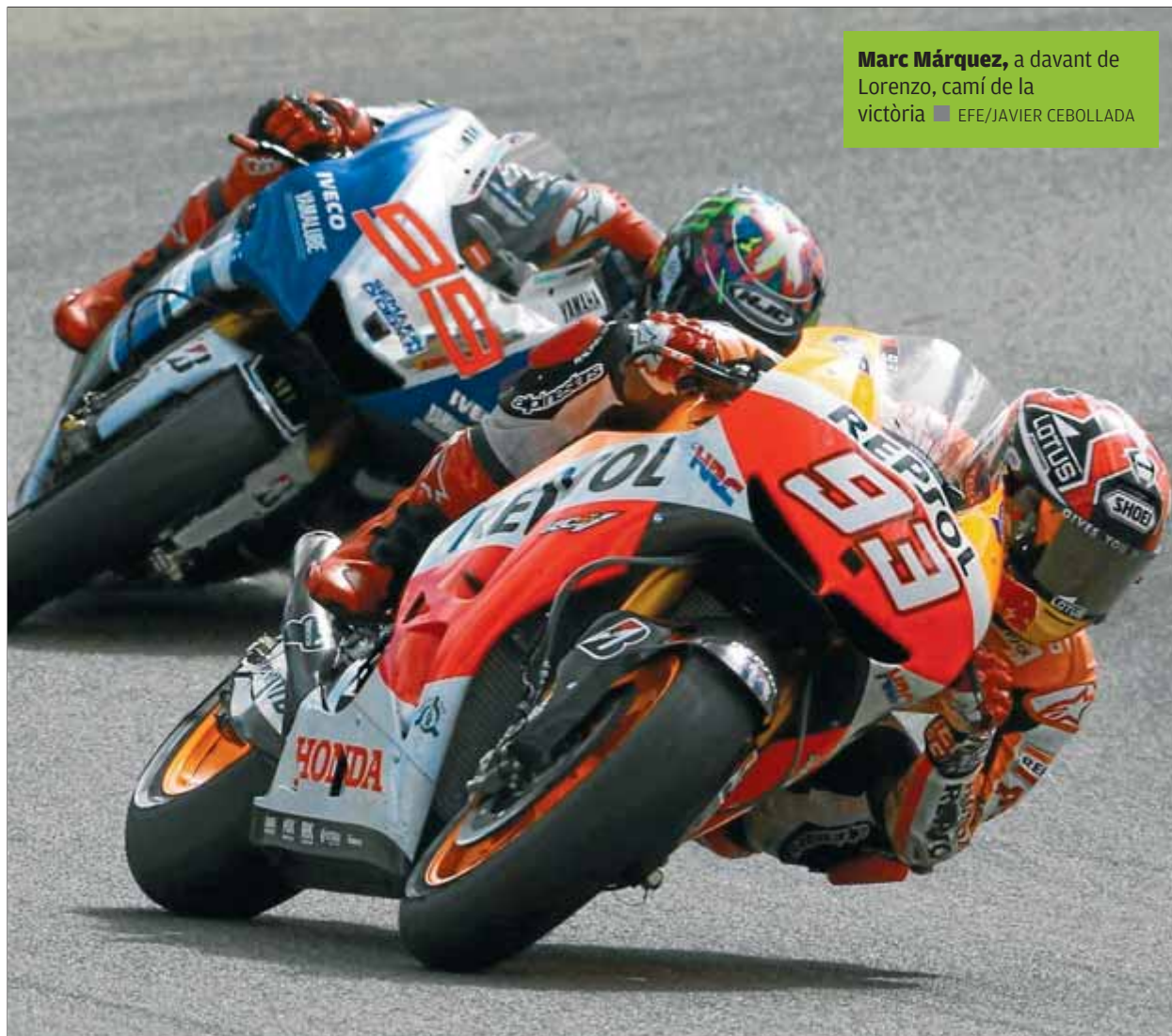
Marc Márquez, a davant de Lorenzo, camí de la victòria

Primer, amb la connivència de Lorenzo, que va reposar un moment. I després, quan el de Yamaha va intentar retallar el marge, amb la confiança que dona veure el títol mundial pintat en l'horitzó. ■