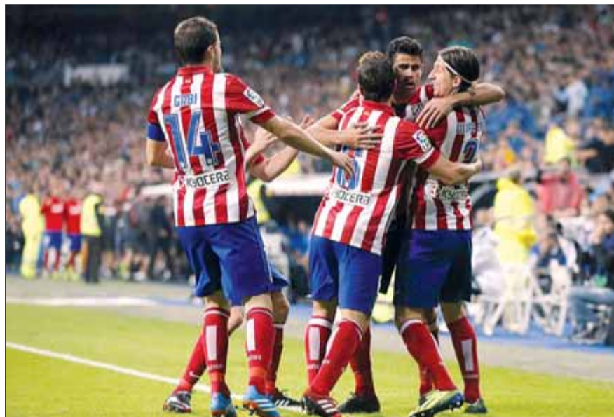
Els jugadors de l'Atlético de Madrid s'abracen al Santiago Bernabéu

A mb l'assalt al Santiago Bernabéu del dissabte passat, l'Atlético de Madrid va establir un nou rècord en l'entitat del Manzanares: arrencar una lliga amb set victòries consecutives. És el millor inici en la història del club, ja que cap altre equip ho havia aconseguit, superant així l'Atlético d'Otto Bumbel, el curs 1964/65, i el de Luis Aragonés, la campanya 1991/92, que van quedar-se amb sis triomfs. Un dels referents d'aquest últim conjunt, la temporada 91/92, era Manolo Sánchez. Davanter centre, que va ser el pitxitxi amb 27 dianes d'una lliga que va adjudicar-se el Barça, rememora per a El 9 com era aquell conjunt: "Érem un magnífic equip. Vam fer una grandíssima temporada i ens vam quedar molt a prop del títol". Els colchoneros tenien a les seves files futbolistes com ara Bernd Schuster i Paulo Futre i van poder posar la cirereta aixecant la copa, guanyant el títol al Real Madrid al seu feu, com també van fer els de Simeone l'any passat. "La sensació es que l'Atlético viu un moment de felicitat plena. En els últims anys ha recuperat aquella grandesa que anteriorment havia perdut. Nosaltres teníem bons jugadors, una gran plantilla i un gran tècnic, però penso que aquesta plantilla actual està a un