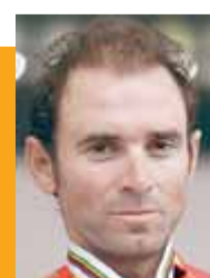
ULI HOENEß. President Bayern

“Satisfacció és fer les coses com un creu que les ha de fer”