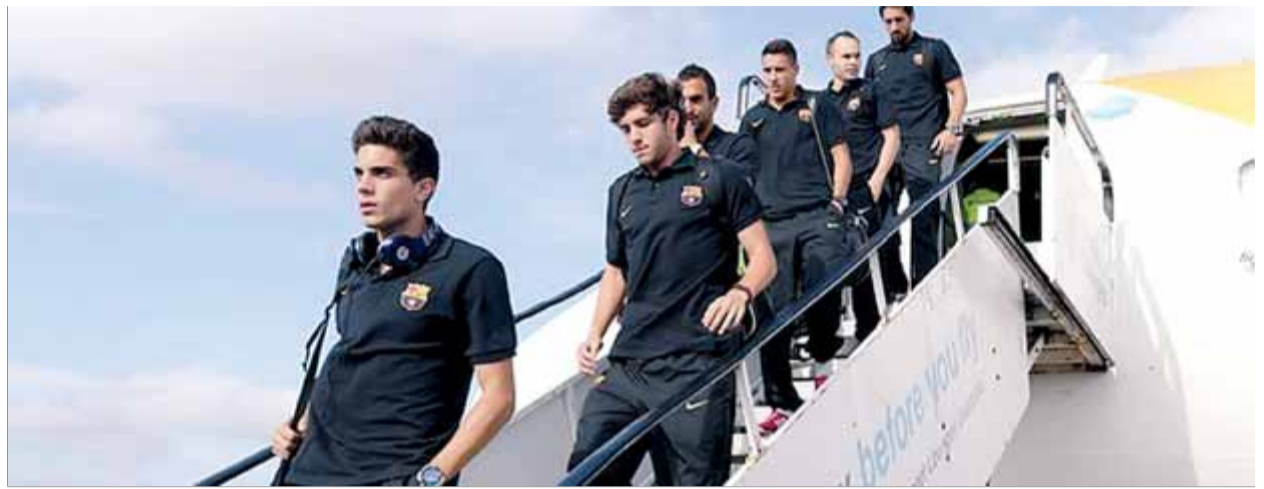
Els jugadors del Barça, baixant de l'avió en aterrar a Glasgow