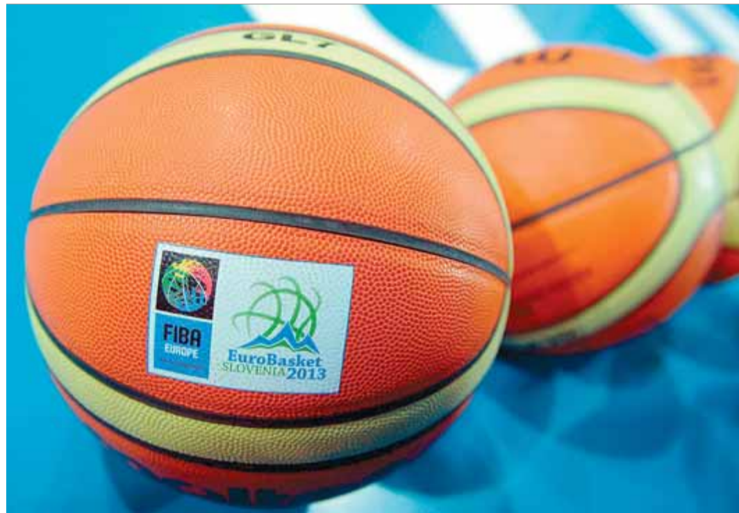
Els regals en forma de 'wild cards', nocius per al bàsquet

Segurament peco d'il·lús, però hi hauria una altra via per assignar les quatre vacants i potser també reportaria ingressos a la FIBA. Es tractaria d'organitzar una qualifying round , una repesca amb una dotzena d'aspirants en una seu fixa –en el cas que ens ocupa, es podria fer a Barcelona o Madrid– i unes setmanes abans de la fase final. O hi hauria una manera més atractiva de començar a generar interès de cara al mundial? Que com se seleccionen els aspirants? Senzill. S'agafa el rànquing de la FIBA i es proposa a les dotze seleccions més ben classificades sense el bitllet. Si alguna declina competir, es delega la invitació a una altra. Per exemple, de les deu pri-