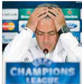
JOSÉ MOURINHO FUTBOL

El portuguès va deixar tothom plantat en la roda de premsa a Bucarest, abans del matx de la Champions perquè no li agradaven les preguntes.