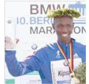
MARATÓ DE BERLÍN ATLETISME

El català ha revalidat el títol de campió de la copa del món d'ultra-trail, confirmant que és el millor especialista mundial en aquestes proves.