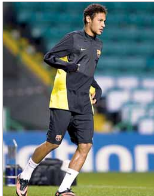
Neymar ahir a Celtic Park

Perquè desenganyem-nos, el Barça necessitarà el millor Neymar sense l'argentí al camp. D'ell dependrà en gran mesura que l'equip mantingui la capacitat de desequilibri, perquè ara mateix és el futbolista a qui toca fer aquest paper i que està en més bona forma. Iniesta està arrencant de mica en mica, mentre que Alexis i Pedro,