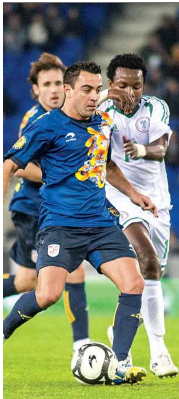
Xavi fa una passada en l'últim partit de la selecció contra Nigèria, el gener passat

Més enllà de la data i el format, la FCF treballa per tancar les qüestions del rival, l'estadi i el seleccionador. Subies va dir que la selecció rival serà semblant a les dels últims anys: "Una selecció europea, africana o de l'orient mitjà, que no tingui un cost alt." Encara s'ha de decidir també l'escenari, que, depenent del rival i de la disponibilitat, podria ser fora de Barcelona. Del relleu de Cruyff com a seleccionador no s'en sap el nom, però sí quin perfil es busca: "La seva imatge hauria d'estar vinculada al moment que viu el país, hauria de tenir noves idees i ser una persona que dignifiqui i el nom de Catalunya i la selecció; busquem algú que s'impliqui amb la federació més enllà del partit." ■