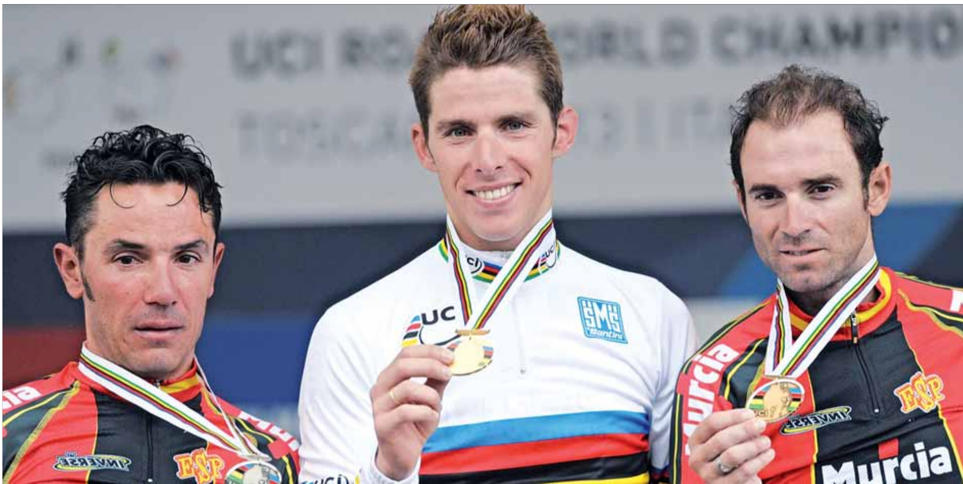
Joaquim Rodríguez, Rui Costa i Alejandro Valverde en el podi d'honor del campionat del món

Mundial. La cita florentina va deixar un dubte que va expressar Purito: “Per què no va sortir Valverde?” I, sobretot, una incertesa d'impossible resolució: el català hauria guanyat?