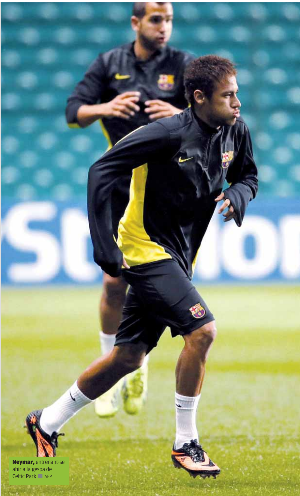
Neymar , entrenant-se ahir a la gespa de Celtic Park

NEYMAR • El brasiler, que va descansar a Almeria, ha d'aportar a Celtic Park el desequilibri habitual de l'argentí CESC . En principi, jugarà de fals davanter centre, com ha fet les vegades que no ha estat Messi