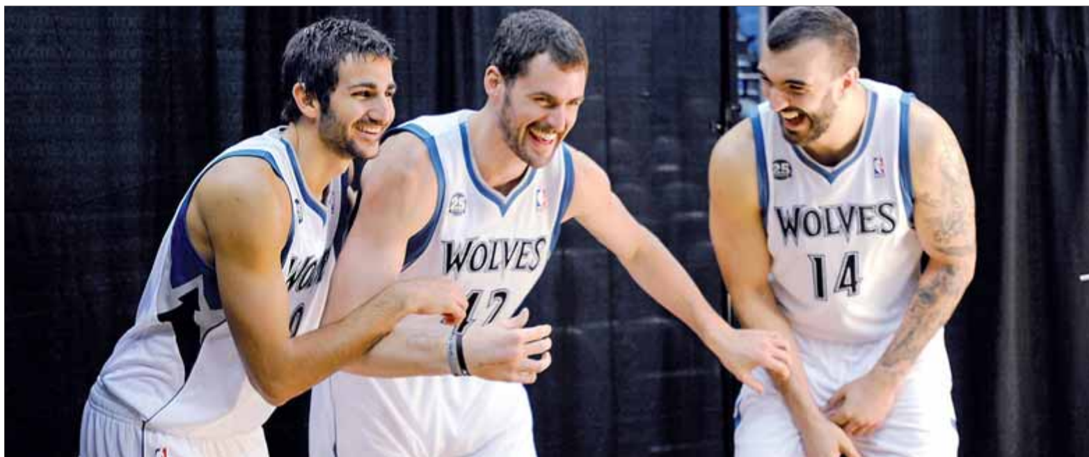
Ricky, fent broma amb Kevin Love i Pekovic durant la sessió fotogràfica d'ahir dels Timberwolves