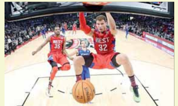
Blake Griffin, en l'últim All Star