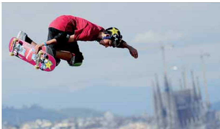
Una imatge dels X Games a Barcelona

Les semifinals masculines es disputen demà al matí entre el Terrassa-Atlètic Barceloneta (11.30 h) i el CN Barcelona-CN Mataró Quadis (13 h). ■