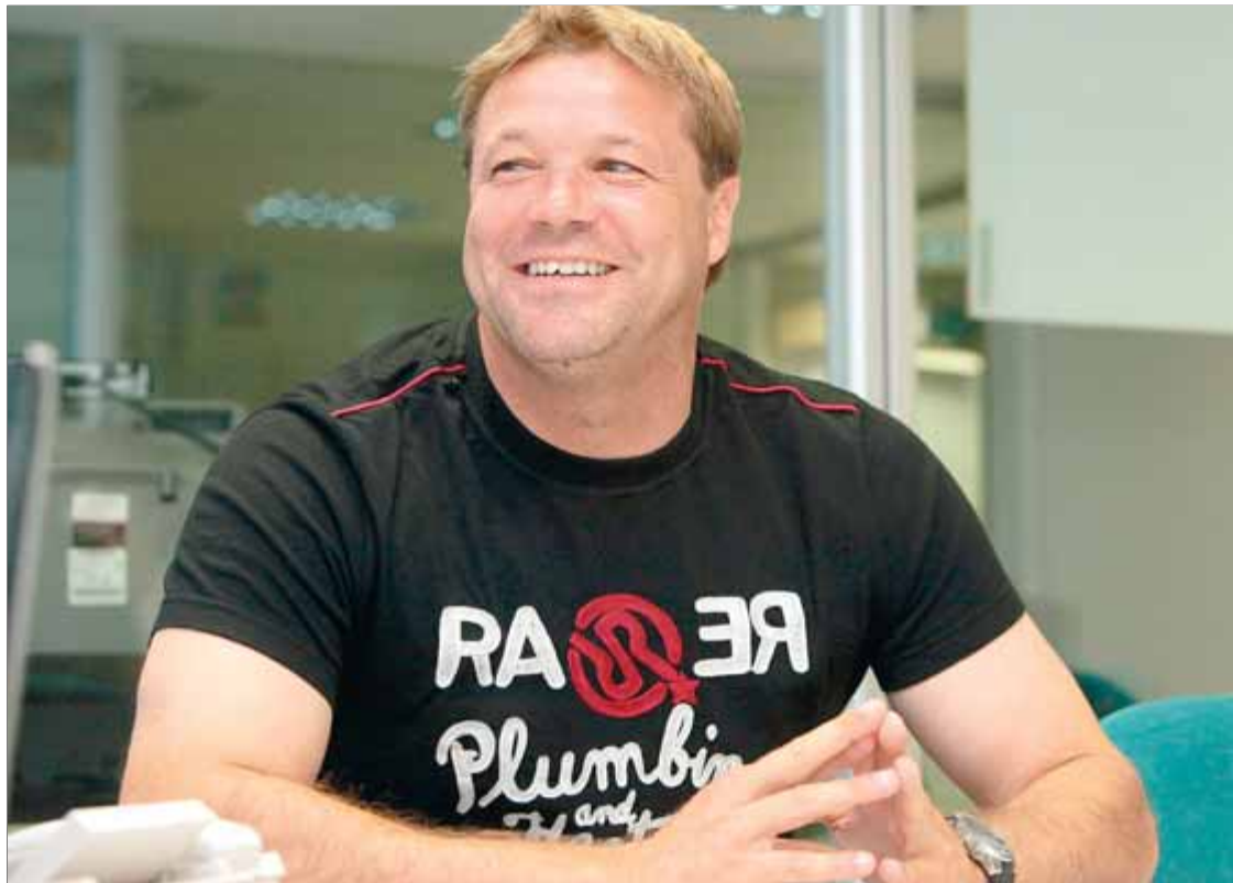
Salamero, en un moment de l'entrevista

Sí, encara ho faig. Sóc conscient que estic en un projecte nou, però em costa una mica. El meu fill va néixer el dia de l'ascens i he estat molts anys anant cada