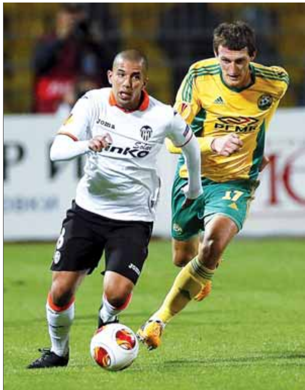
Feghouli, autor del segon gol valencianista