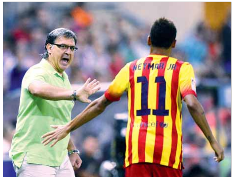
Neymar, amb Gerardo Martino, al camp de l'Atlético de Madrid

Neymar, que ha concedit una entrevista a TV3 que es podrà veure com a prèvia del clàssic que disputaran el Barça i el Real Madrid al Camp Nou el dia 27 d'octubre, parla també del bon moment que està vivint, amb set victòries en set partits en la lliga i dues en dos partits en la lliga de campions, i elogia la unió del grup. "El component més important del Barça és la unió del grup. Aquesta unió ens fa cada dia més forts i ens ajuda a aconseguir victòries", diu Neymar, que explica en l'avançament que s'ha fet de l'entrevista que està ju-