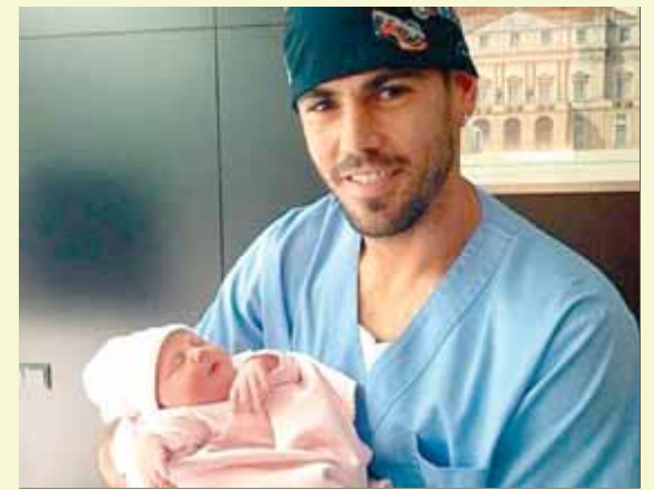
Víctor Valdés presenta la seva filla