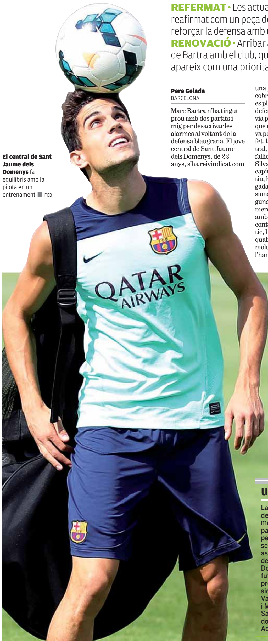
El central de Sant Jaume dels Domenys fa equilibris amb la pilota en un entrenament

REFERMAT • Les actuacions recents del jove central l'han reafirmat com un peça de garanties en la plantilla, i l'opció de reforçar la defensa amb un fitxatge es desinfla PROCÉS DE RENOVACIÓ • Arribar a un acord per allargar la vinculació de Bartra amb el club, que expira el 30 de juny de l'any que ve, apareix com una prioritat per a la secretaria tècnica