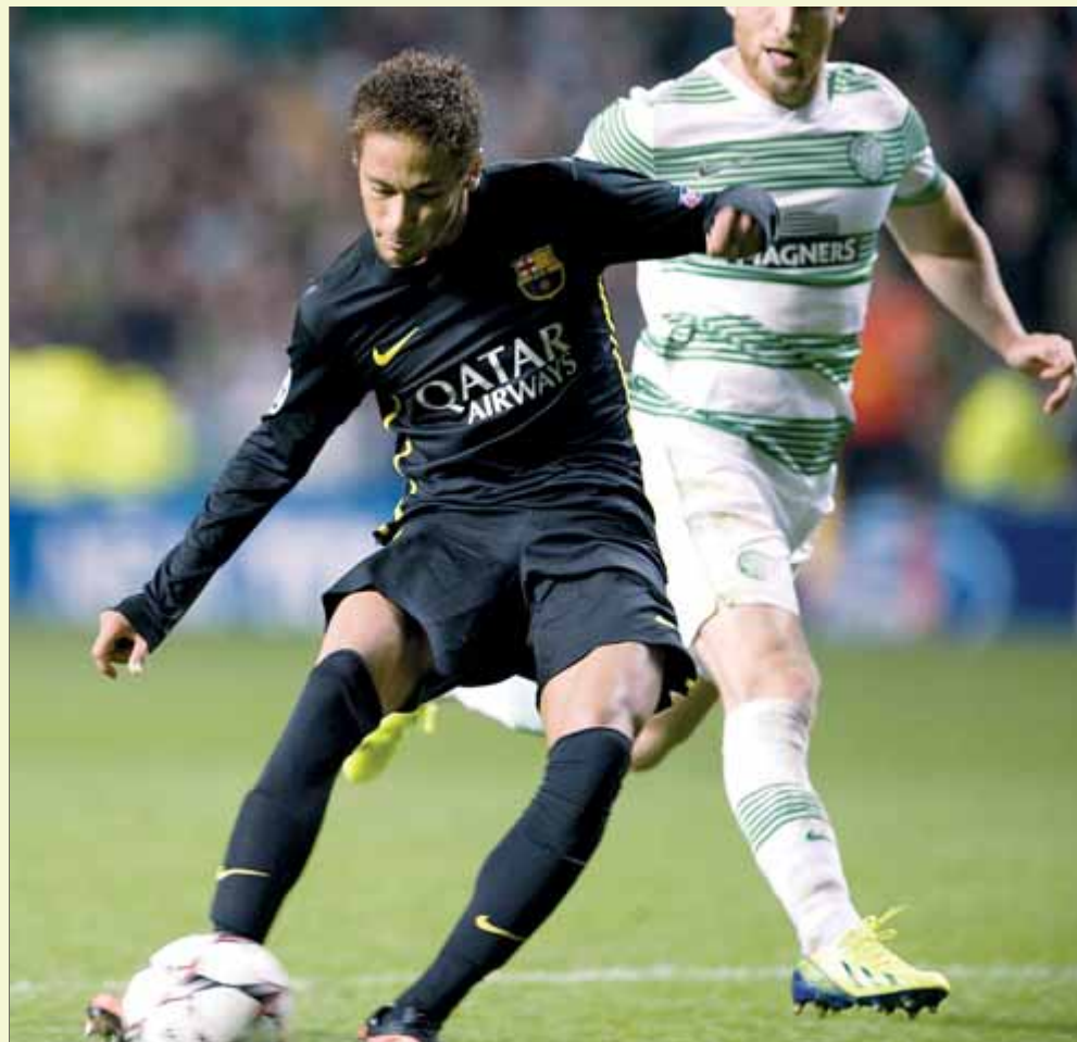
Neymar, en el partit de dimarts al camp del Celtic

Ni amb el Santos ni amb la selecció del Brasil, Neymar havia jugat mai així, entre altres coses, perquè no hi ha cap equip al món que s'exhibeixi amb aquest dibuix tàctic. El brasiler aprèn ràpid, ni que sigui veient els moviments de Messi en els partits i entrenaments: es va acostar a Sergio, Xavi i Iniesta per guanyar superioritats a tres quarts de camp i per, al mateix temps, generar espais a l'esquena dels centrals Van Dijk i Ambrose. Un espai, per cert, que ell ocupava amb esforç i celeritat quan la pilota marxava a la banda. La seva mobilitat intel·ligent va suposar la certificació d'allò que ja imaginàvem: Neymar seria un excel·lent fals 9 seguint la premissa inequívoca que els millors jugadors de l'equip