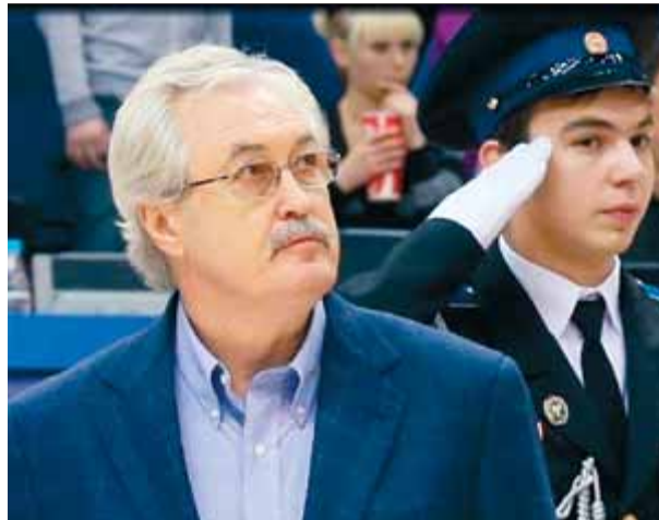
Belov, en un homenatge del CSKA, fa un any ■ CSKA BASKET

Porter de futbol i atleta de petit, el seu 1m90 va cridar-lo per al bàsquet i des de ben jove es va veure que no seria en va. Amb 17 anys ja jugava en la primera divisió russa, amb 22 va debutar amb l'URSS i dos anys més tard arribava al CSKA. Des d'aleshores i fins al 1980, l'èxit i Belov van formar una parella indestructible. Gairebé imparable en l'1x1, escorta de tir letal a una mà que dominava amb naturalitat els fonaments del joc de perímetre, insensible en les darreres possessions, a les 18 medalles amb la selecció –l'or de Munic 1972, en la final dels tres segons guanyada als Estats Units 51-50, n'és el cim–