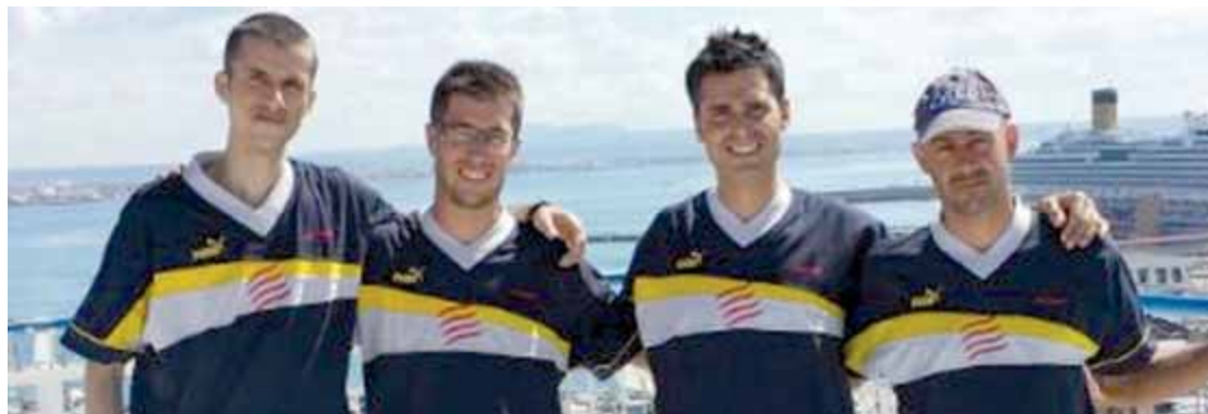
Els membres de la selecció catalana d'apnea que van participar a l'estatal.