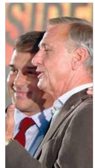
Cruyff, amb Laporta

na, el Barça ha fet efectiu el pagament dels 300.000 euros que reclamava Cruyff, després que la junta directiva demanés a la fundació de l'holandès documents per saber que s'invertirien els diners que havia de rebre. ■