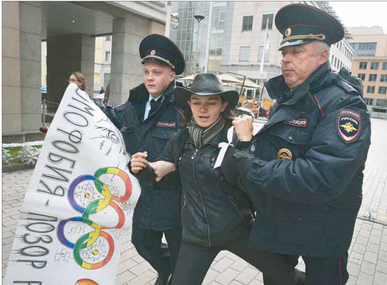
La policia deté una activista que protesta contra la llei homòfoba davant de l'edifici del comitè organitzador dels Jocs

Des d'aquesta setmana tenen un aliat de luxe gràcies a les declaracions del nord-americà Bode Miller, un dels millors esquiadors d'aquest segle i també un dels personatges més peculiars i amb una personalitat més forta del circ de la neu. Iconoclasta, rebel i anàrquic, aquest fill de hippies de 35 anys no té mai la necessitat de mesurar les seves paraules i va carregar fort contra la llei russa: "És absolutament vergonyós que hi hagi gent i països tan intolerants i ignorants." Miller no es va quedar aquí i també va criticar el Comitè Olímpic Internacional (COI) i l'americà (USOC): "Demana a un atleta que vagi a un lloc a competir i a representar una filosofia i després dir-li que no pot expressar els