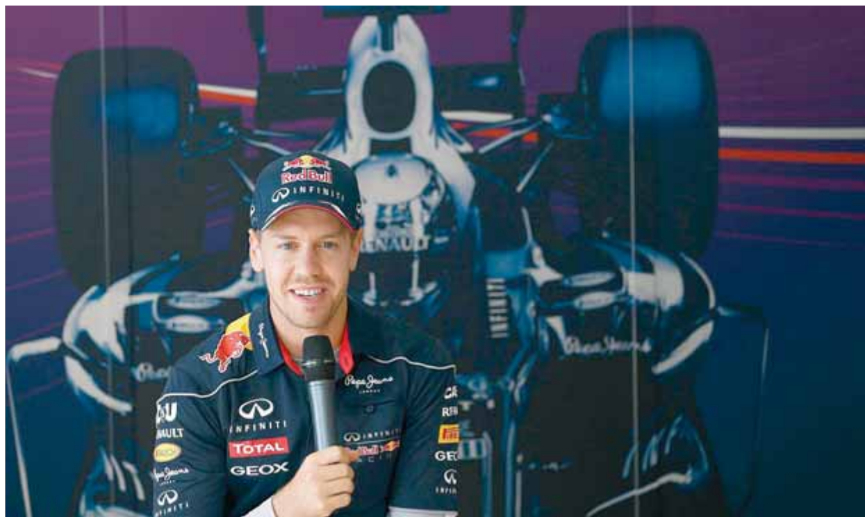
Un distès Vettel parla sobre el 'secret' del seu Red Bull, ahir