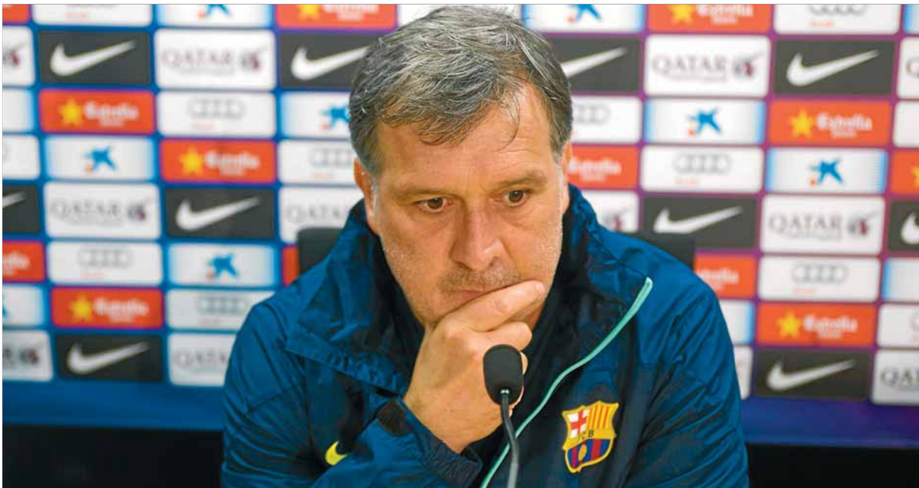
Gerardo Martino, pensatiu ahir a la sala de premsa de la ciutat esportiva

Gerardo Martino. El tècnic argentí elogia el bon partit fet per Neymar contra el Celtic, però assegura que no se l'ha de pressionar perquè ocupi el paper de Messi durant la seva absència