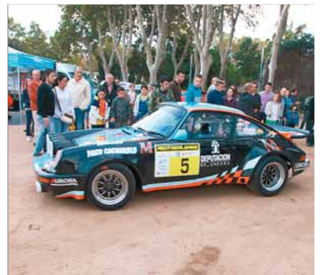
La zona d'assistència a la Devesa, l'any passat

En regularitat Seat ha inscrit set cotxes, amb Cañellas (124-2000) i Rius (Ibiza 1.5) com a pilots de renom, al costat de diversos periodistes. ■