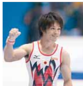
KOHEI UCHIMURA GIMNÀSTICA

El Garmin Barcelona i el Challenge Barcelona-Maresme faran demà del triatló un dels espectacles esportius a seguir a la costa catalana.