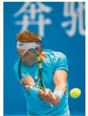
Nadal, en el partit d'ahir a Pequín

punts. En tots sis exercicis va superar aquest registre, un llistó que cap altre gimnasta no va poder aconseguir. La seva nota final va ser de 91,990 punts, amb gairebé dos de diferència respecte del segon classificat.