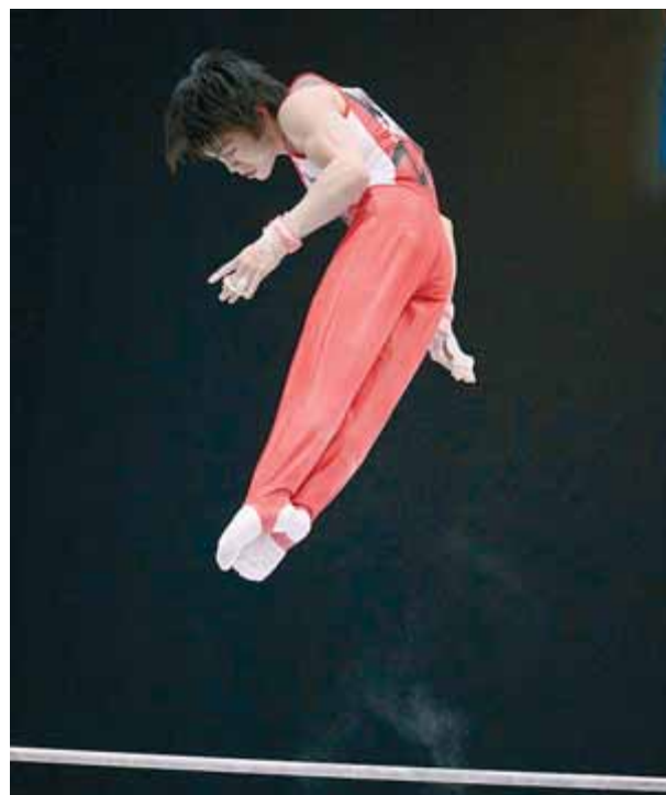
Kohei Uchimura, volant en l'exercici de barra