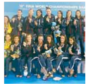
COPA CATALUNYA WATERPOLO

El pilot francès és el nou campió del món de ral·lis. S'accedeix en el palmarès el seu compatriota Sébastien Loeb, nou cops campió mundial.