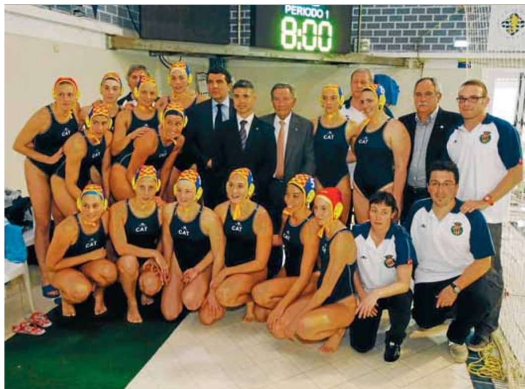
La selecció catalana, que el mes d'abril va jugar un partit amistós contra la Gran Bretanya

èxit sense precedents amb un merescut homenatge que es portarà a terme demà a Mataró. Després de la final femenina de la copa de Catalunya —es juga a 2/4 de 12— es farà una gran foto de família amb totes les jugadores, els tècnics i els clubs catalans als quals pertanyen. A l'hora de parlar de clubs, no es pot obviar l'equip femení del CN Sabadell, la base de la selecció estatal absoluta i que la temporada passada va conquerir la segona copa d'Europa. El conjunt sabadellenc també tindrà el seu reconeixement en l'acte de demà al migdia a la capital del Maresme.