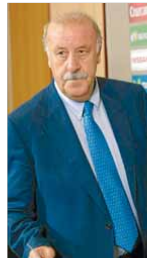
Del Bosque, abans d'anunciar la llista de convocats

si Messi i Mascherano han de viatjar a l'Argentina per ser avaluats pels metges de l' albiceleste , un extrem al qual Tata Martino no creu que s'arribi. "Cap dels dos té l'alta mèdica. La decisió depèn dels metges de l'Argentina i de la direcció de l'AFA, però no dono per fet que viatgin." ■