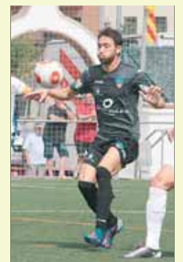
Molo (Lleida), en una imatge d'arxiu ■ J.S.