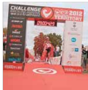
DIA CATALÀ TRIATLÓ

El Garmin Barcelona i el Challenge Barcelona-Maresme faran demà del triatló un dels espectacles esportius a seguir a la costa catalana.