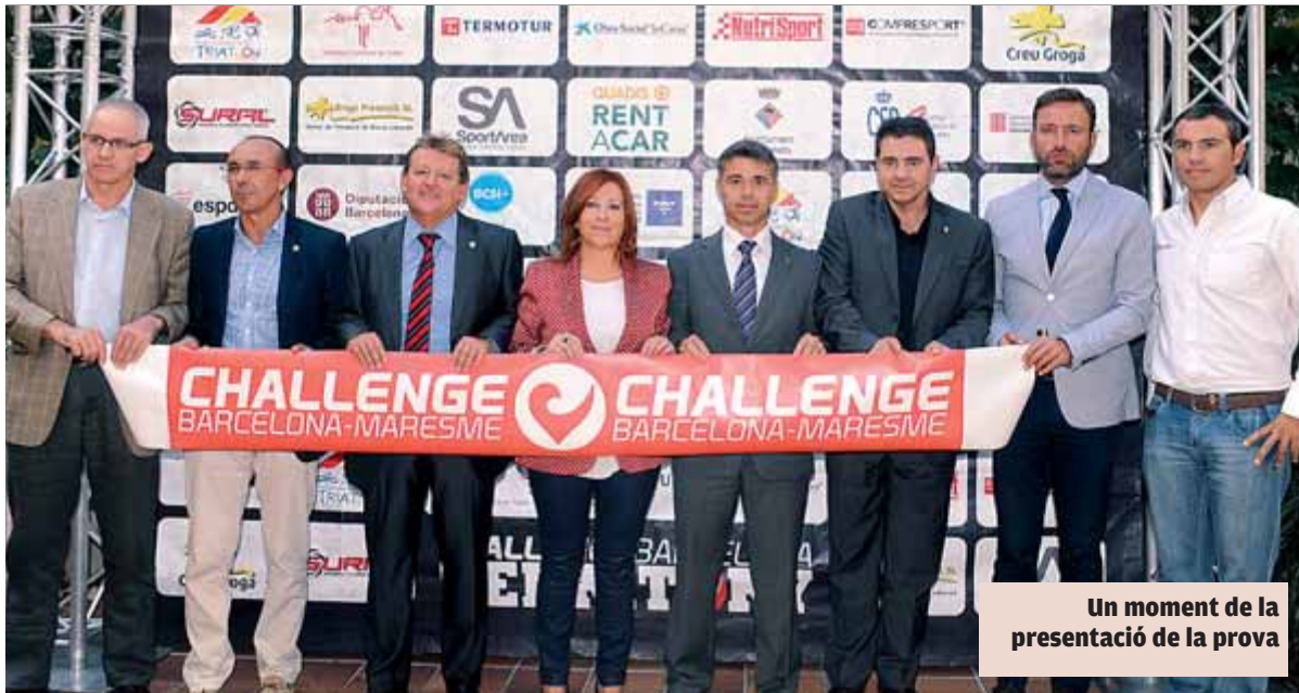
Un moment de la presentació de la prova