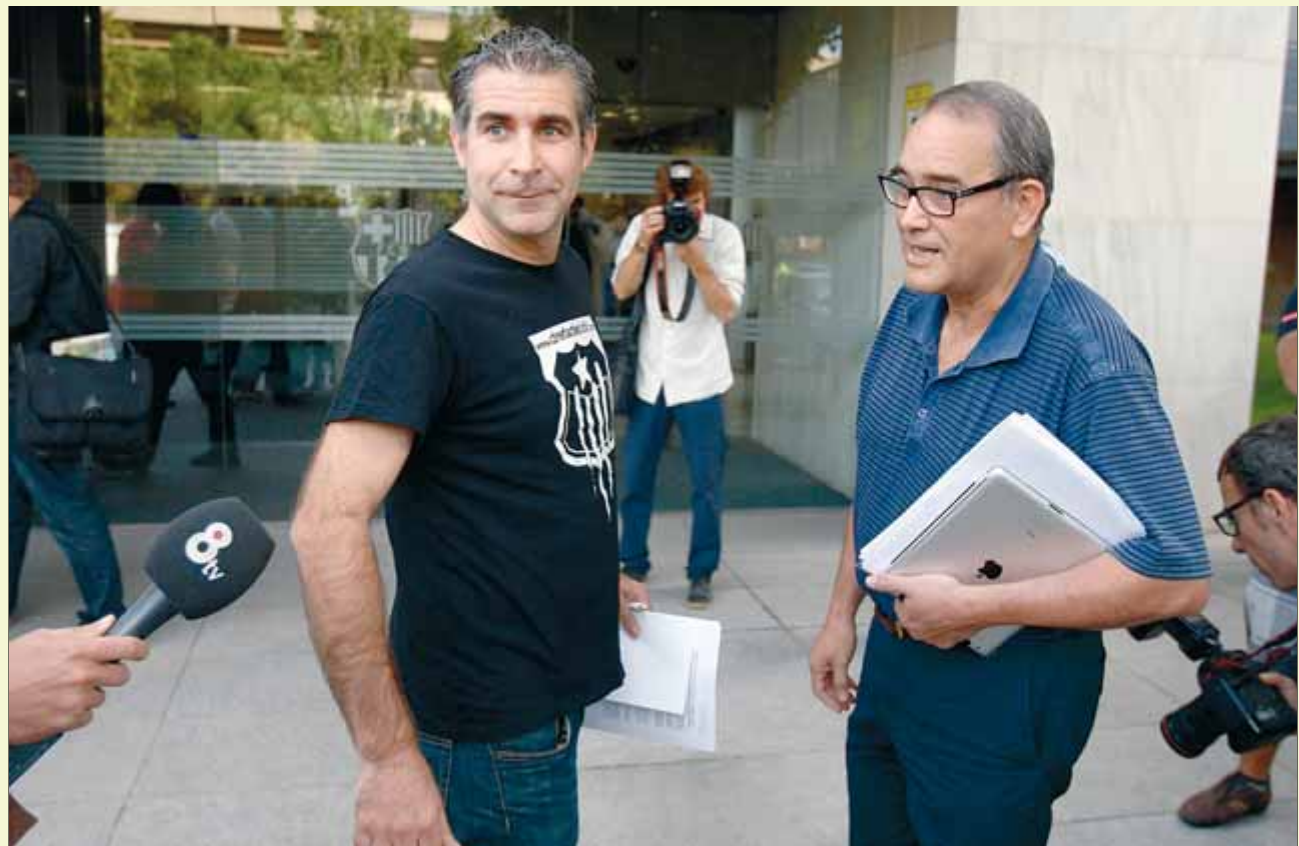
Els dos membres de Go Barça que van anar a recollir les paperetes per a la moció de censura

6 Algú del Barça podria explicar què té Leo Messi, que des del partit del PSG de la Champions de fa sis mesos ha anat tenint cada dos per