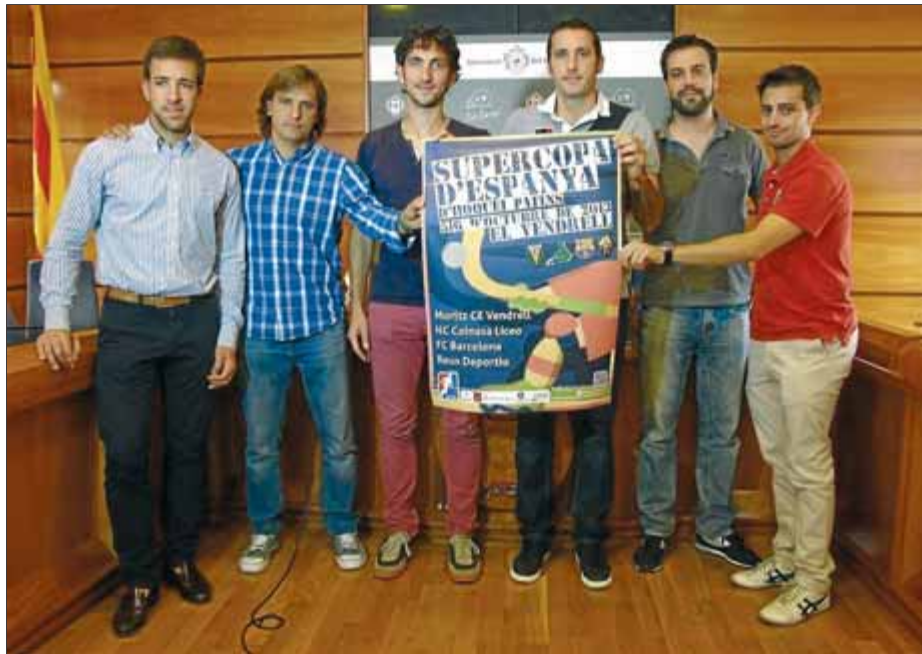
La presentació de la supercopa que es va fer fa uns dies al Vendrell ■ CE VENDRELL

Tot i que els quatre equips acaben de sortir de la pretemporada, fa poc que han recuperat els jugadors que han guanyat el mundial, tenen algunes baixes i ni de bon tros estan en un bon moment, l'espectacle està assegurat. El prestigi dels equips