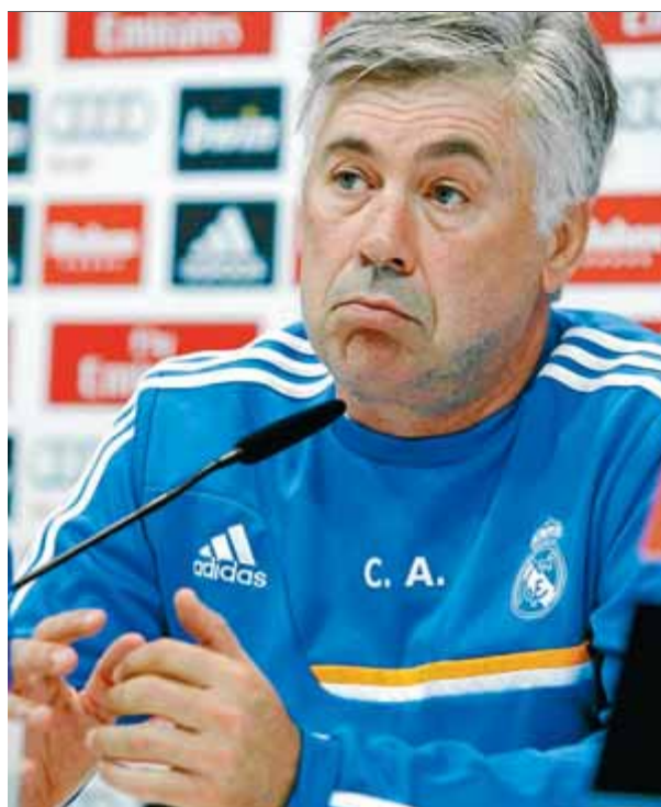
Carlo Ancelotti ahir en roda de premsa

CAMP: Ciutat de València / HORA: 20.00 h (C+L/GolT) / ÀRBITRE: González González