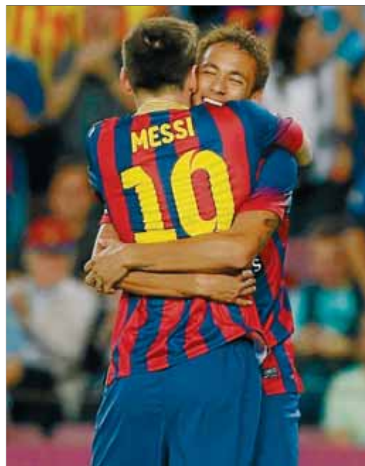
Messi i Neymar tenen una bona relació

S'han disputat 11 partits oficials i no queda rastre de l'un ni de l'altre. Perquè 11 partits oficials proporcionen prou material per parlar amb coneixement de causa i una base fàctica, i no a partir de senyals de fum. Per comprovar, per exemple, que Martino té els pebrots de substituir Messi, mesura inèdita i temuda, i d'exhibir una joiosa indiferència quan li diuen que potser el 10 s'ha encabronat. Martino, enfront del drama i els escarafalls tan signes dels temps i tan recurrents a Barçalàndia, imposa context, serenor analítica i expositiva i sang freda, condició indispensable per compensar la tendència a l'excés i la flamarda de determinat (i presumpte) periodisme esportiu i del maleït entorn, i alhora una característica que també l'agermana amb els seus tres predecessors més immediats en el càrrec, refor-