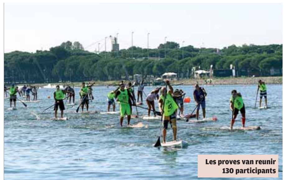
Les proves van reunir 130 participants