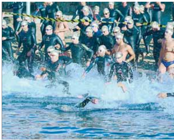
Sortida de la Radikal Marbrava de fa dos anys ■ EL 9

El SHUM, a Tordera. L'equip maçanetenc serà el convidat avui en el partit de presentació del Tordera. L'acte de presentació serà a partir de dos quarts de set de la tarda. A partir de les vuit del vespre es jugarà el partit. ■ E. LÓPEZ