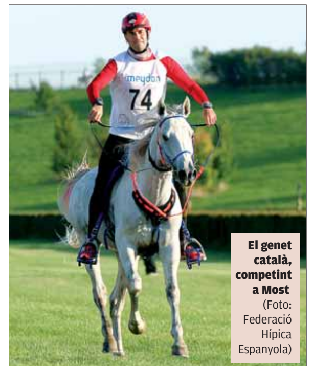
El genet català, competint a Most

possible i complint les condicions veterinàries fixades a l'inici de la prova. Es premia la bona preparació física de l'animal, que no pot superar un nombre mínim de pulsacions per minut establertes amb anterioritat, ni acabar deshidratat o coix. Es pot treure la victòria a un genet si el seu cavall acaba la cursa en mal estat.