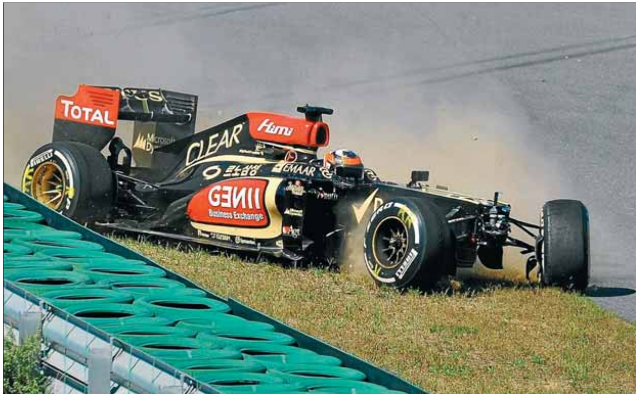
Räikkönen estimba el Lotus contra la barrera de pneumàtics al final de la primera sessió, ahir

Webber ha de remuntar En velocitat pura, doncs, el W04 es va mostrar a l'altura de l'RB9, i en les tirades llargues de simulació de carrera el Lotus E21 es va afegir a la festa. De fet, la tanda de Kimi Räikkönen amb el compost supertou va ser la millor en absolut. Això sí, Red Bull no va ensenyar totes les cartes, perquè va provar diversos reglatges aerodi-