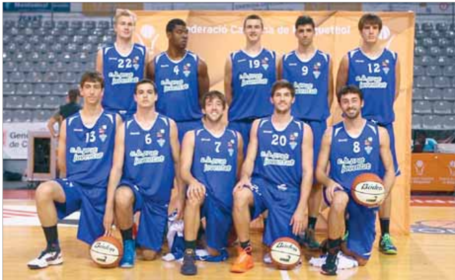
Diamants per polir els que hi ha al Prat Joventut, una vegada més l'equip més jove