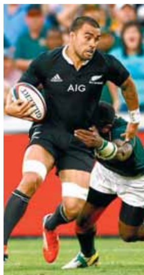
Mtawarira, ahir

Austràlia i l'Argentina van quedar tercer i quart d'aquest verdader campionat del món de l'hemisferi sud. ■