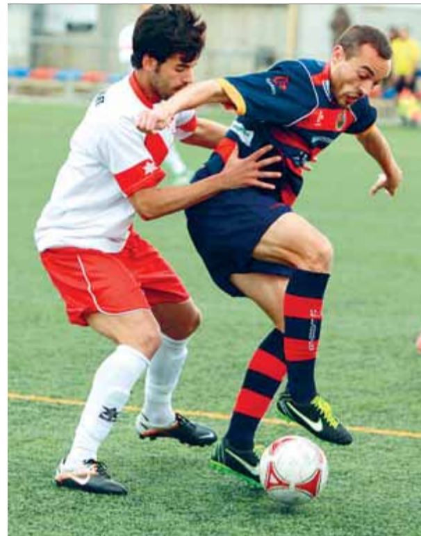
Una acció de l'última visita de l'Hospitalet a Llagostera

últims dos partits de lliga. Qui no té gens clara la seva entrada a la convocatòria és Lobato després de la lesió que el va obligar a retirar-se en la primera part del duel contra el Sant Andreu. Les rotacions fetes en la copa federació han de permetre que l'equip no noti el cansament de jugar dos partits en set dies. ■