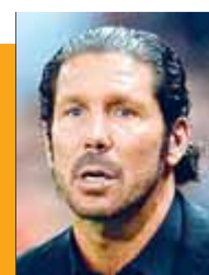
NOVAK DJOKOVIC. Tennista

“Demà són tres punts, com al Bernabéu. El més difícil en el futbol és mantenir la humilitat”