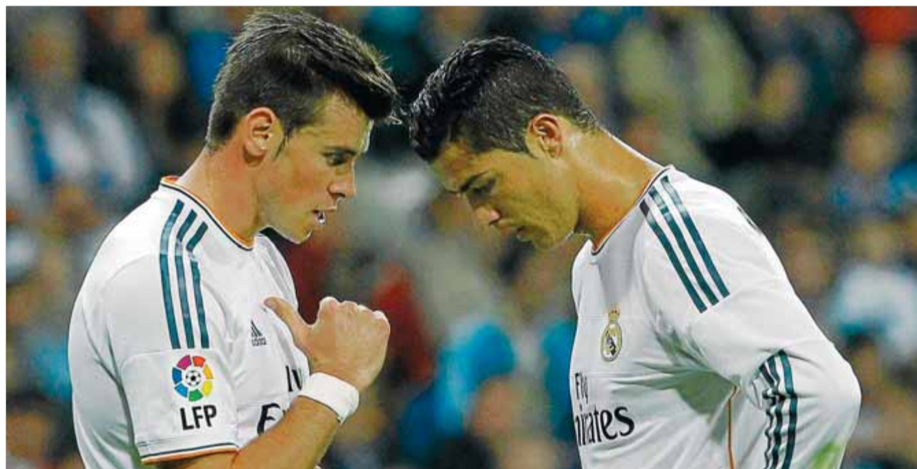
Bale i Cristiano Ronaldo en el partit contra l'Atlético de Madrid

El cas és que, a propòsit del Madrid i el Barça, parlem de futbol amb el simpàtic dependent i ens entenem prou bé, a banda del fet que cadascú defensa el seu equip. Ens entenem prou bé perquè ens agrada el futbol ben jugat i lamentem les pràctiques agressives i les actituds prepotents d'alguns jugadors que, perquè saben remenar una pilota, es creuen els amos del món. També podem criticar els entrenadors per coses semblants. Aquest madridista, per exemple, no suporta Mourinho i, fins fa relativament poc, considerant que fa un temps que Cristiano Ronaldo es dedica finalment a jugar meravellosament al futbol, lamentava les poca-soltades, els laments egocèntrics i fins i tot la mala bava del futbolista portuguès. Així, doncs, no defensem el nostre equip de la manera fanàtica que fa més possible un intercanvi de crits que una conversa. A vegades reconeixem que el nostre equip ha jugat malament, que ha guanyat sense merèixer-ho i fins i tot que els àrbitres sempre tendeixen a ajudar el Barça i el Madrid. En això últim discrepem una mica, perquè ell no accepta que al Madrid (és recent el penal contra l'Elx amb