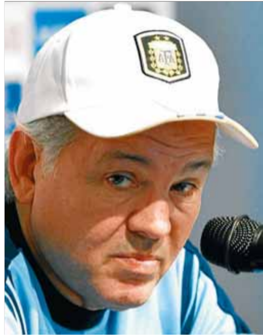
Alejandro Sabella

Què voleu que us digui? Jo entenc perfectament el plantejament del seleccionador argentí. D'entrada, no em sembla una tortura gaire sàdica fer volar Messi i Mascherano en primeríssima classe amb hostesses sempre atentes que la copa de xampany no es buidi. De fet, les hores de vol seran hores de descans, ideals per a la recuperació de les lesions. De fet, tots hem vist a la tele que Messi s'ho passa d'allò més bé als vols, ju-