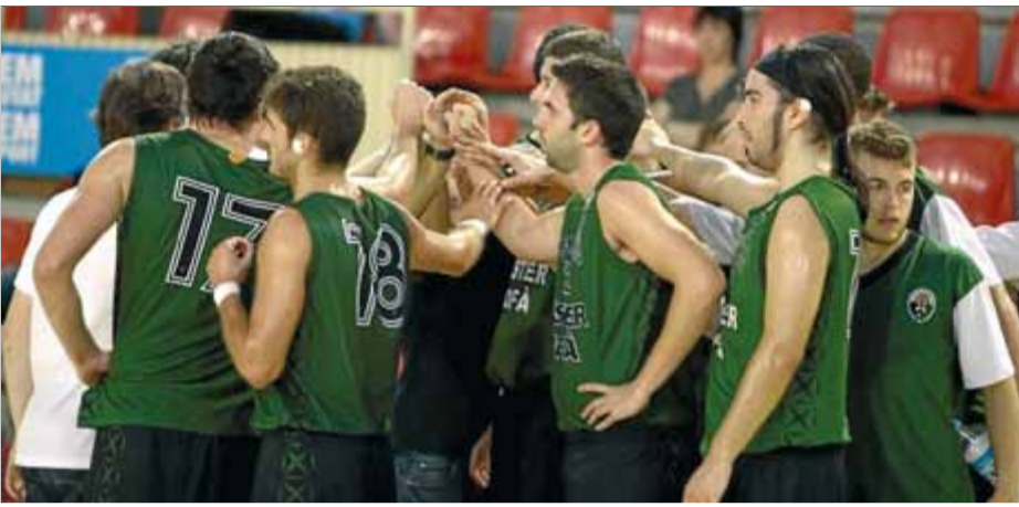
L'equip, ahir, al pavelló de Palau ■ JOAN SABATER

Copa Catalunya. Per primera vegada el Sant Narcís competeix els 40 minuts i troba la seva recompensa