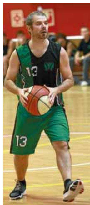
Feixas ■ J. SABATER

Els gironins van sortir connectats i van deixar en només 11 punts el Masnou en els primers 10 minuts. En el segon quart, però, la fortalesa física del rival sota les anelles va donar-li l'absolut control del rebot —es va notar molt la baixa de Geli—, tant el defensiu com l'ofensiu, generant molts punts en contra a camp obert i en segones opcions. Tot i el 37-21, el descans va aclarir les idees del Salt, sobretot en defensa, però, malgrat que es va recuperar i va posar nerviosos els locals, no va haver-hi manera de remuntar, en notar molt el desencert en els tirs lliures. ■