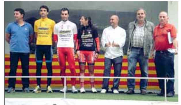
Els líders de la general, muntanya i regularitat i les autoritats i organitzadors de la prova ■ EL 9

geix a les de la Titan Desert al maig, al Marroc, o la Rincón de la Vieja Challenge de BTT aquest agost, a Costa Rica. ■