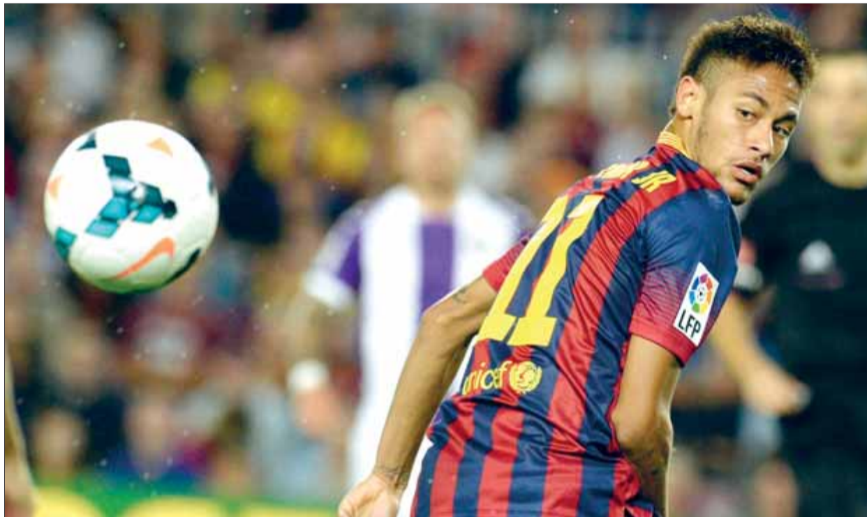
Neymar mira fixament la pilota en una acció del partit d'ahir

Els bons minuts de Neymar com a fals davanter centre contra el Celtic en la Champions van ser suficients perquè Gerardo Martino decidís que fos el brasiler qui ocupés aquesta posició en el partit contra el Valladolid, malgrat que en la prèvia havia assegurat que tant Alexis com Cesc també eren candidats a jugar en l'habitual lloc de Messi. No es va equivocar. Neymar no va defraudar. La seva adaptació al joc del Barça va a un ritme trepidant. Independentment que jugui enganyat a la banda esquerra o al centre de l'atac, sempre destaca. "Em consta que és feliç", havia dit Sandro Rosell en l'assemblea de compromissaris. Veient-lo jugar fa aquesta sensació. Ocupant una posició més centrada, Neymar va disposar de més espai per desequilibrar i es va associar molt més amb els migcampistes i els companys de davantera. Tenia absoluta llibertat per moure's. Se'l va