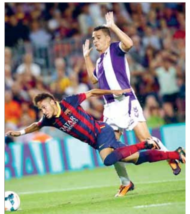
Neymar va ser objecte de dos penals que l'àrbitre no va xiular i que podrien haver ampliat en resultat ■ REUTERS

De fet, no és la primera vegada que l'àrbitre càntabre ha de suportar protestes al coliseu barcelonista: el 25 de gener del 2012, després d'un Barça-Real Madrid de copa que va acabar amb l'eliminació dels blancs i la classificació dels blaugrana per als quarts de final d'aquella competició, Jose Mourinho el va esperar al pàrquing de l'estadi per demanar-li explicacions. És clar que aquell episodi, però, no va ser ben bé el mateix que el que va passar ahir. ■