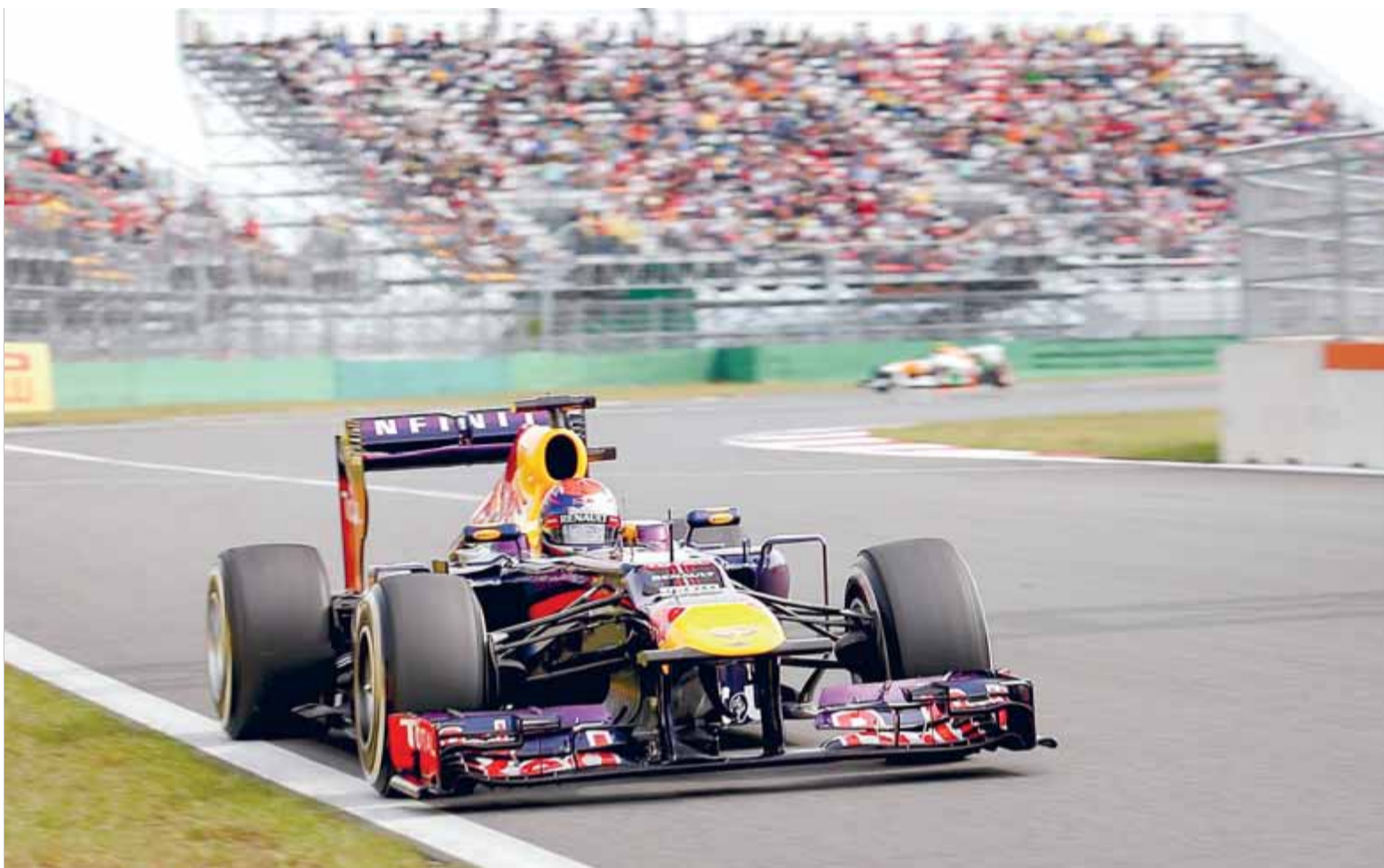
El Red Bull de Vettel va tornar a ser el més ràpid a Corea, ahir

Fórmula 1. El líder del mundial aconsegueix la posició preferent en el Gran Premi de Corea. Hamilton, segon en la graella, creu que no el podrà aturar si el Red Bull s'escapa en la sortida