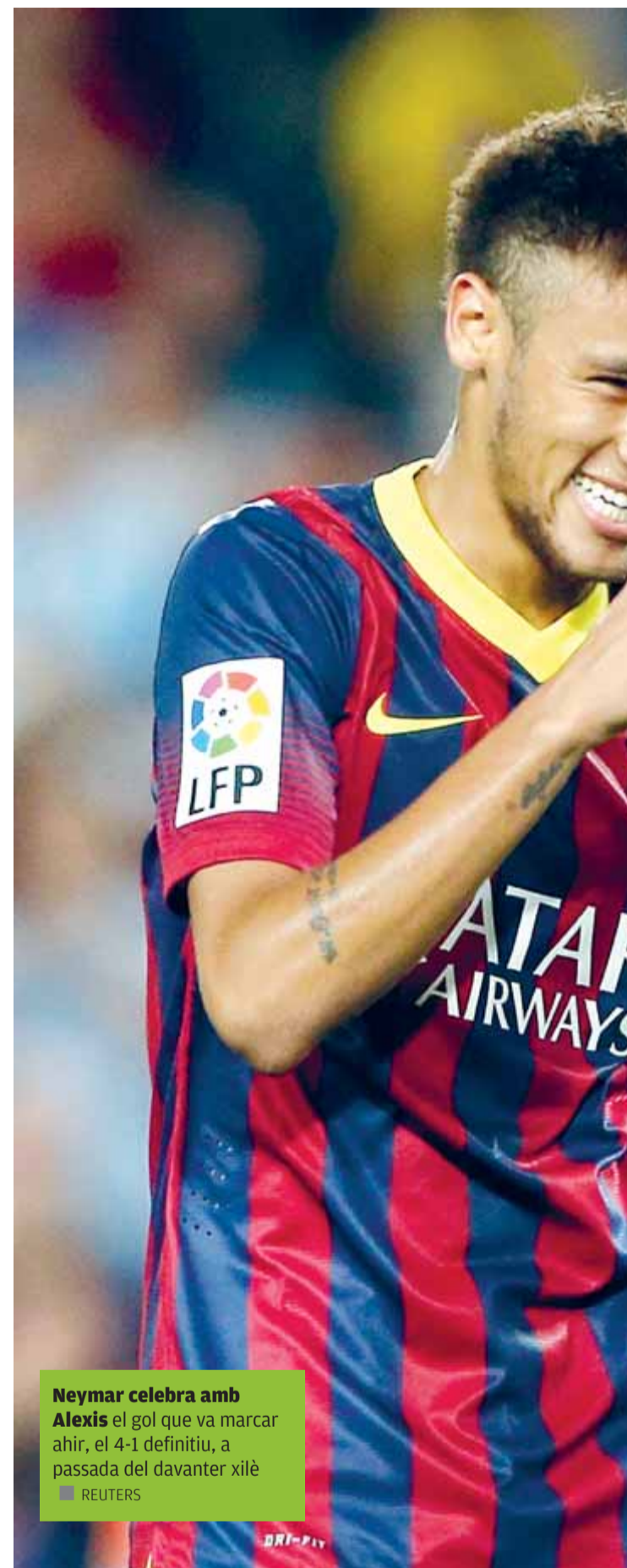
Neymar celebra amb Alexis el gol que va marcar ahir, el 4-1 definitiu, a passada del davanter xilè

No va jugar bé el Barça, però, els minuts després del gol de l'empat. L'objectiu de Martino és que l'equip jugui millor cada partit, però per uns minuts va tornar a trencar-se en dues parts, com havia