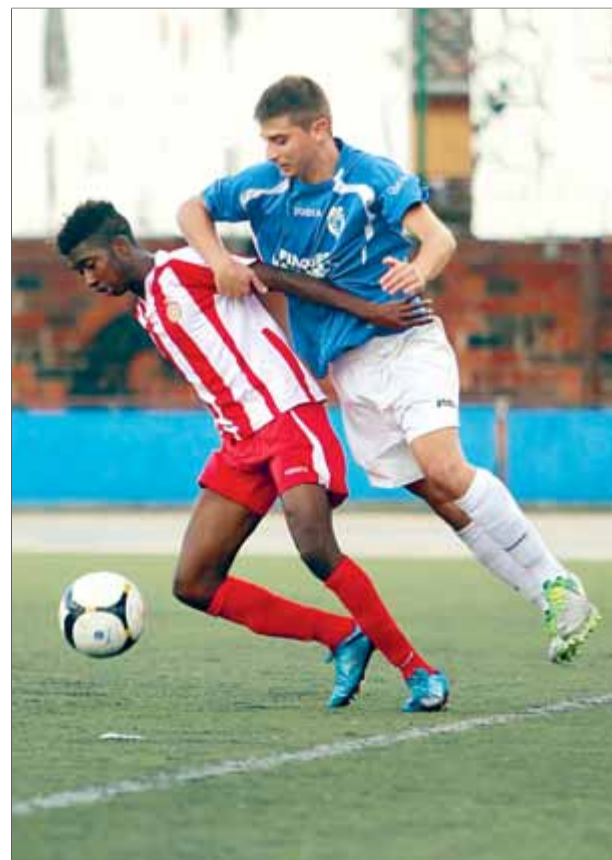
Una acció del partit jugat ahir a Santa Coloma