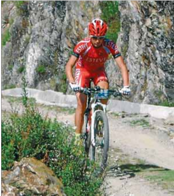
Pinto en una de les etapes de l'MTB Himalaya ■ EL 9

"Ha estat un gran repte i una experiència inoblidable. Una victòria que voldria compartir amb tots vostès. I vull felicitar tots els atletes que han completat aquests sis dies de mountain bike pur i dur" va dir en la cerimònia d'entrega de trofeus, el millor