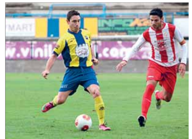
Malo (Palamós), contra el Vilassar

Mentrestant el Figueres, que el diumenge passat va jugar el partit més boig de la jornada contra el Gavà (3-3) —tres gols en els sis primers minuts, i dos més en els últims dos—, espera retrobar-se amb la victòria visitant al camp del Castelldefels (a les dotze del migdia), que encara no ha guanyat ni un partit i ocupa zona de descens. Però tot i el pobre inici de curs del rival, el tècnic del Fi-