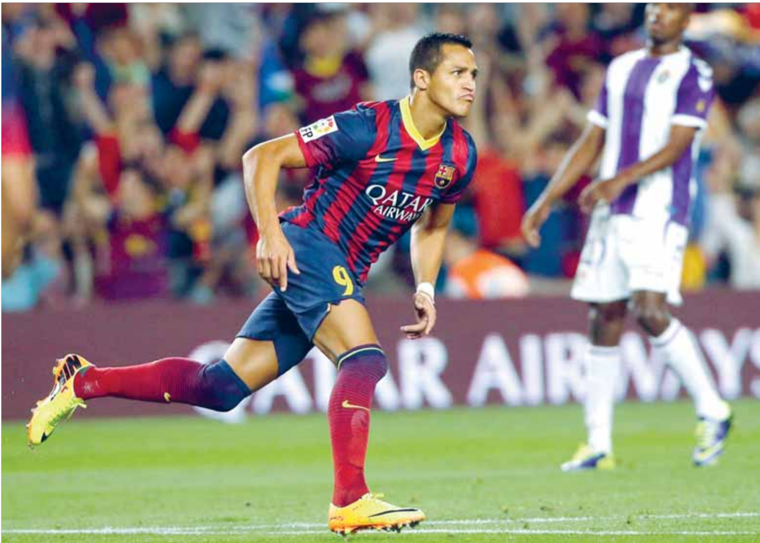
L'extrem de Tocopilla corre amb determinació i complaença durant la celebració d'un dels dos gols que va marcar dissabte

Reivindicat. Amb dos gols i una assistència contra el Valladolid, el xilè consolida la línia ascendent mostrada aquest inici de temporada i respon a la confiança del cos tècnic