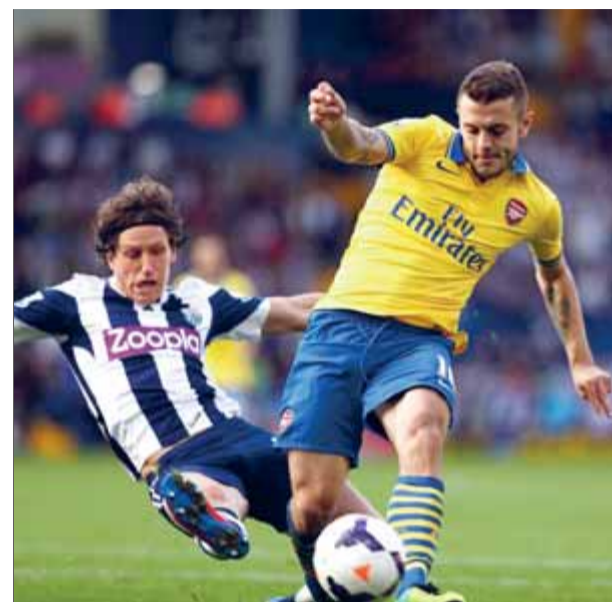
Wilshere va aconseguir l'empat per al conjunt londinenc en la segona part.

Premier League. Els de Wenger mantenen el lideratge tot i l'empat (1-1) al camp del WBA. L'equip de Villas-Boas cau amb estrèpit (0-3)