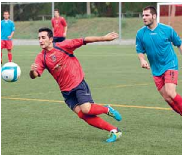
Yuyu persegueix una pilota llarga durant el partit ■ JOAN S.