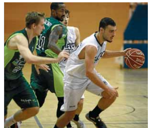
Ventura de menys a més a la pretemporada ■ CHARLY MULA

de Caner-Medley van rematar la feina per als andalusos. ■