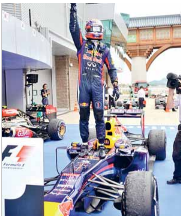
Vettel celebrant el triomf dalt del seu Red Bull, ahir

Grosjean, perillós El cap de files de Red Bull, però, no s'hi capfica. “Miro de no pensar-hi i concentrar-me en el present”, va revelar ahir. “Encara hi ha