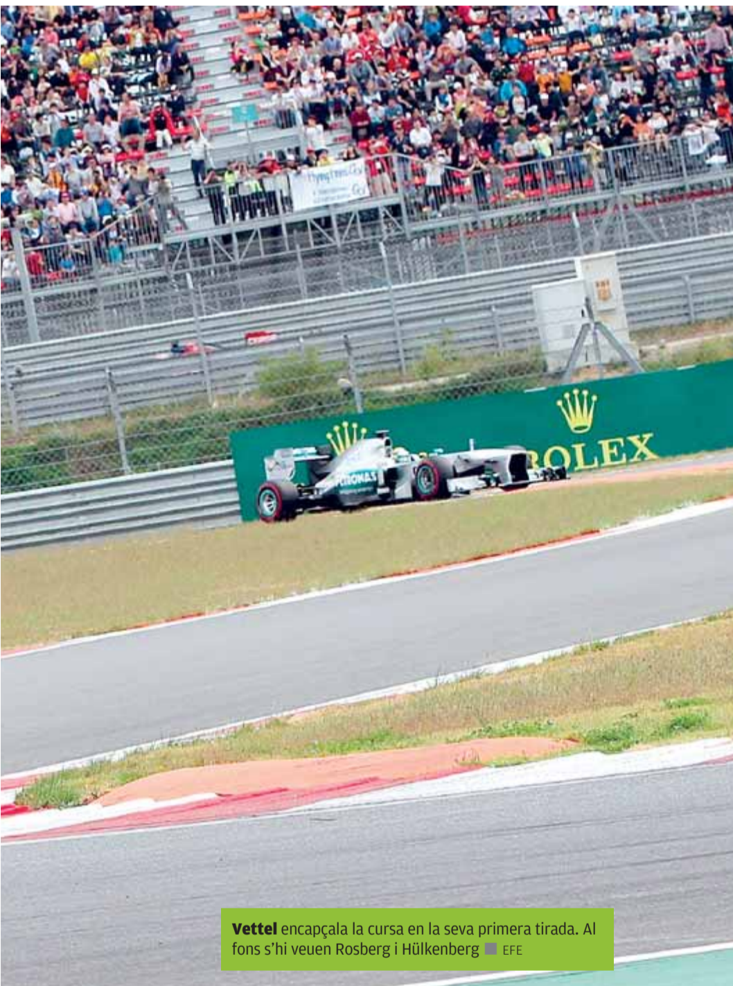
Vettel encapçala la cursa en la seva primera tirada. Al fons s'hi veuen Rosberg i Hülkenberg

manys van quedar a mercè del modest Sauber suís.