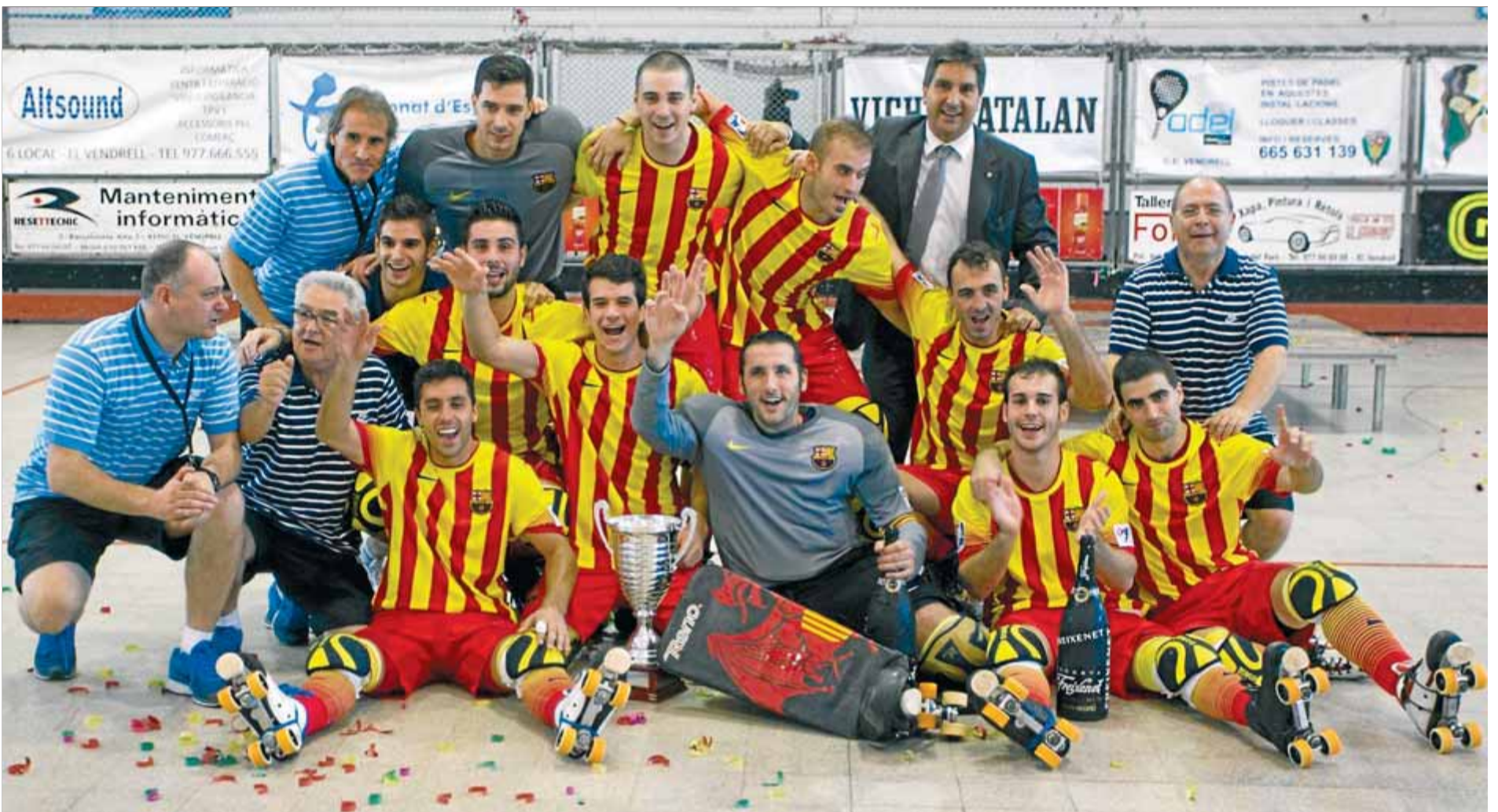
Els jugadors del FC Barcelona celebren el títol després d'una gran final ■ JOSÉ CARLOS LEÓN

Supercopa d'Espanya. El Reus Deportiu va saber anivellar tres cops els avantatges dels blaugrana i va enviar el partit a la pròrroga en marcar a dos minuts per acabar la final