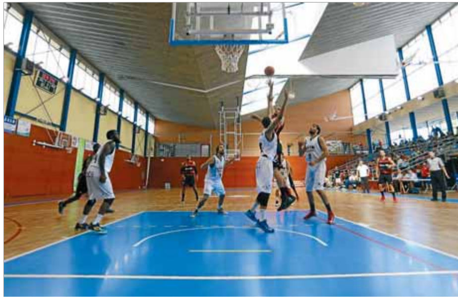
Una imatge del partit, amb el nou parquet en primer terme

La sortida de la pressió El Múrcia s'hi va posar bé perquè la Bruixa d'Or fes