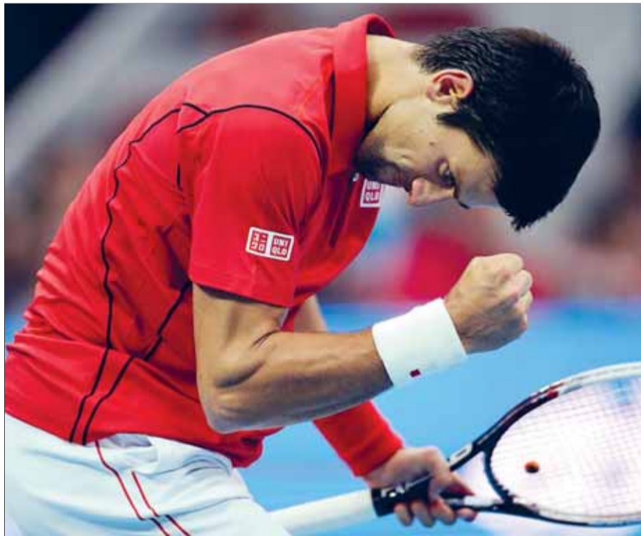
Djokovic fa un gest de victòria després de guanyar Nadal en la final

El serbi va demostrar que té la mida presa al torneig xinès, on amb la d'ahir ja ha obtingut vint victòries consecutives. El seu joc va ser molt més sòlid que el d'un Nadal imprecís en els cops de dreta, que no es va moure sobre la pista amb la rapidesa amb què acostuma a bellugar-se. El mallorquí ni tan