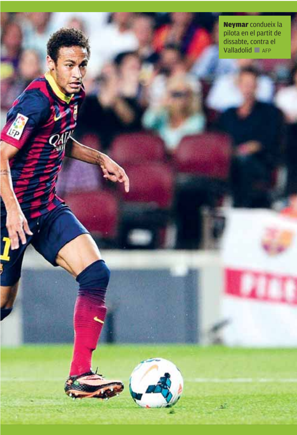
Neymar condueix la pilota en el partit de dissabte, contra el Valladolid