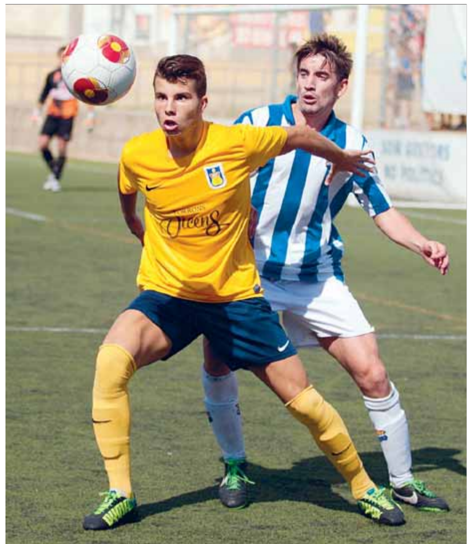
Busquets pressiona un rival durant el partit d'ahir a Els Canyars

En la segona meitat, el Figueres va fer un bon treball defensiu davant la insistència local. Gilberto i Oriol van portar de coreoll el conjunt empordanès, però la tranquil·litat de Murga, Argi i la resta de companys va ser clar per aguantar el 0-1 i tornar cap a terres empordaneses amb els tres punts al sac. Tot i el cansament acumulat, la Unió es va convertir en el mereixedor de la victòria, una altra vegada, fora de casa. ■