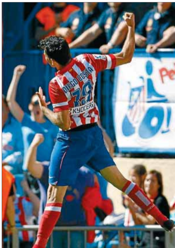
Diego Costa celebra el segon gol.

La victòria va tornar a portar la rúbrica de Diego Costa, l'home que radiografia a la perfecció aquest Atlético: amb planta de davanter tronc, fet per a la