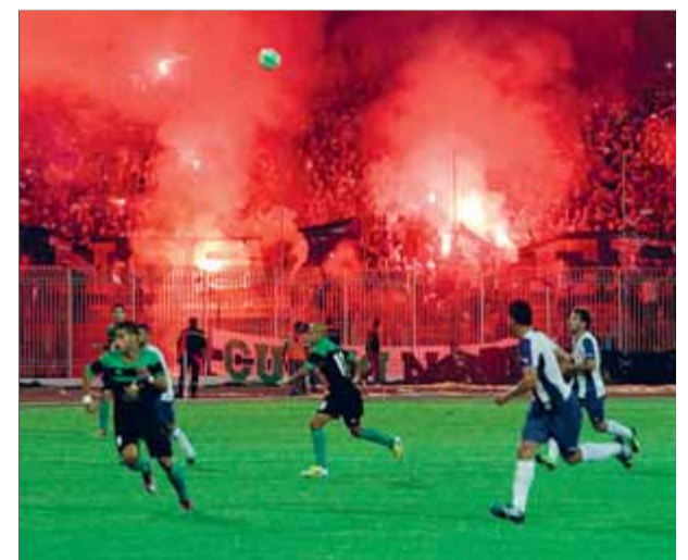
L'Espanyol va ser a Constantina al juliol en un partit amistós de pretemporada ■ FERRAN CASALS

La directiva de l'Espanyol espera que ara les autoritats estatals donin el vistiplau per complir amb el compromís adquirit amb l'Al-Ittihad i que serveix per expandir la imatge del club. ■