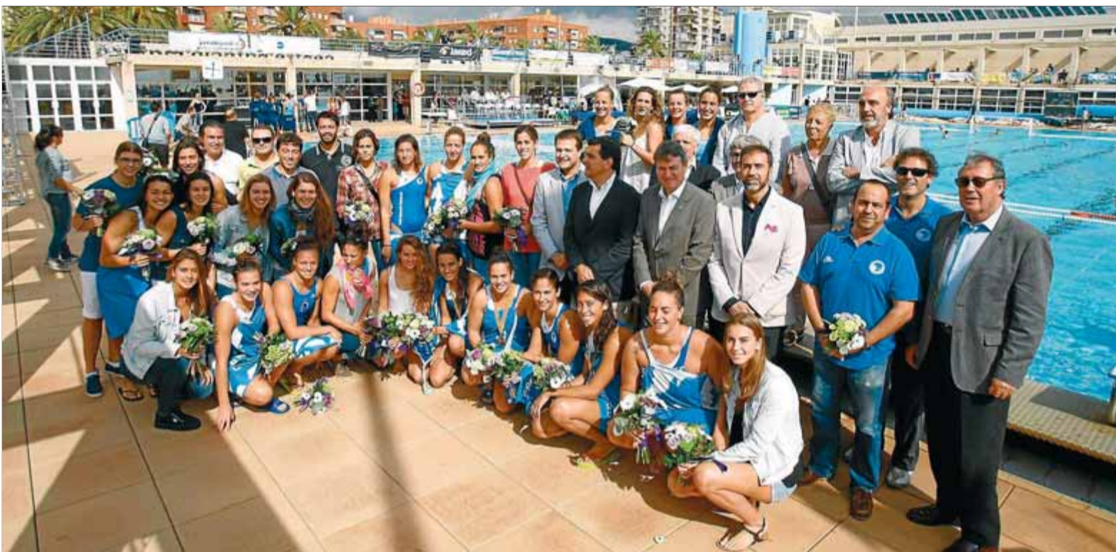
43 medalles internacionals catalanes. A més del títol europeu del CN Sabadell, trenta jugadores van assolir amb les seleccions espanyoles el mundial absolut a Barcelona, el subcampionat mundial júnior a Vólos i el subcampionat europeu juvenil a Istanbul. Ahir van ser homenatjades a Mataró ■ ORIOL DURAN

Waterpolo. El CN Sabadell i l'Atlètic Barceloneta revaliden els títols de la copa de Catalunya entremig d'un acte de reconeixement als èxits internacionals de tot el waterpolo femení