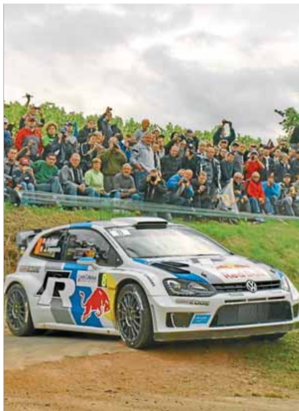
Ogier retalla un revolt en l'última etapa, ahir

Ogier, demolidor "Ho sento per Loeb. Anava a totes per guanyar", va dir un magnànim Ogier. Loeb no s'hi jugava res, és clar, però l'abandó li va impedir córrer el tram urbà d'Haguenau, la seva ciutat natal. "Havia sortir decidit a tibar de valent per mirar de guanyar", va asseverar Loeb, campió fins al final. Amb el títol ja decidit i la llum verda dels caps de