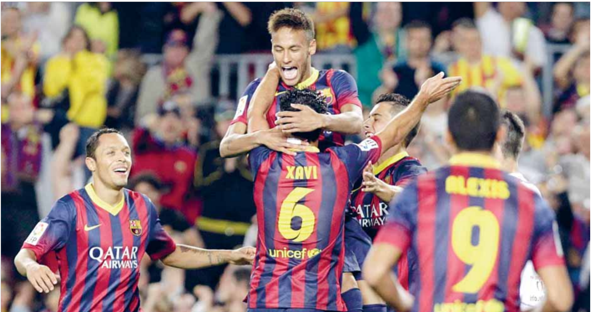
Adriano, Xavi, Neymar, Tello i Alexis, en plena celebració del gol del migcampista terrassenc, dissabte contra el Valladolid

Dinou victòries. Des del 2-2 en el clàssic de la temporada passada a l'estadi, del qual avui fa un any, el Barça ha guanyat tots els partits que ha disputat com a local en la màxima competició estatal