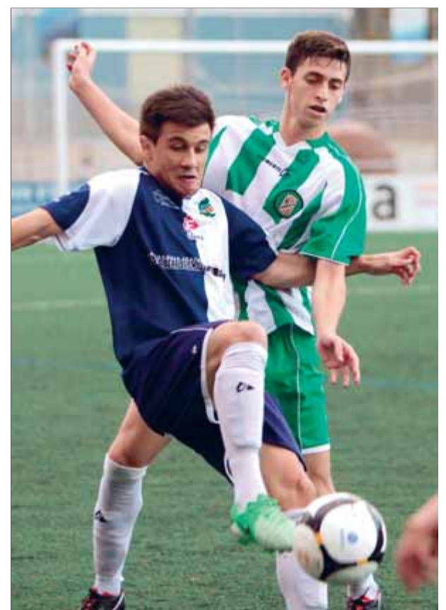
Una acció del partit d'ahir a Banyoles ■ JOAN SABATER

A partir d'aquest moment, el duel es va embrutar amb entrades a destemps i poc futbol de toc. De resultes d'una d'aquestes faltes, Laari també va ser expulsat i, en l'últim quart, el Banyoles va jugar contra nou jugadors. Malgrat aquest avantatge numèric, el marcador ja no es va moure. ■