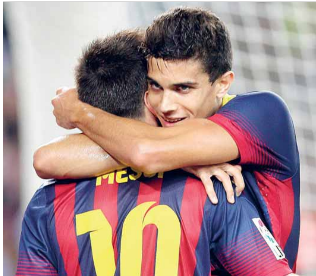
Bartra abraça Messi en celebrar el seu recent gol contra la Real Sociedad

En aquest trajecte, Bartra ha mostrat una maduresa destacable. D'una banda se li ha demanat paciència per anar entrant a poc a poc en l'equip, però a l'hora de la veritat li ha tocat aparèixer en moments delicats i sense marge d'error, com ara en l'eliminàtoria de semifinals de la passada Champions contra el Bayern de Munic. Un mal record que l'ha acompanyat fins aconse-