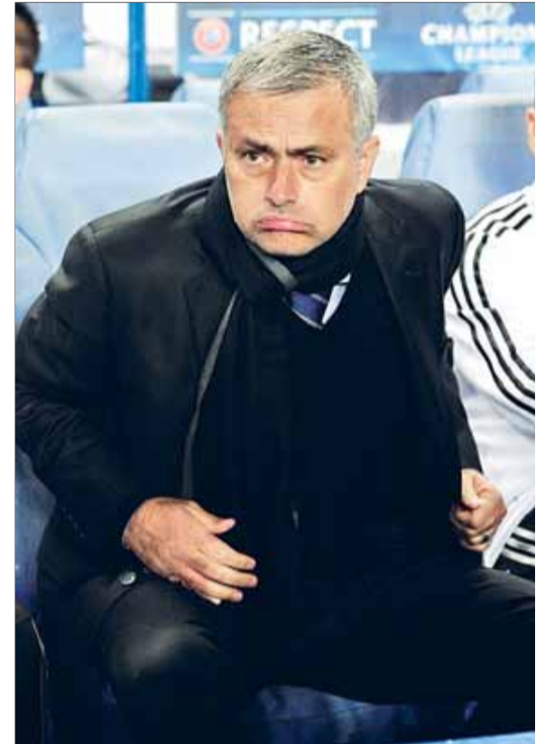
Mourinho dispara amb bala un altre cop

Ahir José Mourinho va tornar a posar el Barça en el seu punt de mira quan va qualificar, en declaracions a la premsa d'Anglaterra, Neymar i Mario Balotelli de la piscineros i els va condemnar per mirar d'enganyar els àrbitres amb les seves accions. "Es va veure clarament que en la Champions League existeix una cultura de la piscinada . Es va veure amb els incidents de Neymar a Glasgow i amb Balotelli a Amsterdam. Un equip es va quedar amb deu jugadors per l'expulsió de Brown i l'altre va ser castigat amb un penal en contra en l'últim minut. Aquestes accions m'entristeixen i em preocupen, perquè jo també competeixo en la Champions", va etzibar.