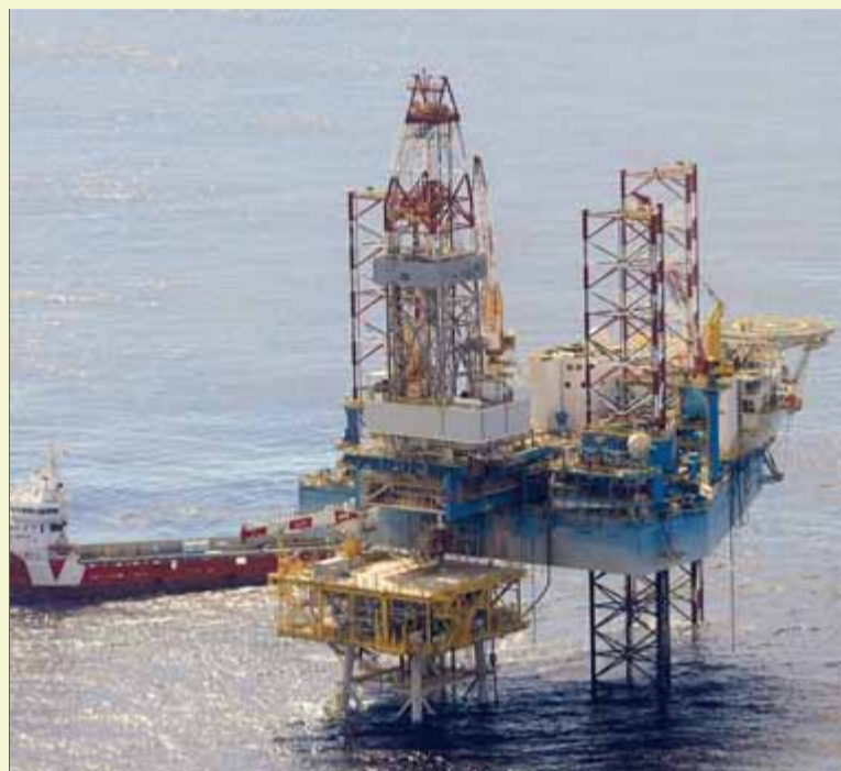
La plataforma marítima del projecte Castor

Doncs bé, pot semblar inversemblant però es pot afirmar que ara el futur del Real Madrid depèn més que mai d'un recòndit lloc entre el Principat de Catalunya i el País Valencià. M'explico: tot i les poderoses influències de Florentino Pérez, l'alarma social generada pels nombrosos i creixents terratrèmols detectats a la zona del Sénia, a pocs quilòmetres de la concentració més gran de centrals nuclears i indústria química de l'Estat espanyol i del sud d'Europa, ha obligat el govern espanyol a decretar la paralització immediata