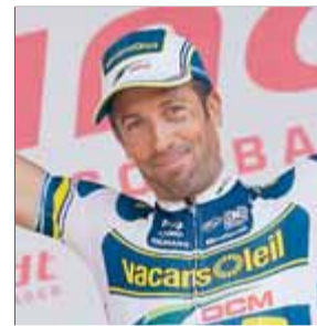
JOAN A. FECHA CICLISME

El duel entre els dos equips catalans de la lliga Asobal, líders imbatuts després de cinc jornades, és un matx que cap aficionat es pot perdre.