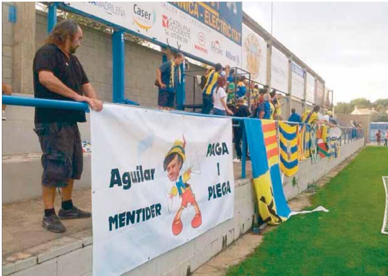
La pancarta que va exhibir la Penya Sport durant el matx de diumenge contra la Muntanyesa ■ EL 9

El Palamós no va voler donar gaires més detalls i va preferir convocar una roda de premsa per a aquest vespre. A més de la continuïtat, la intenció és mirar de transmetre una mica de tranquil·litat, tot i que no és fàcil. "Continuem