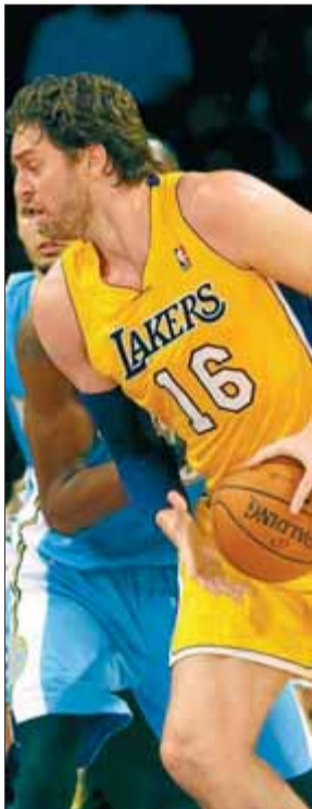
Gasol torna a l'acció

Des del 29 d'abril, quan es va fer una lesió que el va obligar a passar pel quiròfan, Pau Gasol no havia tornat a jugar. Cinc mesos després el pivot de Sant Boi es va tornar a vestir de curt per disputar el segon amistós de pretemporada dels Lakers després d'haver superat els Warriors 24 hores abans. La matinalada passada, però, els californians, que també van recuperar Steve Nash, van cedir 88-97 contra els Nuggets de Denver davant els aficionats de l'Staples Center que van ovacionar Gasol. Encara sense Kobe Bryant, que es recupera de la greu lesió que va tenir i que li impedirà començar el curs, el català va exercir de líder i la majoria de pilotes passaven per les seves mans. Després de molt de temps adaptant-se a jugar al costat de Dwight Howard i Andrew Bynum, per fi es va poder tornar a veure jugar Pau de 5. Els percentatges d'encert no van ser bons (4/13 tirs de camp) però les sensacions van ser positives i va acabar amb 13 punts, capturant 4 rebots i 2 assistències. Demà els Lakers tornaran a jugar contra els Nuggets, aquesta vegada a Ontario (Califòrnia). Els Lakers van trobar durant