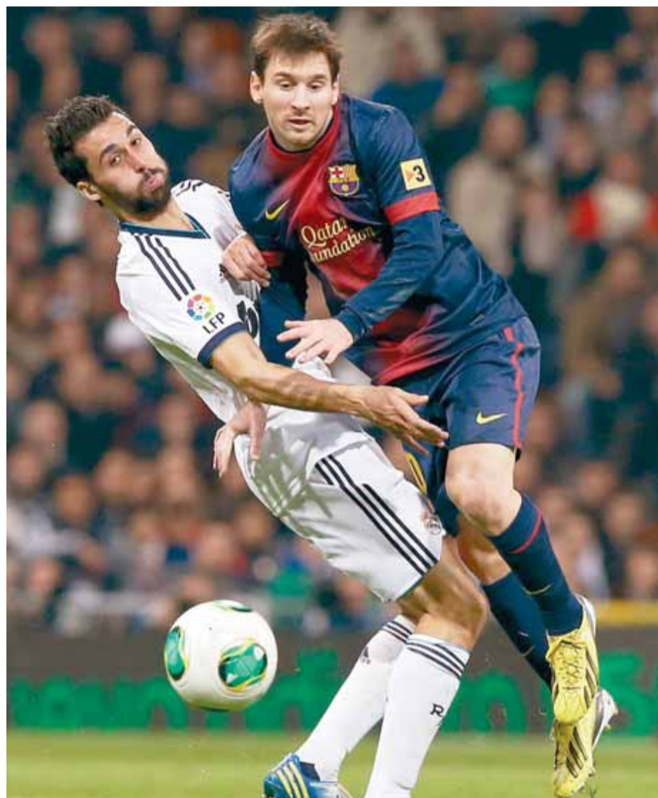
Leo Messi intenta superar Álvaro Arbeloa en el clàssic de l'any passat al Camp Nou

L'últim clàssic de la temporada 2012/13, jugat al Santiago Bernabéu el mes de març, es va jugar en un horari encara menys habitual, les quatre de la tarda. ■