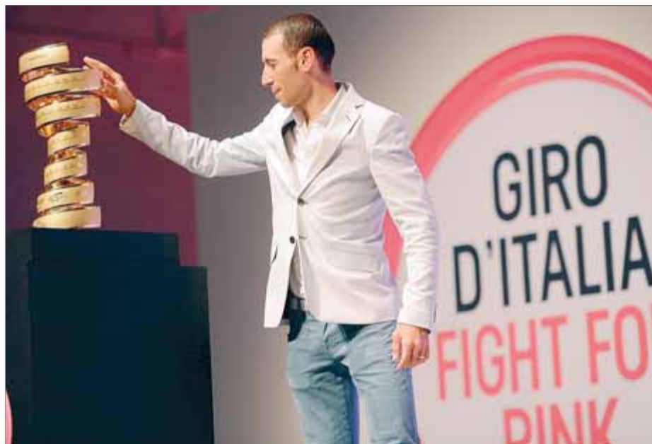
Nibali, amb el trofeu de vencedor de l'últim Giro en la presentació d'ahir

La prova començarà el divendres 9 de maig a Belfast amb la contrarellotge per equips i acabarà l'1 de juny a Trieste. L'illa irlandesa serà l'escenari de tres etapes abans que la cursa faci el salt al país transalpí en l'únic trasllat en avió que els ciclistes hauran de fer durant la prova. Això ha fet que l'organització qualifiqui aquest Giro de més humà, per bé que el recorregut serà duríssim. La cinquena i la sisena etapes ja tindran finals en altitud, a Viggiano i Montecassino. I n'hi haurà dos més en la vuitena i la nove-