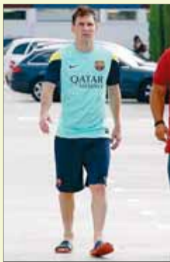
Messi va ser ahir a Sant Joan Despí

Messi no perdona ni un dia. Tot i que no hi havia entrenament, Leo Messi va anar ahir al matí a la ciutat esportiva de Sant Joan Despí per continuar treballant en la recuperació de la lesió muscular que es va fer fa deu dies. L'argentí, que no ha viatjat per concentrar-se amb la seva selecció, es vol posar a punt per participar en els importants partits que el Barça haurà d'afrontar després de l'aturada. ■ EL 9