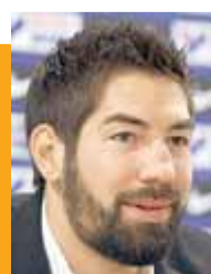
J. VALDANO. Entrenador futbol

"Tots els derbis són especials, estiguis al país que estiguis"