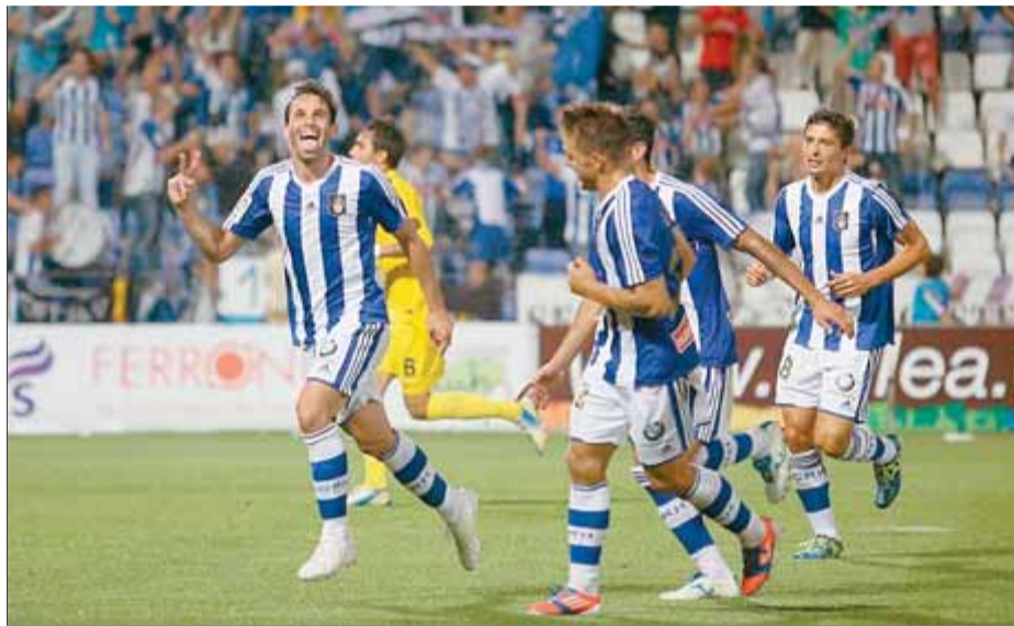
Els jugadors del Recre celebren un gol contra l'Hèrcules al Nuevo Colombino

El curs passat, Sergi Barjuan va poder treballar amb calma per assentar les seves idees i conjuntar una plantilla a la qual havia introduït nombrosos canvis. Amb espurnes de bon joc però excessiva irregularitat, el Recreativo no va patir per mantenir la categoria, però tampoc no va tenir mai possibilitats de lluitar per objectius més ambiciosos. No era un problema, però, per a la directiva andalusa, ja que l'aposta per l'exjugador del Barça buscava els resul-