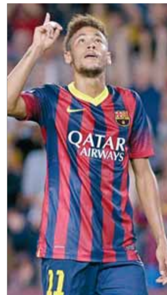
Neymar i Bale han viscut inicis de curs ben diferents

La presència del crac brasiler al camp contrasta amb les comptades aparicions de Bale, que no fa net dels problemes musculars a la cuixa esquerra que ja arrossegava quan va aterrar al Madrid. D'aquesta manera, Neymar ja acumula 760 minuts en 11 partits oficials entre supercopa, lliga i Champions. Amb un procés d'adaptació al futbol blaugrana rodó, ha respost a les grans expectatives que despertava i s'ha erigit en un líder ofensiu i un valuós soci per a Leo Messi. A hores d'ara ho ha ratificat amb