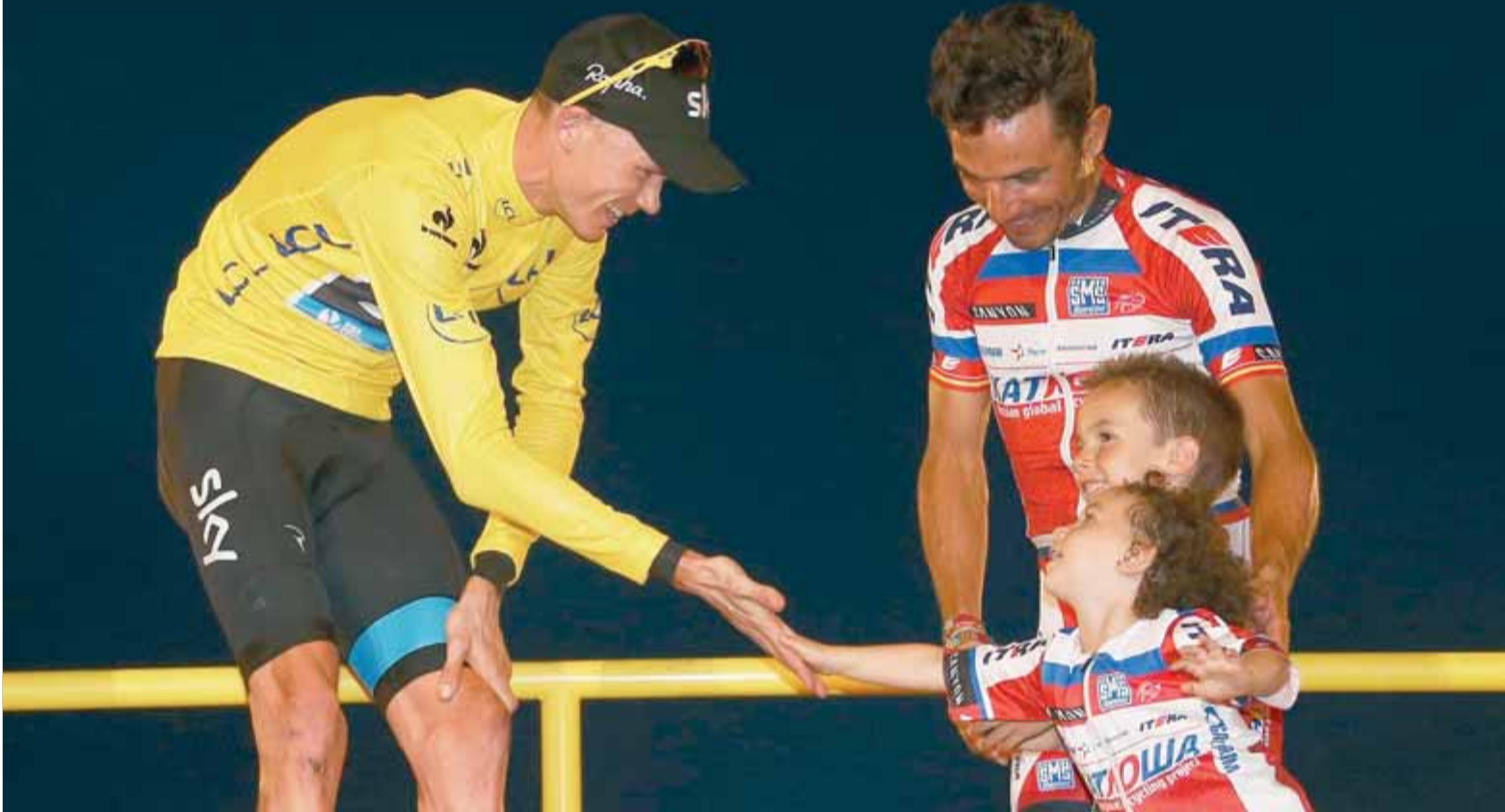
Chris Froome saluda els fills de Joaquim Rodríguez en el podi final del Tour de França d'aquest any

World Tour. El britànic Froome ha firmat un curs excel·lent (13 triomfs: 5 curses i 8 etapes), però no li ha servit per superar Purito en el rànquing UCI i diu que no correrà el Tour de Pequín