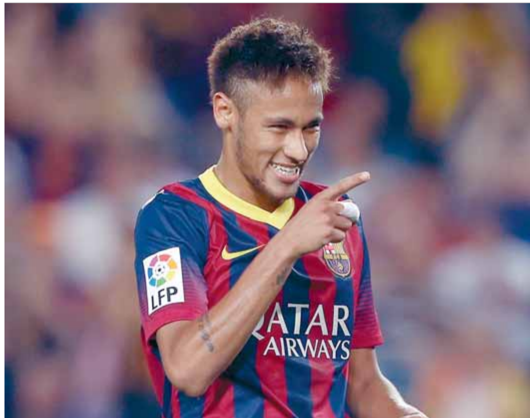
Neymar celebra un gol contra el Valladolid, en l'última jornada de lliga al Camp Nou

Ara tothom espera el mannà d'un nou i just repartiment de drets televisius que haurà de veure la llum el curs 2015/16. Tot depèn de fer una negociació col·lectiva i vendre la imatge de marca de la LFP. Tots els clubs de primera i segona han de pensar en grup i una guerra de guerrilles no beneficiarà ningú, ni el mateix Barça i Madrid que, a còpia de dominar amb mà de ferro el campionat domèstic, també han perdut, de retruc, esplendor a Europa per la falta de rigor competitiu. En l'hipotètic cas que es negociï un nou repartiment dels drets, tots els equips han de ser