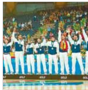
FEDDI BÀSQUET PARALÍMPIC