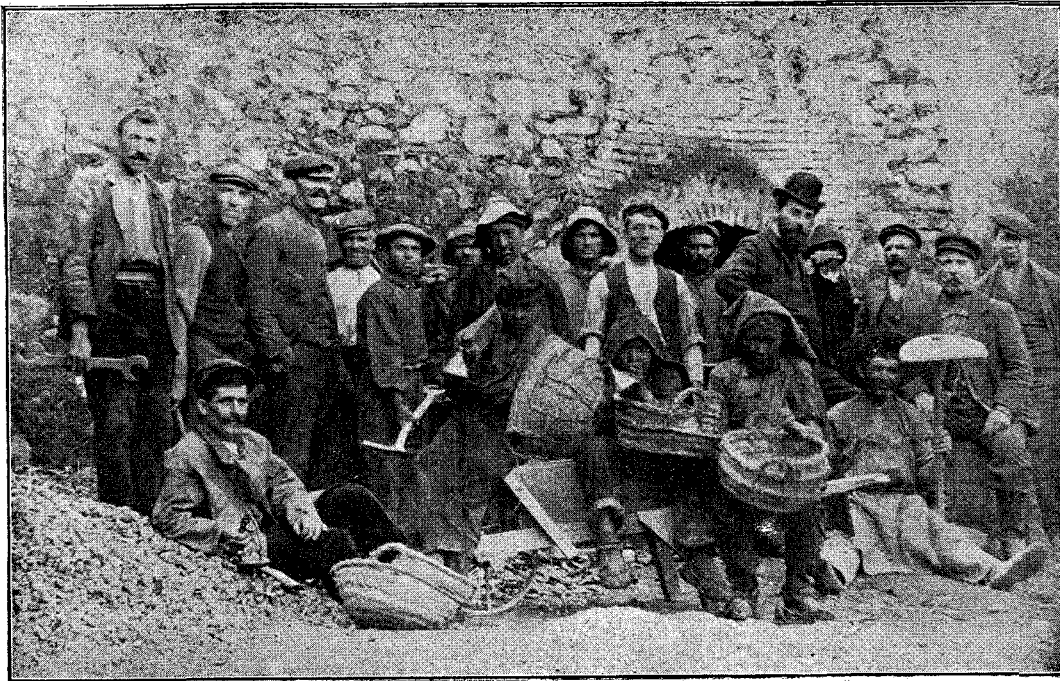
MINAS DEL "PAPA,,