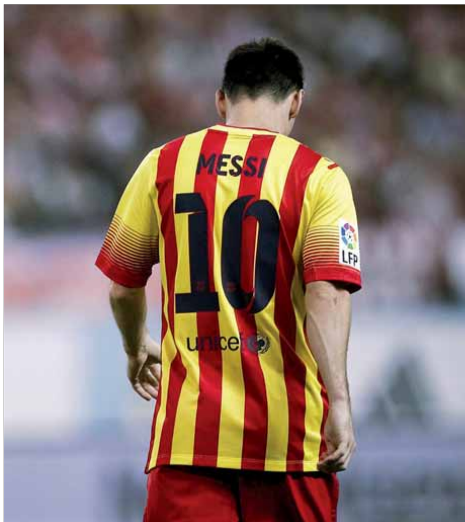
Leo Messi, capcot, camina sobre la gespa del Calderón

La primera part de Messi va estar en consonància amb la de l'equip. De fet, d'una pèrdua de pilota seva va néixer el gol de Villa en la primera part, en el moment en què intentava anar-se'n de tres rivals. El joc directe que va practicar el Barça durant la primera meitat no va afavorir gens el joc del de Rosario, que deambulava pel camp esperant l'esfèrica. La va rebre en el minut 23 i va decidir que s'havia d'intentar batre Courtois, però amb un xut des de la frontal de l'àrea no ho va aconseguir. La defensa de l'Atlético va evitar una bona actuació del crac argentí, que ja va disputar els darrers minuts del primer temps tocat. ■