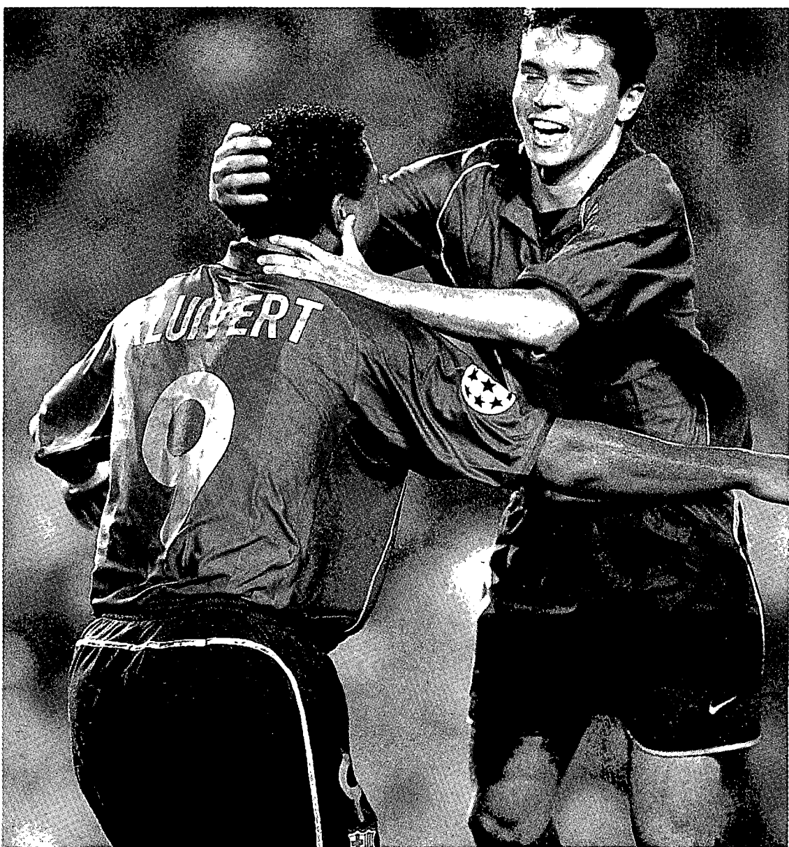
Els gols del trident han fet tornar l'alegria a Can Barça.

En el canvi de sintonia entre l'equip i la graderia hi ha tingut molt a veure Rivaldo. El brasiler, que tantes vegades apareix com a problema i tantes altres com a solució, passa ara per aquesta última fase i el Barça ho nota. Després d'aparèixer només set vegades vestit de blaugrana en els divuit primers partits de lliga, Rivaldo ha fet valdre els dos primers partits de l'any a casa per reconciliar-se amb una afició més agraïda per les seves exquisides prestacions professionals que dolguda per les declaracions en què s'oposava a la conveniència del partit entre Catalunya i la seva selecció del Brasil. El Camp Nou va pagar diumenge Rivaldo amb la dosi d'afecte que el brasiler reclama de tant en tant com a plus al seu salari milionari. La resposta van ser dos gols d'efecte sedant. El primer, per evitar els nervis de veure el Sevilla per sobre en el marcador; el segon, per matar el neguit d'afrontar la recta final del partit amb una