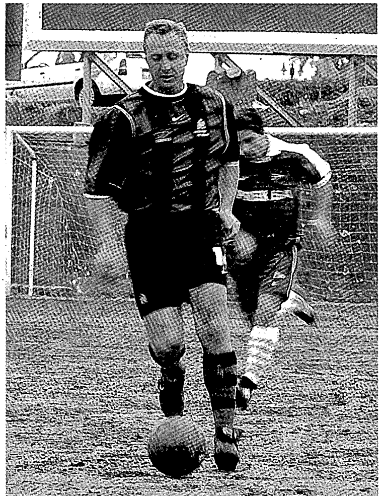
A l'esquerra, Johan Cruyff llegint El 9 a la graderia. A la dreta, vestit de curt amb els veterans de Sitges.