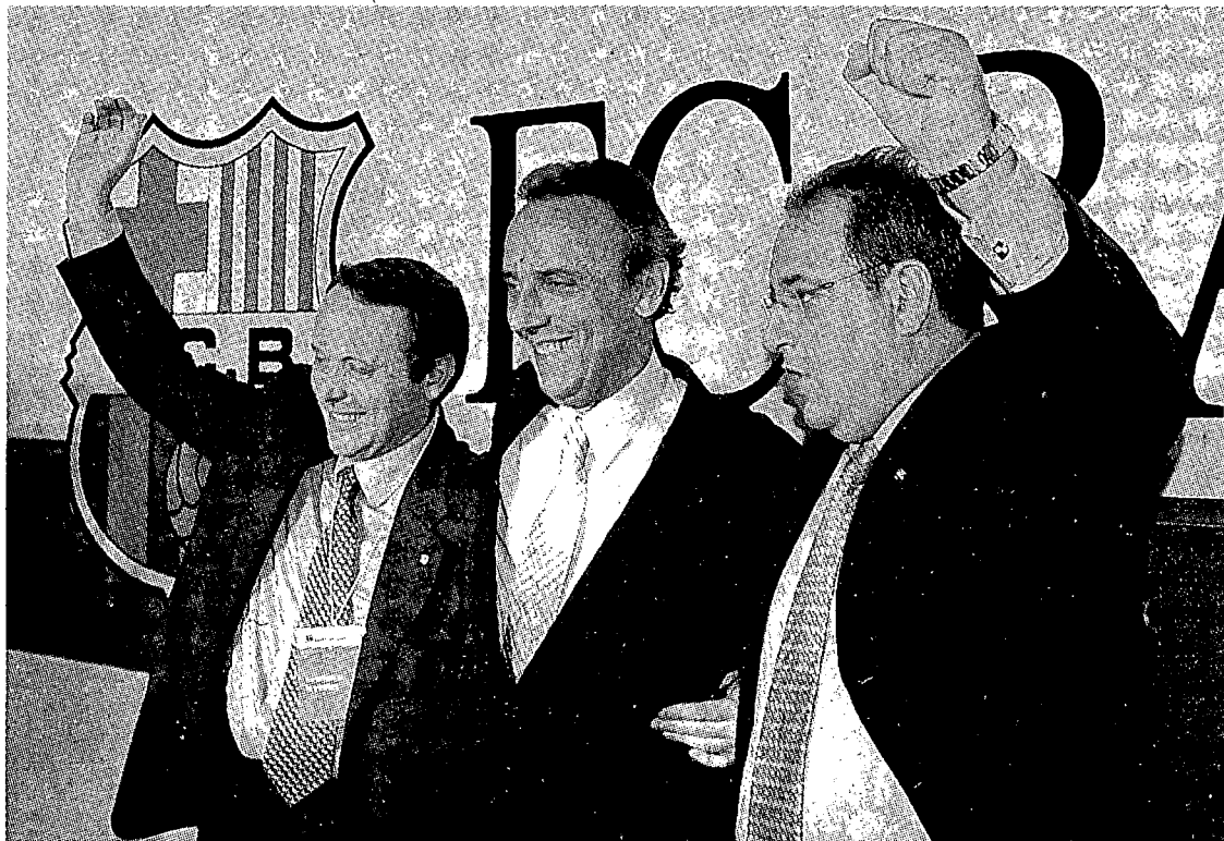
La junta directiva blaugrana es manté optimista sobre les possibilitats de l'equip aquesta temporada.

Ni parlar del Madrid. El president del Barça només va voler parlar del seu club i va llançar pilotes fora quan se li va preguntar pels continus elogis