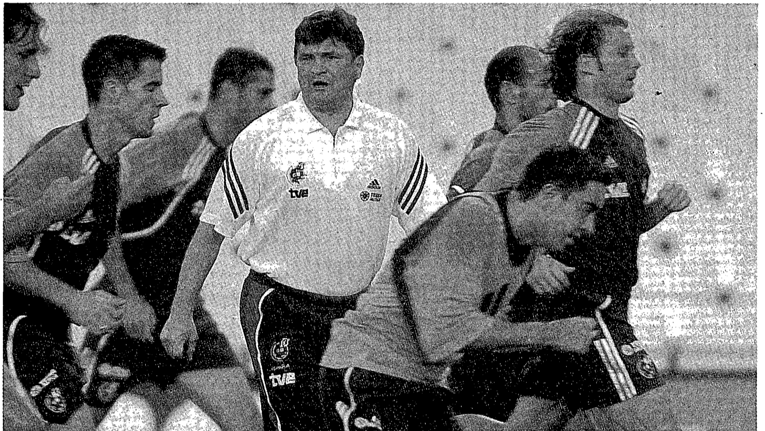
Camacho, dirigint un entrenament de la selecció espanyola. El tècnic podria haver de jugar l'Espanya-Portugal en un altre lloc.

Espanya ja va jugar un amistós a Montjuïc contra Itàlia el 1999, que no va registrar incidents tot i que les circumstàncies que envoltaven aleshores aquell partit eren molt diferents. Un dels possibles nous destins de l'Espanya-Portugal podria ser València o bé Alacant, però la RFEF està molt interessada que el matx es jugui