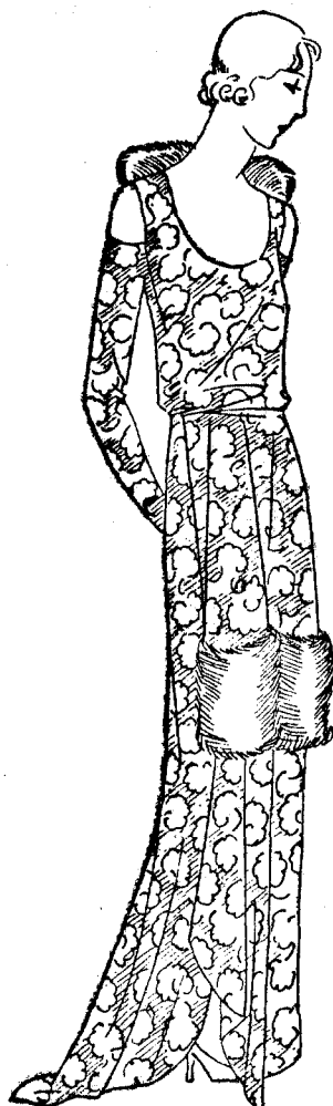
Cliché E 13.—Vestido de puntilla oro, adornado con renard amarillo. Con este vestido se llevan las mangas guantes.

dios suficientes para satisfacer todas las peticiones.