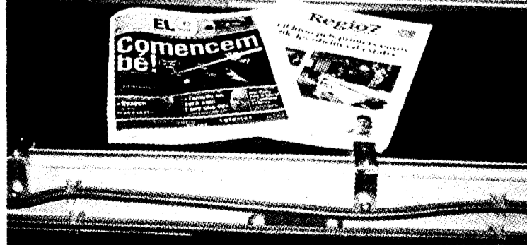
Alguns aspectes de la impressió i la venda del primer exemplar d'El 9, ahir a diferents ciutats de Catalunya.