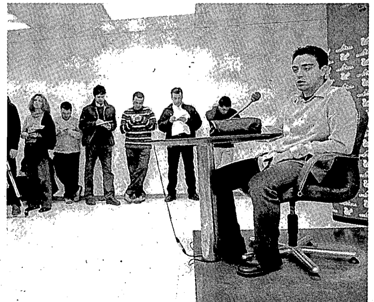
Xavi pensa que l'equip ha millorat molt.

Xavi va considerar normal que el València es queixi després de l'arbitratge que va patir al Bernabeu. «L'error de l'àrbitre en el gol anul·lat els va perjudicar i és normal que es queixi. Van perdre i han de buscar arguments», va cloure el cervell del Barça.