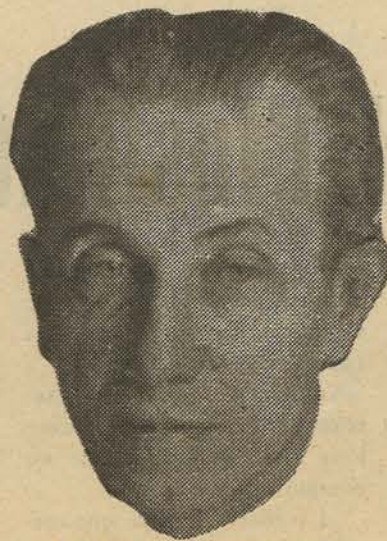
BOFILL I MATES

LA RAMBLA DE GIRONA, profundament catalanista i republicana, però al marge de tota actuació partidista i deslligada