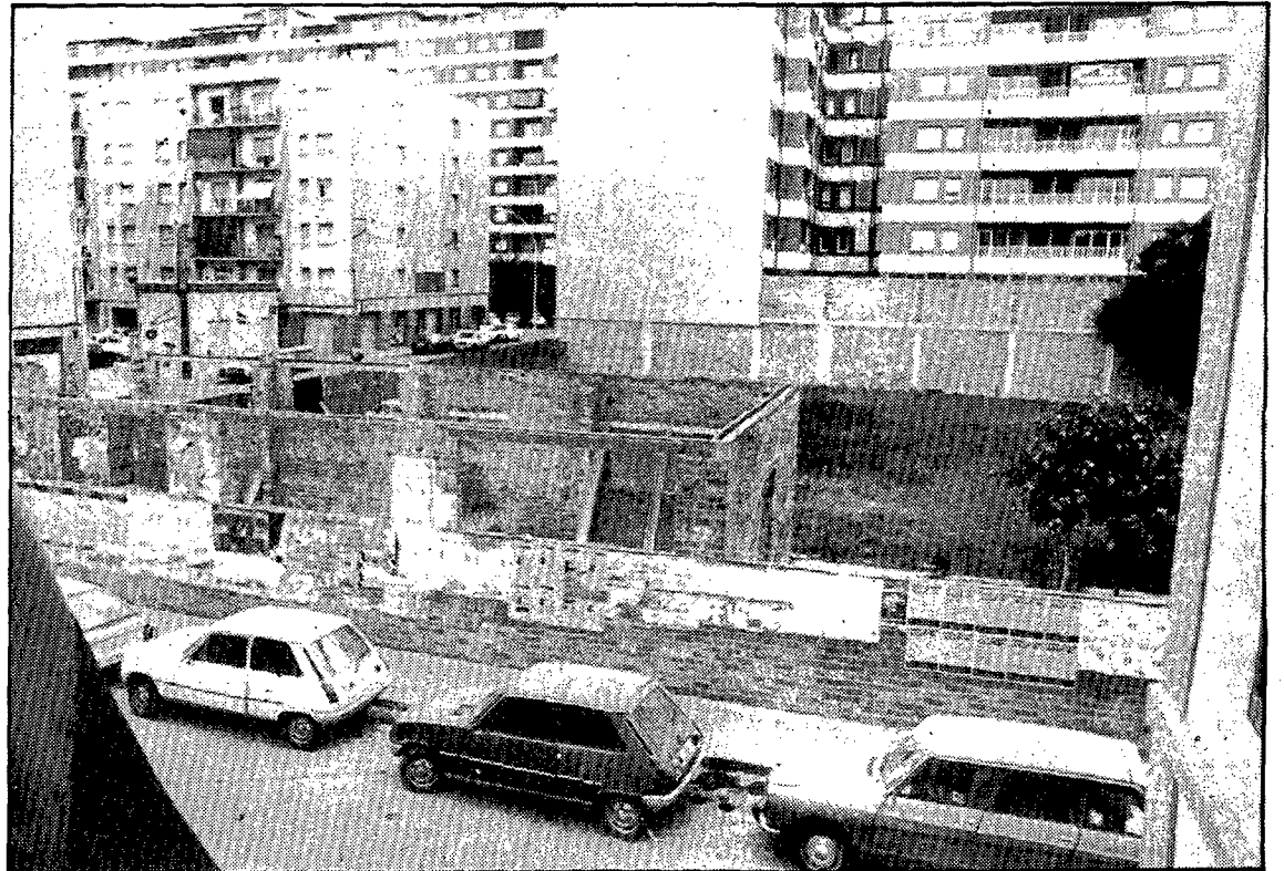
Aquesta passarà a ser una imatge d'arxiu un cop es construeixi el centre.