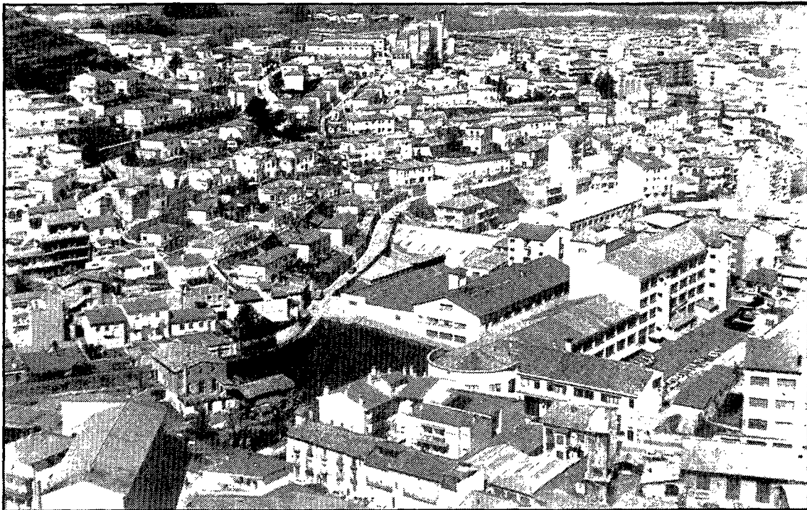
La comissió d'estètica urbana vetllarà per la imatge de la ciutat d'Olot.

Joaquim de Trincheria, en la seva proposta, pretén aconseguir «una coherència estètica de la ciutat. Per posar un exemple, podem parlar del que s'ha anat veient en el decurs dels anys. Les proporcions d'algunes estàtues situades al carrer no estan d'acord amb la línia estètica de l'entorn». En aquest sentit, Joaquim de Trincheria proposa establir uns criteris a l'hora d'elegir una estàtua o obra d'art que s'hagi instal·lat a qualsevol lloc. «Ens trobem a Olot que, per exemple, d'un sol artista tenim cinc escultures, mentre que dels Blai, Clarà només una». També l'actuació d'aquesta comissió aniria en l'as-