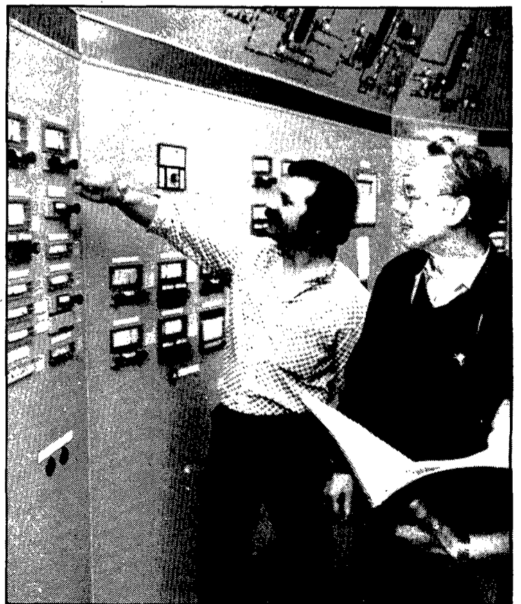
La innovación tecnológica no siempre está al alcance de las empresas gerundenses. (Foto Archivo).

Por esta razón, las Jornadas de innovación tecnológica que se han previsto en la Escola Universitària Politècnica de Girona no deben ni pasar desapercibidas al empresariado local ni quedar como algo aislado, sino que deberán ser este principio de algo aún más importante, la creación de esta sociedad mixta de innovación al servicio de nuestra demanda empresarial e industrial.