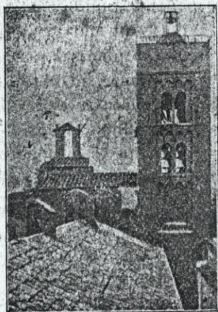
Vilabertran Campanar del Monestir

Inscripció per cada cursa: Pels socis, 2 rals; pels no socis, 5 rals.