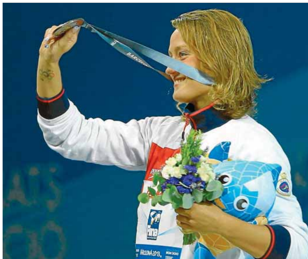
Mireia Belmonte dedicant la medalla de plata de 400 m estils als aficionats del mundial de Barcelona

L'èxit de públic en els Jocs Olímpics de Londres contrasta aquests dies amb les crítiques que estan rebent els organitzadors del mundial d'atletisme de Moscou per les grades mig buides, es-