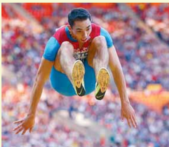
Menkov utilitza la tècnica de salt en extensió

Aleksandr Menkov va fer bons els pronòstics que l'assenyalaven com el gran favorit en el concurs de llargada. Impulsat pels aficionats locals, el jove siberià de 22 anys va fer una sèrie final de salts espectacular, coronats amb els 8,56 m, inabastables per a qualsevol dels seus rivals. Menkov, amb una tècnica de salt amb una extensió final impressionant, es va convertir en el primer europeu de raça blanca a assolir el títol de campió del món en llargada. També aspirava a aquesta fita Eusebio Cáce-