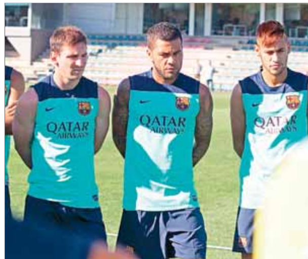
Messi, Alves i Neymar, escoltant atentament les instruccions de Martino en un entrenament