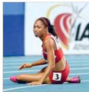
ALLYSON FELIX ATLETISME

La nord-americana haurà d'esperar dos anys per continuar sumant medalles en el mundial. Ahir una lesió en la final dels 200 m la va deixar KO.