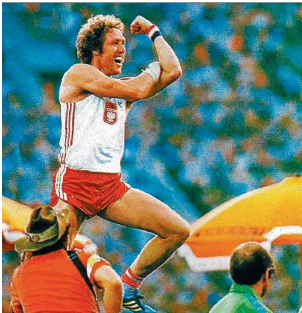
Wladislaw Kozakiewicz fa una botifarra al bell mig de l'estadi Lenin de Moscou el 1980