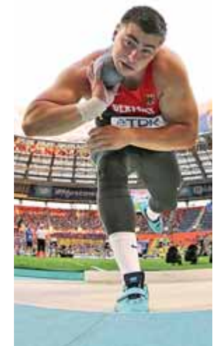
L'alemany David Storl, campió de pes