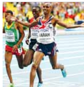
MO FARAH ATLETISME

La nord-americana haurà d'esperar dos anys per continuar sumant medalles en el mundial. Ahir una lesió en la final dels 200 m la va deixar KO.