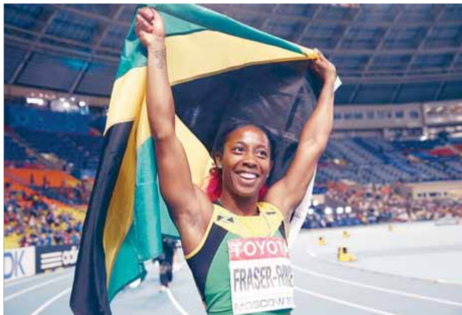
Allyson Felix plora de dolor i mala sort. A baix, Shelly Ann Fraser celebra el triomf