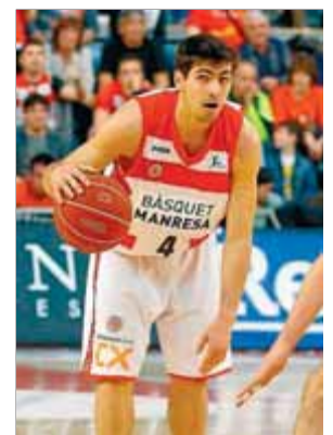
El base ■ B. MANRESA

Punts..... 3,2 Triples..... 44,4% (8/18) Rebots..... 0,9 Assistències..... 2 Pilotes perdudes..... 0,8 Minuts..... 11,7 Partits..... 12