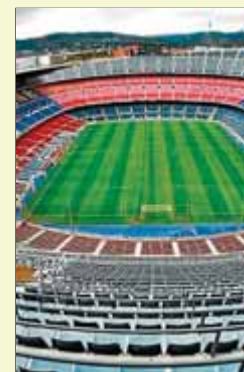
El Camp Nou tindrà gespa nova ■ EL 9

El Barça instal·larà calefacció a la gespa.