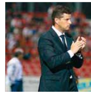
GIRONA FC FUTBOL

El club de la Catalunya Nord comença la lliga francesa amb aires de renovació tant a la directiva com a la plantilla després d'uns anys molt discrets.