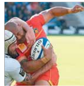
USAP PERPINYÀ RUGBI

Fa un any a Londres, campió olímpic als 5.000 i els 10.000 metres. Ara a Moscou, un altre doblat, aquest cop en els campionats del món.