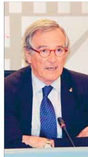
Xavier Trias , alcalde de Barcelona

tit, Trias va indicar: “Vaig escriure una carta demanant que aquests partits no es juguessin a aquestes hores, perquè ens creen problemes.” L'alcalde, a més, creu que la despesa que significa prolongar l'horari del metro —una hora costa 30.000 euros— no l'ha d'assumir l'Ajuntament. ■