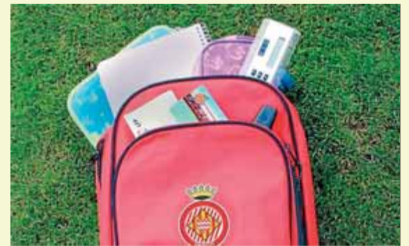
Imatge de la campanya per al pròxim partit ■ GIRONA FC