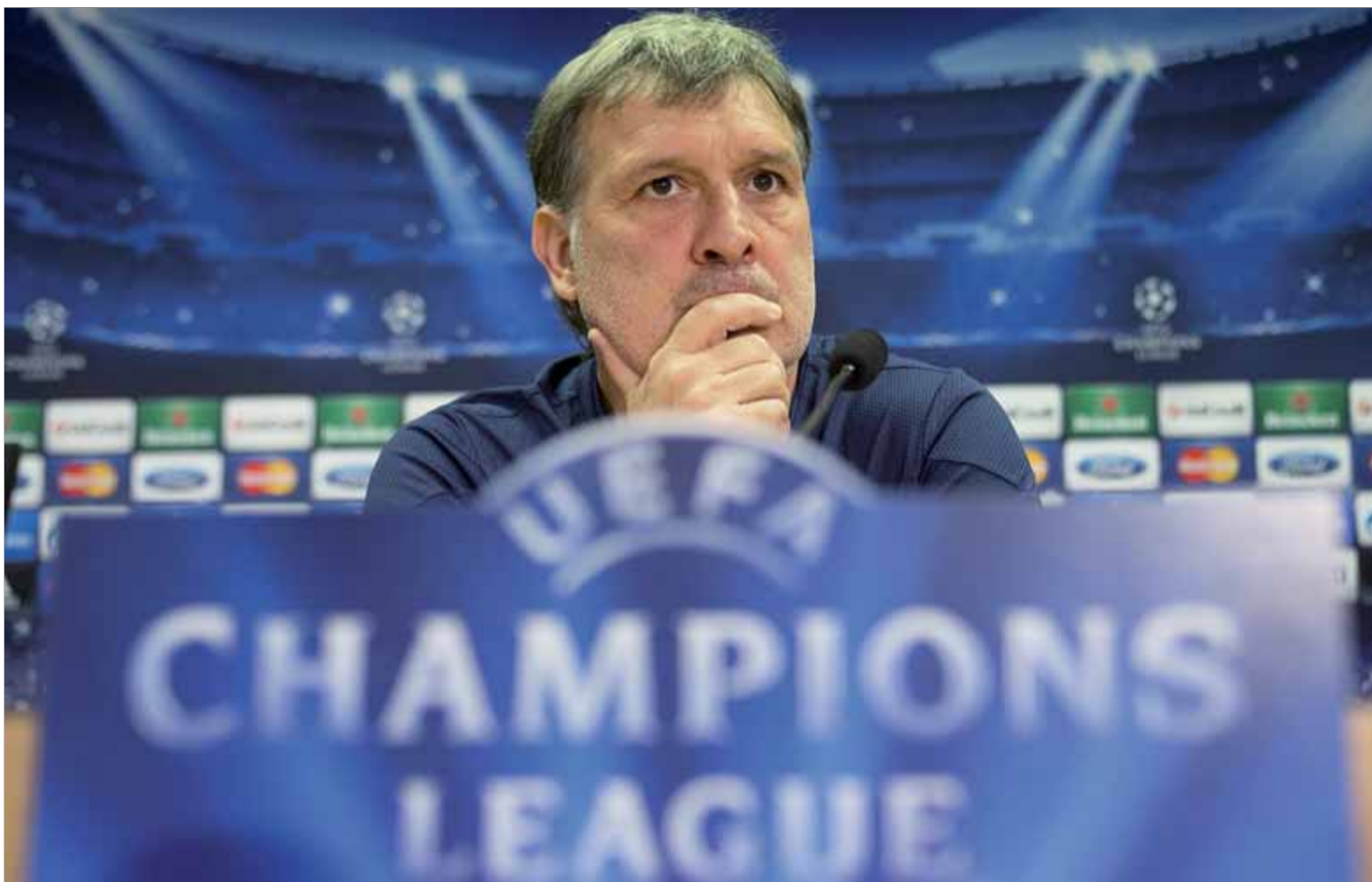
Un moment de la roda de premsa que Gerardo Martino va oferir ahir al migdia a la ciutat esportiva del FC Barcelona

Gerardo Martino. L'entrenador del FC Barcelona reconeix, el dia abans del seu debut en la Champions League, que al seu equip li cal millorar, per bé que ho ha guanyat tot fins ara