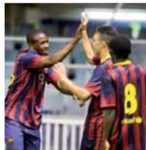
BARÇA JUVENIL FUTBOL

El porter del Madrid continua amb la seva malastrugança. Lesionat per Sergio Ramos, en el primer minut, va ser substituït en el minut 14.