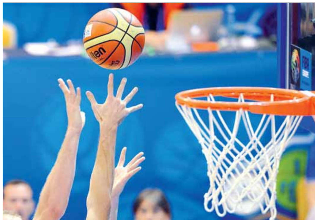
Una pugna per un rebot en aquest europeu

Ara, pensem per un moment. No ens sona tot això? El paral·lelisme entre tota la seqüència de fets abans esmentada i la realitat catalana és tan marcat que sembla extret d'una novel·la. Però és real. I ja no només per la capacitat del nostre país de fer la Via Catalana per expressar a tothom la intenció de caminar en solitari, sinó perquè els nostres esportistes –i ara estem parlant de bàsquet– formen la columna vertebral de la millor selecció espanyola de sempre i gran jerarca del continent en l'última dècada. Com en el seu dia ho havien estat l'URSS i Iugoslàvia. Tant de bo que el desenllaç fos el mateix –i a qui no li agradaria veure Catalunya competint amb naturalitat en els Jocs de Rio de Janeiro el 2016?–, però em temo que el procés serà més llarg i tortuós i ens caldrà persistència per assolir-ho. Tant és així que, segurament, ni els germans Gasol ni Navarro ni potser Ricky podran defensar la samarreta de la selecció catalana en un gran campio-