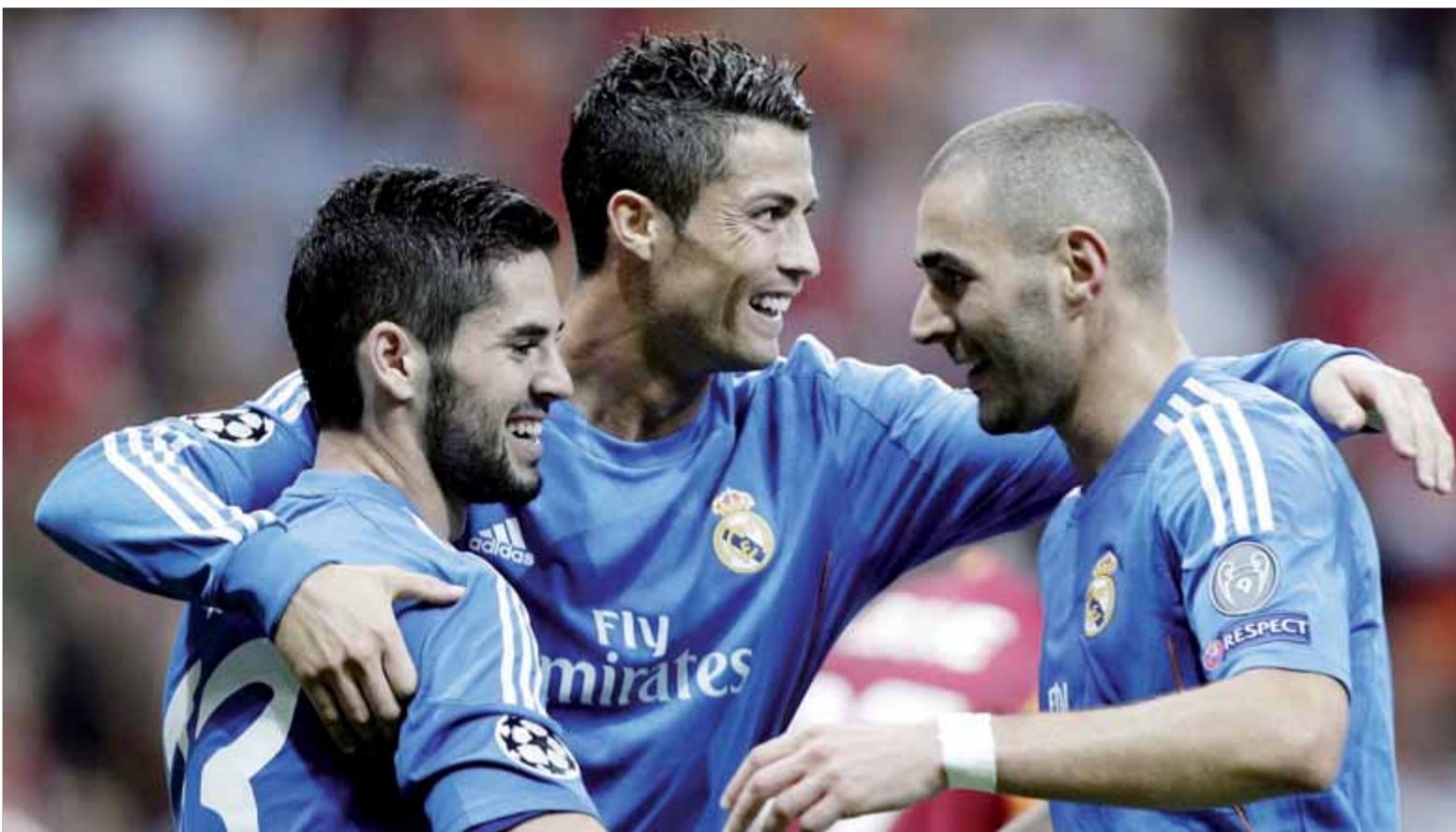
Isco, Cristiano i Benzema, els tres golejadors del Madrid en el partit d'ahir