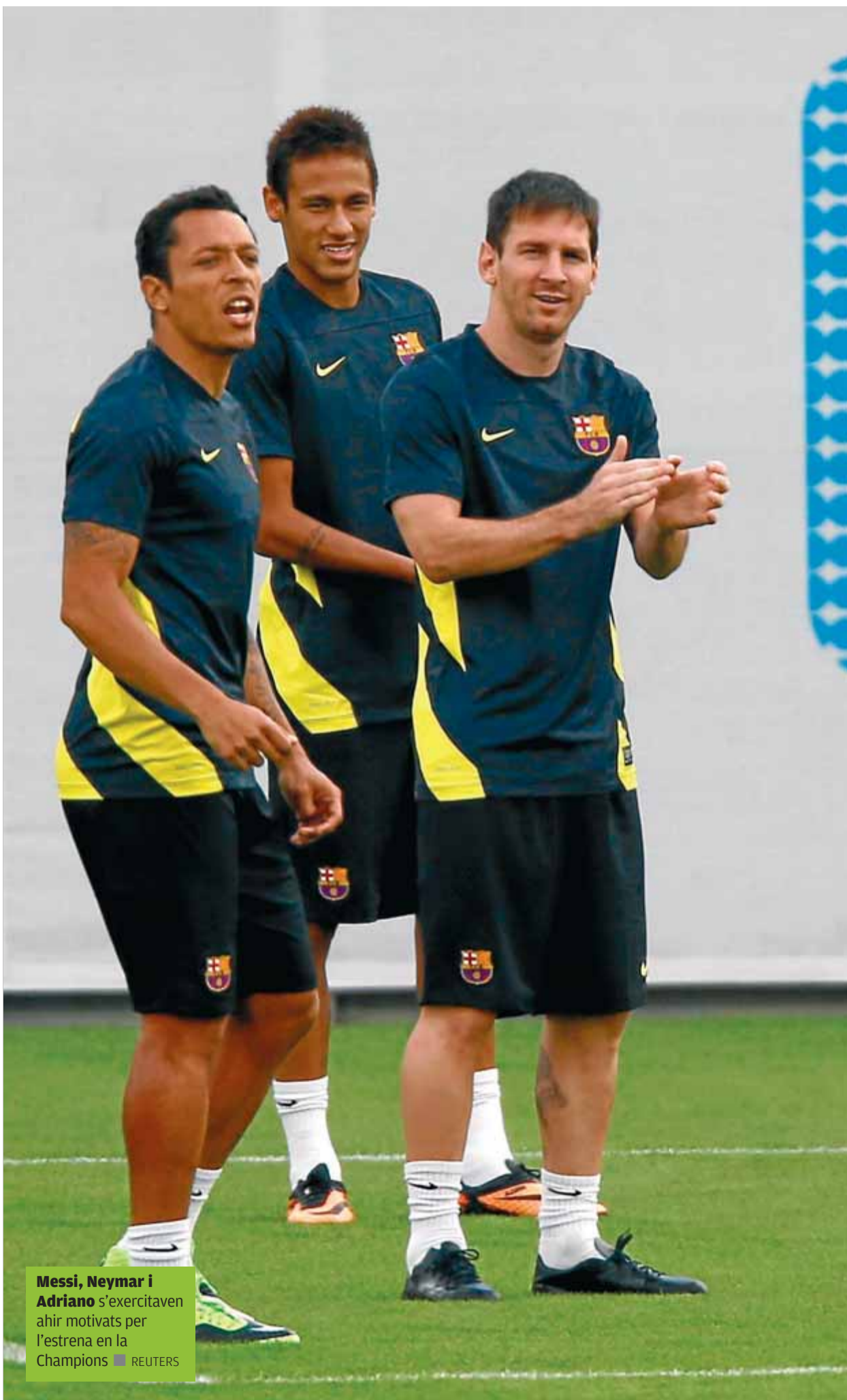
Messi, Neymar i Adriano s'exercitaven ahir motivats per l'estrena en la Champions

DUEL ENTRE HISTÒRICS • La Champions arrenca al Camp Nou amb la visita d'un il·lustre en recuperació, l'Ajax ESTIL COMPARTIT • L'aposta pel futbol creatiu és compartida, tot i que el talent del Barça el situa com a clar favorit