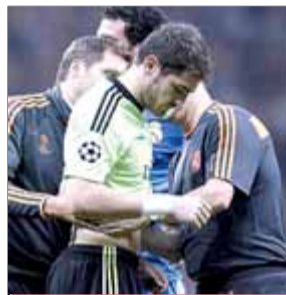
IKER CASILLAS FUTBOL

El porter del Madrid continua amb la seva malastrugança. Lesionat per Sergio Ramos, en el primer minut, va ser substituït en el minut 14.