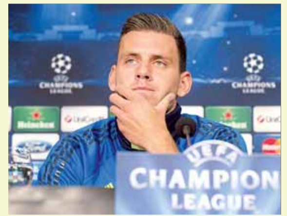
Adam Szalai, en la roda de premsa d'ahir