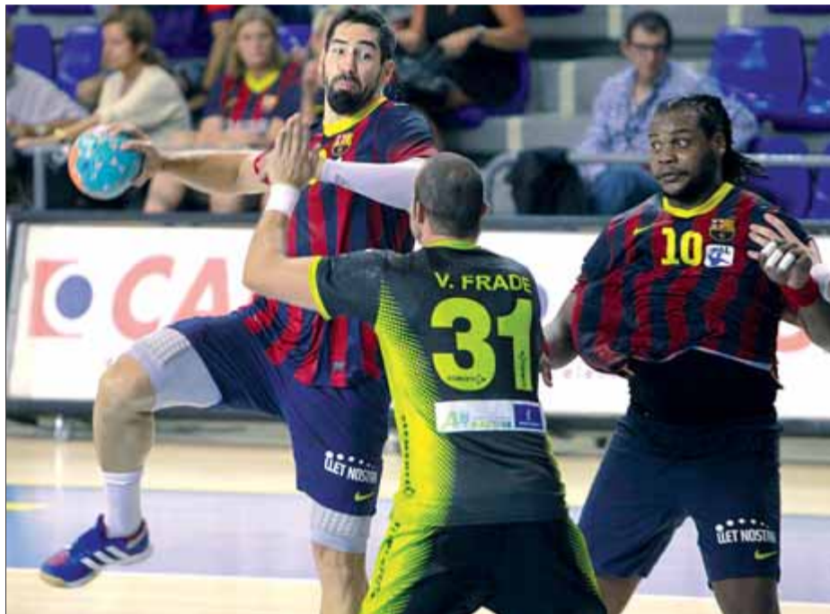
Karabatic va debutar al Palau dissabte contra el Globalcaja Ciudad Encantada ■ MARTA PÉREZ

Tot i la contundent estrena en l'Asobal –victòria 41-21 contra el Globalcaja Ciudad Encantada–, el tècnic Xavi Pascual va deixar clar que només estaven centrats en el partit d'avui: "L'equip té el cap en el partit d'Aranda. No podem permetre tenir errades d'aquest tipus. La gent, que pensi el que vulgui; a nosaltres ens importa el partit d'avui", va sentenciar. De fet, el Barça ja va demostrar en el seu debut al Palau que tot i la seva superioritat, afrontarà tots els seus compromisos amb la màxima predisposició: "La lliga és la que és, però això ens exigirà estar més concentrats. Em conformaria si l'actitud sempre fos així. Ens paguen per tenir un equip competitiu." I ahir va afegir: