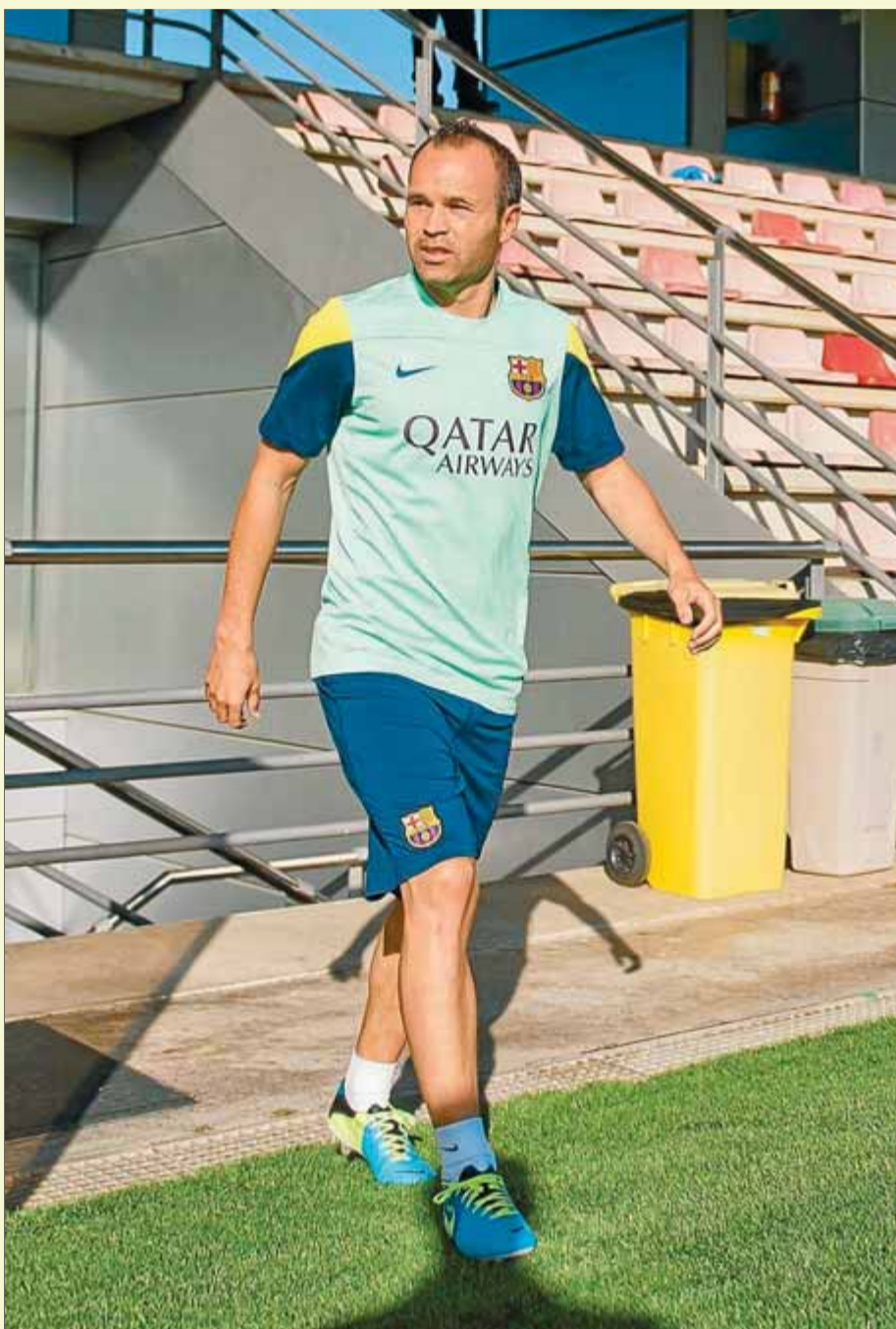
Andrés Iniesta, un exemple com a jugador i com a persona, en un entrenament

El manxec reuneix tot el que tenien els seus antecessors i, a més, té una màgia especial. El Barça ha tingut la sort de reunir Iniesta i