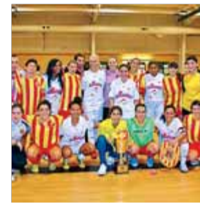
SEL. CATALANA FUTSAL

Dues frases a favor de Catalunya i Ona Carbonell ha passat de ser una heroïna de l'esport espanyol a ser impunement insultada a les xarxes socials.