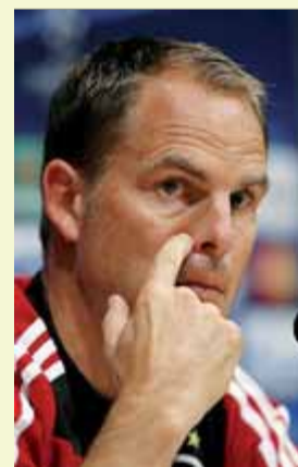
Frank de Boer

De Jong, que s'ha recuperat a temps d'una lesió. "Si no, no hauria viatjat a Barcelona amb l'equip", va remarcar De Boer, que va destacar la filosofia compartida entre els dos clubs però també la diferència en el potencial econòmic. Bona part de les preguntes al tècnic holandès van estar centrades en la seva etapa com a jugador blaugrana (1998-2003). "Tinc molt bons records de quan vaig jugar aquí. Barcelona és la meva segona ciutat",