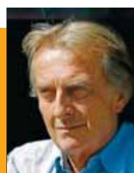
JOSÉ IGNACIO WERT. Ministre d'Esports

"No som tan masoquistes per contractar un pilot sense informar-ne Fernando Alonso"