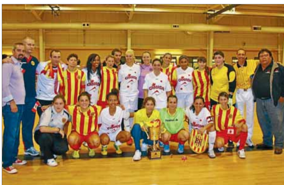
Catalunya defensarà a Barrancabermeja el títol assolit el 2008 a Reus ■ EL 9

Futsal. La selecció catalana femenina s'imposa en el premundial després de derrotar el Canadà per 3-5