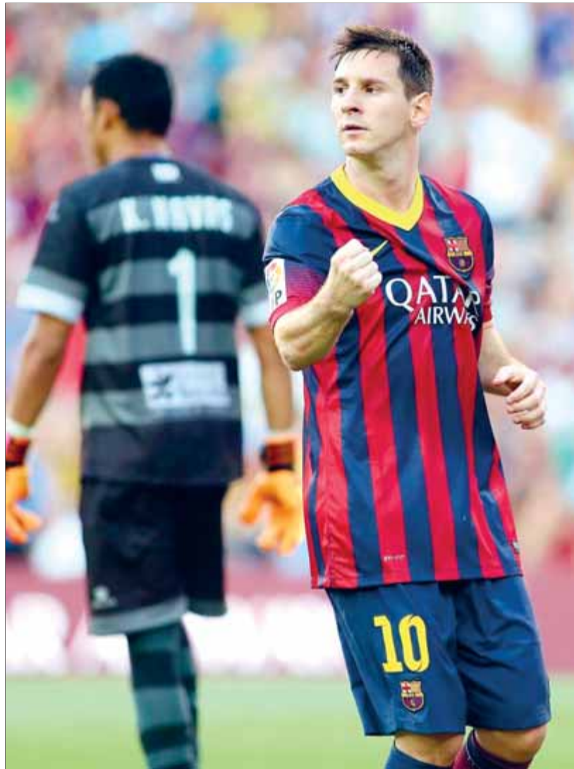
Leo Messi celebra un dels dos gols que va fer ahir en el debut en la lliga