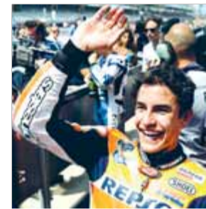
MARC MÁRQUEZ MOTOCICLISME

El Barça de Gerardo Martino va tenir una estrena immillorable a la lliga amb un gran joc i una contundent victòria contra el Llevant per 7 a 0.