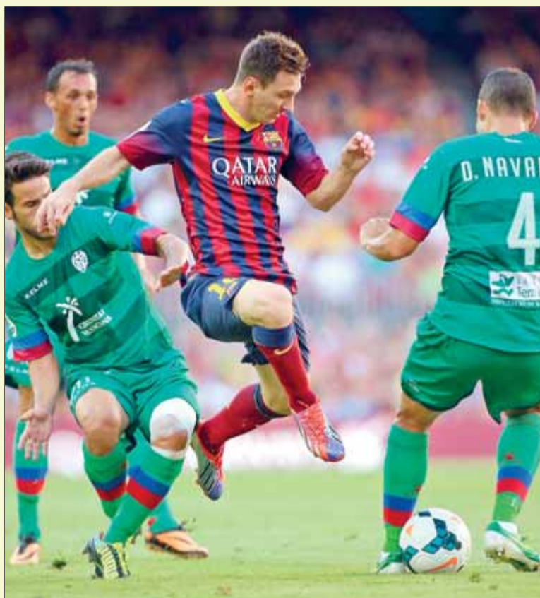
El Barça de Messi va fer tornar bojos ahir els jugadors del Llevant

La pressió va ser la intimidació constant que va exercir el Barça i que va provocar un malson al porter granota Keylor Navas, i no només quan encaixava gols a dojo, sinó també quan els aturava i havia de treure la pilota llarga davant l'assetjament a què Alexis, Pedro i el mateix Messi