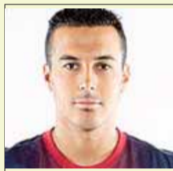
Neymar DAVANTER DEL BARÇA

“Estem recuperant la to física i la pressió avançada que havíem perdut?”