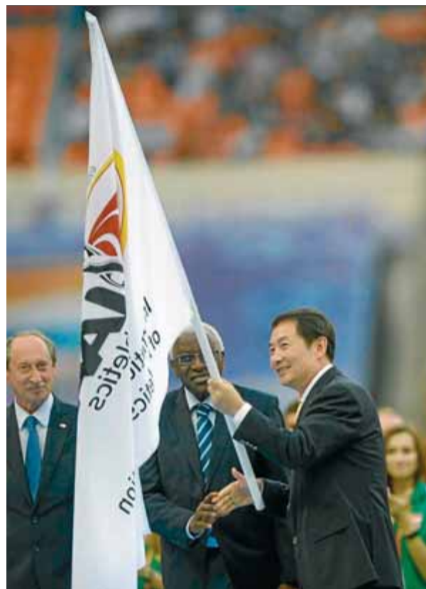
El relleu de la bandera de la IAAF a Pequín, seu del 2015.

Isinbàieva va haver de rectificar però ho va fer malament i tard. "L'anglès no és la meua llengua nativa i vaig ser malinterpretada. El que va vaig voler dir és que la gent hauria de respectar les lleis dels altres països, sobretot quan estan de visita", va escriure la tetracampeona mundial en un comunicat. El dia abans va criticar un gest de la saltadora d'alçada sueca Emma Green, que va competir amb les ungles pintades amb els