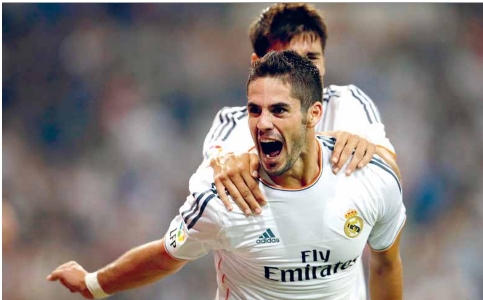
Isco, celebrant el seu gol, amb Morata al darrere seu

COMENTARI: El Granada va guanyar en la seva estrena a la lliga en superar l'Osasuna gràcies a un magnífic final de la primera part, en què van marcar el marroquí El Arabi i l'algerià Yebda. Els locals van reduir la diferència amb un gol del navarrès Puñal en la segona meitat (1-2). Amb aquest resultat, el Granada va desapropiar un penal i el marcador ja no va reflectir cap canvi. ■