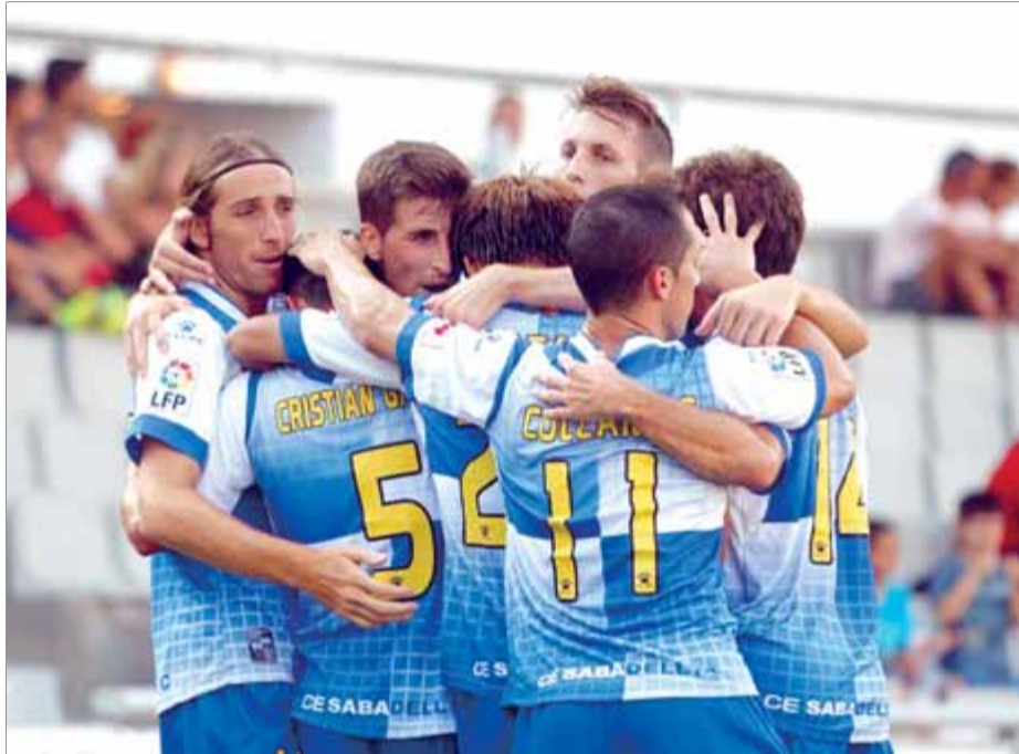
Els jugadors del Sabadell celebren un dels quatre gols d'ahir davant del Mallorca ■ O.DURAN