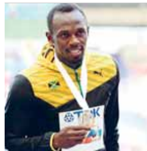
USAIN BOLT ATLETISME

A Moscou han fallat moltes coses i la federació internacional n'és la màxima responsable, com a encarregada de vetllar que tot funcioni bé.