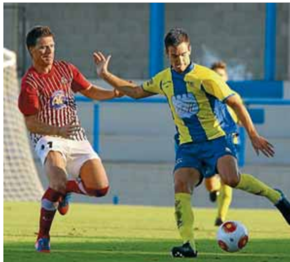
Una acció del duel d'ahir a Palamós ■ M. LLADÓ

via per encarrilar la victòria. En els últims 20 minuts, el Palamós va jugar amb comoditat contra un Vic que no va inquietar la porteria de Bartrina. Ja a les acaballes del partit, Dani Fernández feia pujar el 3-0 al minut 87, i Puguí, màxim goleador de la pretemporada, marcava el quart (88'). ■