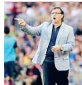
FC BARCELONA FUTBOL

Tres medalles d'or més a Moscou, i atrapa Carl Lewis, Michael Johnson i Allyson Felix com als millors de la història dels mundials.