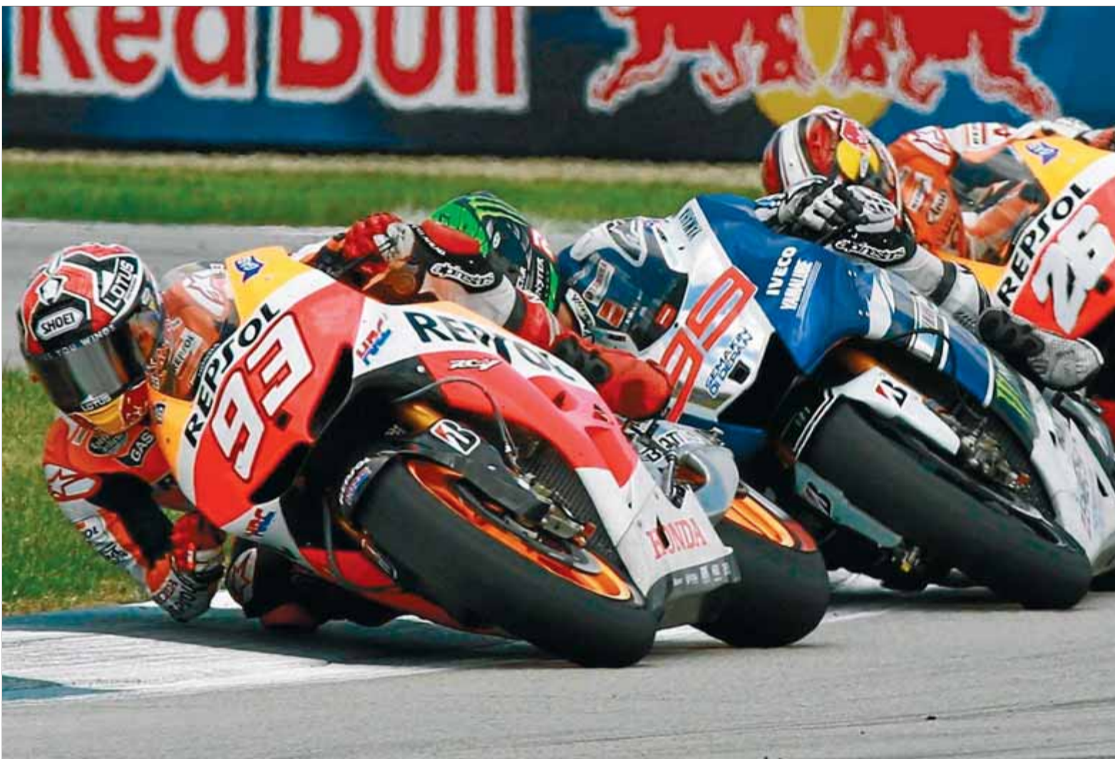
Márquez, al davant de Lorenzo i Pedrosa, instants després de superar el mallorquí

GP d'Indianapolis. Moto GP. Tercer triomf consecutiu de Marc Márquez, que venç amb absoluta autoritat i enforteix el seu lideratge. Pedrosa supera Lorenzo al final i ara és segon