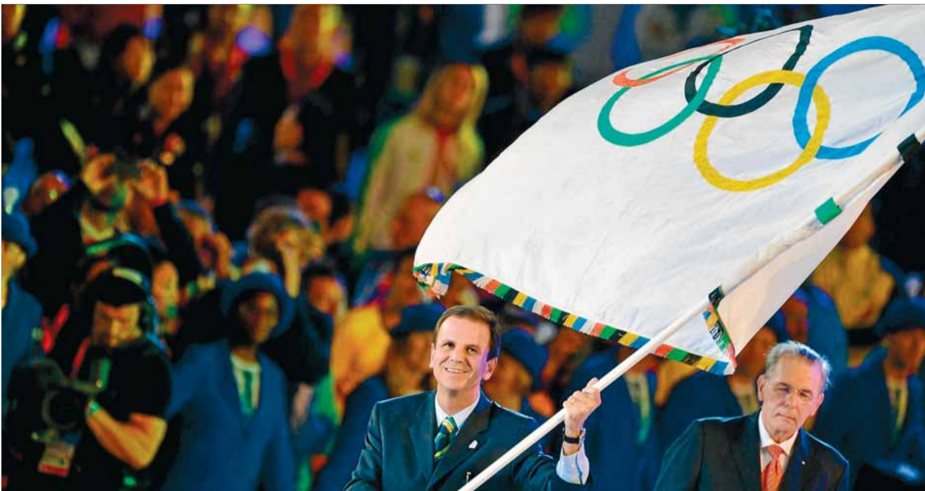
L'alcalde de Rio de Janeiro amb la bandera olímpica durant la cerimònia de clausura dels Jocs Olímpics de Londres

Seleccions. Les possibilitats perquè un equip català sigui als Jocs de Rio del 2016 depenen del fet que la consulta es faci el 2014 i que el Comitè Olímpic Català sigui reconegut el 2015