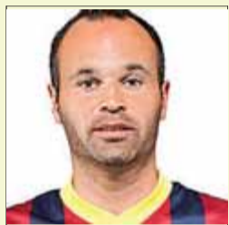
Leo Messi DAVANTER DEL BARÇA

“Hem estat eficaços de cara a gol i hem començat amb bon peu?”