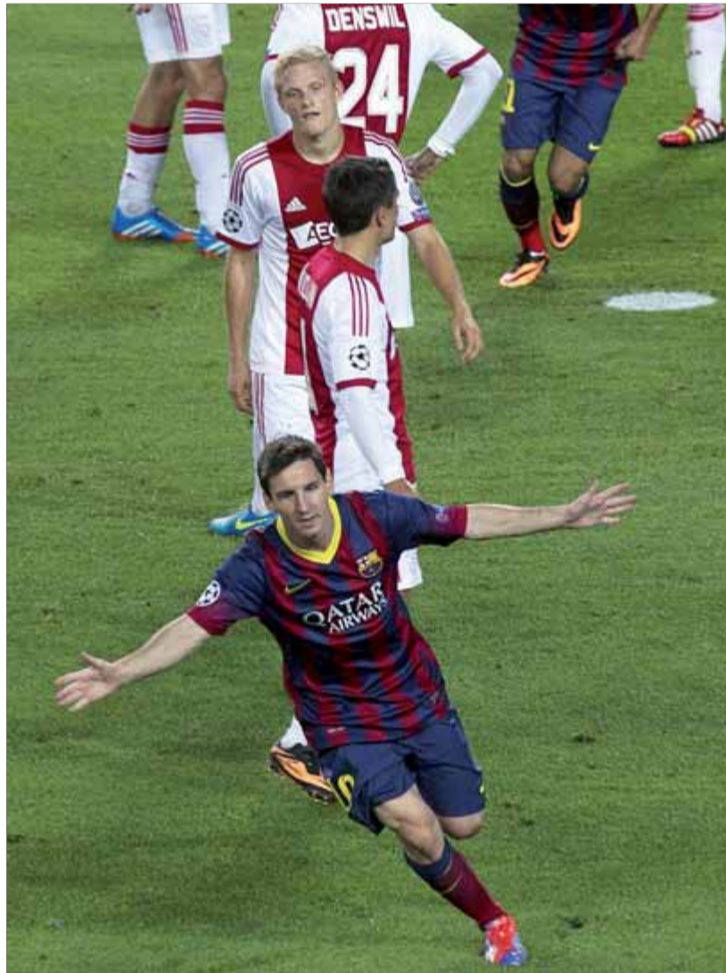
Leo Messi fa l'avió per celebrar el seu primer gol en aquesta Champions

Dades facilitades per Carles Domènech. La transmissió d'en Puyal a Catalunya Ràdio