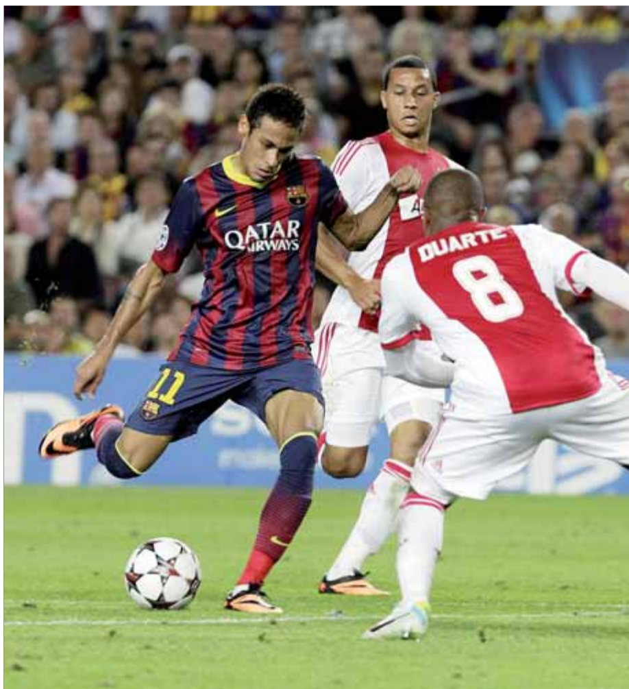
Neymar fa un dels xuts a porta que va intentar ahir en la seva estrena a la Champions

I Neymar s'ho va mirar des de la seva posició, a l'extrem esquerre. Sempre disposat a combinar amb Messi i companyia, sempre endollat quan havia de fer pressió, sempre enganxat a la banda quan calia obrir espais, sempre amb la cama a punt quan