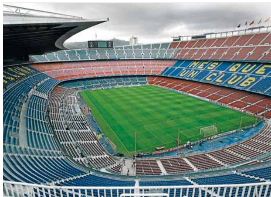
CAMP NOU / P. VIRGILI

Desenganyem-nos. Si es vol disposar d'un estadi amb totes les innovacions, comoditats i serveis del segle XXI cal fer-ne un de nou. Qualsevol reforma sempre està condicionada a una estructura original, que en aquest cas ja arrossega gairebé 50 anys, i per molt bon rentat de cara que es faci, sempre hi ha arrugues inesborrables. Deixin que els faci una comparació. Què preferim, tunejar el cotxe quan comença a estar atrotinat o comprar-ne un de nou posant aquí o allà els accessoris que desitgis? En el segon cas la inversió serà més alta, no ho dubto, però el rèdit també és molt més gran en valor i durada. I pel que fa al factor sentimental, fixem-nos com xalen els aficionats de l'Athletic amb el nou estadi, tot i haver dit adéu al vell San Mamés.