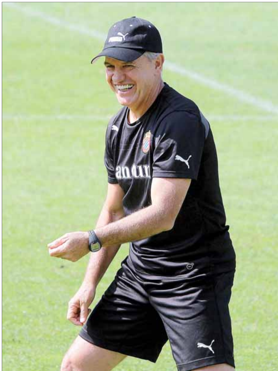
Javier Aguirre és el tècnic de l'Espanyol amb millor estadística de victòries fora de casa. 'El Vasco' sembla que ha posat fi a un mal endèmic en l'Espanyol

Ara mateix aquesta tendència secular s'està trencant amb Javier Aguirre a la banqueta. I és que el tècnic mexicà s'ha convertit, en el poc temps que fa que és a la banqueta, en el millor entrenador a domicili que ha tingut l'entitat blanc-i-blava en la seva història. Almenys així ho indica l'estadística, que li atorga el més alt percentatge de victòries lluny de casa. El Vasco té un 33,3 per cent de victòries a camp contrari. Aguirre ha disputat quinze enfrontaments lluny de Cornellà, dels quals n'ha guanyat cinc. L'any passat ho va fer contra l'Athletic a San Mamés (0-4); a Màlaga (0-2); contra l'Osasuna (0-2) i a Getafe (0-2). Aquest any, al marge de l'empat que va aconseguir en la jornada inaugural contra el Celta a Balaídos (2-2), amb remuntada inclosa, va aconseguir el seu cinquè triomf a domicili contra el Grana-