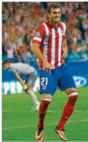
Léo va sentenciar