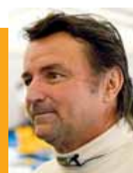
Jug. Barça bàsquet

"La pau entre Fernando Alonso i Kimi Räikkönen durarà poc"