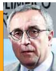
JOSEPH BLATTER. President de la FIFA

"Jo ja he plorat, ja no ploro més, i seguiré treballant per l'esport espanyol perquè aquest país ho mereix"