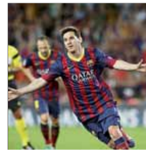
LEO MESSI FUTBOL

El porter blaugrana continua en estat de gràcia en aquest inici de temporada i, ahir, contra l'Ajax fins i tot va ser capaç d'aturar un penal.