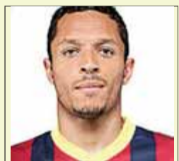
Cesc Fàbregas MIGCAMPISTA DEL BARÇA

“Hem estat parlant de corregir coses i avui [per ahir] hem millorat alguns aspectes?”