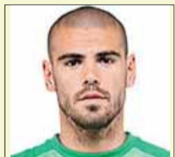
Andrés Iniesta MIGCAMPISTA DEL BARÇA

“No esperàvem que juguessin com ho han fet, però hem defensat bé?”