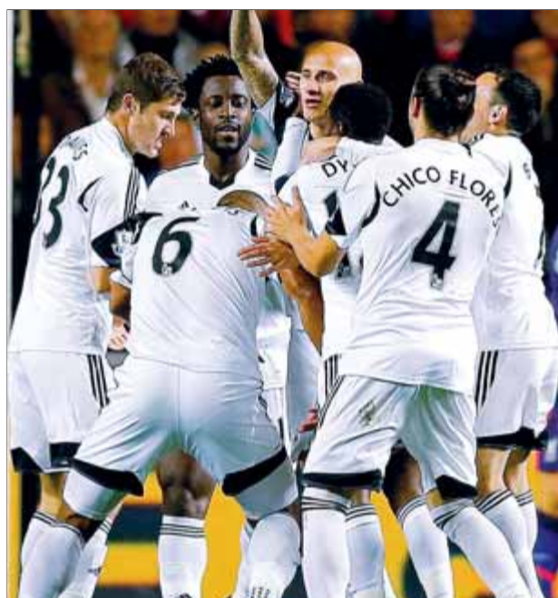
Els jugadors del Swansea (esquerra) i del Wigan (dreta) celebren sengles gols, aquesta temporada

COMENTARI: La millor arribada de l'Arsenal li permet allargar a Europa el seu bon moment en la lliga. Els francesos només van poder marcar de penal en el temps afegit.