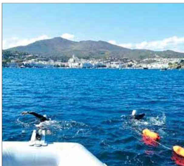
Els nedadors, camí de Cadaqués ■