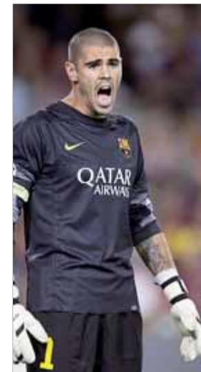
Víctor Valdés

da que Van Rhijn va fer-li des de molt a prop. La segona, poc després, blocant un xut de Duarte des de la mitja lluna. La tercera, quan el partit moria i ja havia aturat el penal, responnent a un potent xut de Bojan. La quarta, i última, quan va volar per enviar a córner una canonada de Poulsen. ■