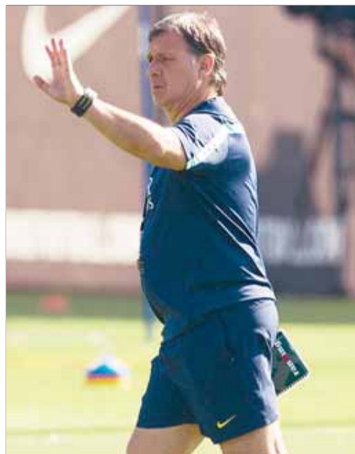
Gerardo Martino, ahir, a la ciutat esportiva

Ahir, en la roda de premsa prèvia al partit d'aquesta nit contra la Real Sociedad, Gerardo Martino ja va haver de donar explicacions a totes aquestes qüestions i unes quantes més. El tècnic argentí està fent un curset accelerat de què és el club, la seva particular idiosincràsia i el seu entorn. I ja ha començat a treure'n conclusions. Martino està sorprès per tot el debat que s'ha generat i ha explicat als seus que no entén res. Diu que no pot entendre com hi poden haver tants dubtes després d'haver guanyat els cinc partits de lliga disputats, haver golejat en l'estrena de l'equip en la lliga de campions i haver guanyat el primer títol de la temporada contra un Atlético de Madrid que està en un gran moment de forma i que és, de moment, l'únic equip que