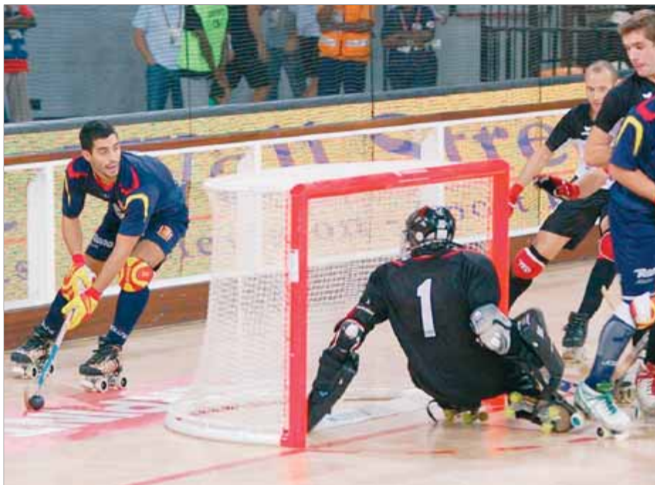
Torner passa pel darrere de la porteria d'Àustria buscant una ocasió de gol

En els primers minuts de partit, els austríacs van plantar cara als actuals campions del món, que van trigar dotze minuts a inaugurar el marcador. La falta de definició, les bones aturades del porter i els pals —en van fer tres—, van mantenir el partit anivellat i es va arribar al descans amb un curt 0-3. En la segona meitat, com en el primer partit contra Suïssa,