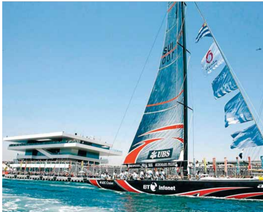
L' Alinghi , vencedor de l'edició del 2007 a València, passa per davant de l'edifici Veles e Vents

El pas del temps, accelerat per la crisi econòmica, es visualitzen en aquella dàrsena ara semiabandonada. A partir del 2007, la gran majoria de les bases van començar a quedar desertes i fins i tot s'ha decidit que algunes siguin derruïdes. Les empreses tecnològiques que havien d'ocupar l'espai no han arribat, possiblement per les mancances que presentava la visió de futur del projecte. Respecte al llegat immaterial d'aquells dies, també s'ha anat diluint amb les onades. Més enllà de les grans construccions, la copa d'Amèrica també havia d'acostar els ciutadans