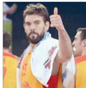
MARC GASOL BÀSQUET

El pivot català ha estat inclòs en el cinc ideal de l'uropeu de bàsquet. Ja fa set edicions que hi ha un català en l'equip ideal del campionat.