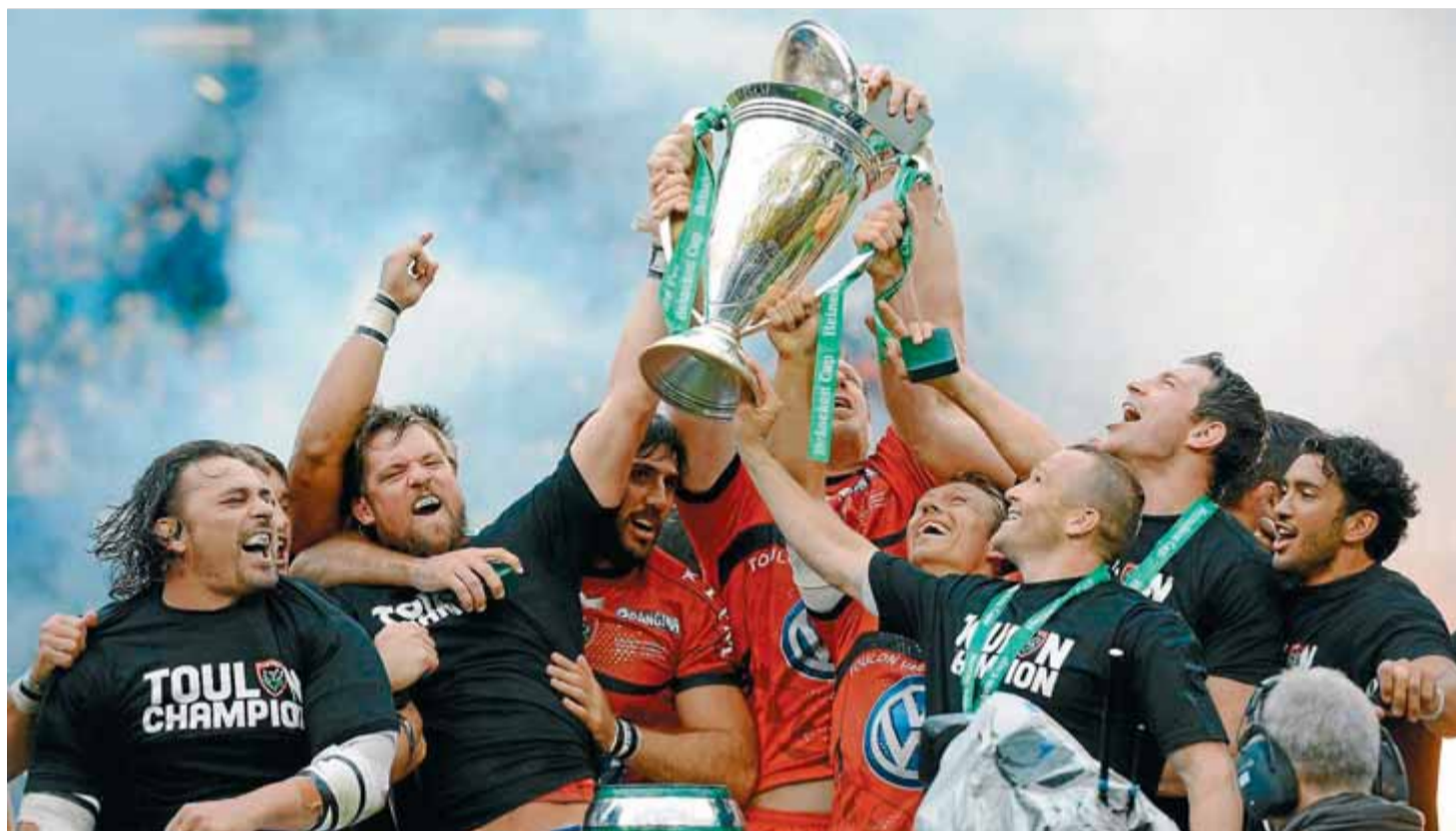
Els jugadors del Toló celebrant el triomf en la copa d'Europa de la temporada passada

La competició serà batejada com a Rugby Champions Cup i entrarà en competència directa amb el torneig oficial, un fet que ja va passar en el bàsquet europeu quan la FIBA i l'Eurolliga (2000-2002) van organitzar paral·lelament dos grans tornejos continentals. La versió oficial dels clubs rebels, entre els quals hi ha la USAP de la Catalunya del