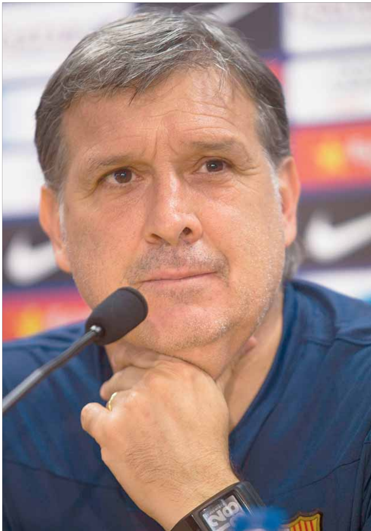
Tata Martino , en la roda de premsa prèvia al partit d'aquesta nit contra la Real Sociedad

bilitat que se li presenta de superar el bon inici del Barça en la lliga –l'equip ha aconseguit cinc victòries en les cinc primeres jornades i l'objectiu és fer el set de set– va assegurar: “Jo el que vull és guanyar la lliga. M'interessa només com acaba l'any.”