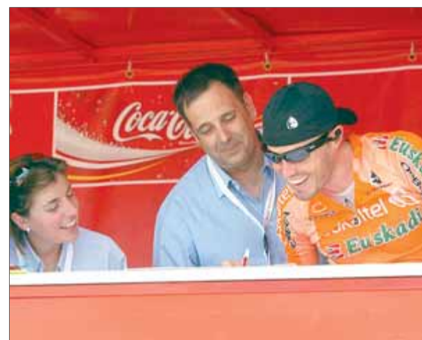
L'acord entre Euskaltel i Alonso s'ha trencat ■ J.F.

De moment, qui pot haver rebut la notícia amb més bons ulls és el Movistar, que veia el projecte com una amenaça al seu monopoli. ■