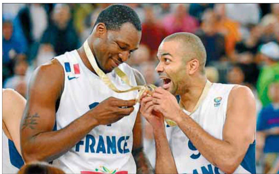
Florent Pietrus i Tony Parker, cofois amb l'or al coll

fàcil guanyar l'amfitrió, la teva bèstia negra i una final anant de favorits sota la pressió de "o caixa o faixa".