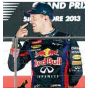
SEBASTIAN VETTEL AUTOMOBILISME

El pivot català ha estat inclòs en el cinc ideal de l'uropeu de bàsquet. Ja fa set edicions que hi ha un català en l'equip ideal del campionat.