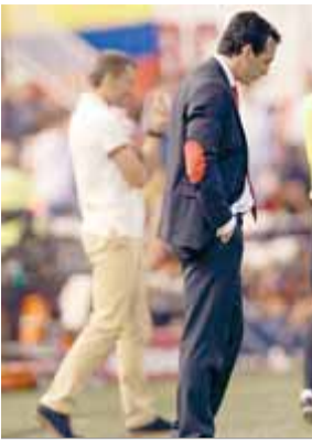
Unai Emery, en el partit de diumenge a Mestalla

Primera. El Sevilla, que no ha guanyat cap partit, és cuer i tothom qüestiona el tècnic