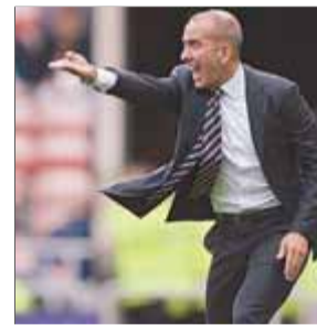
DI CANIO FUTBOL

Gran demostració de força en el Gran Premi de Singapur del pilot alemany i de Red Bull, que volen cap al seu quart campionat mundial.