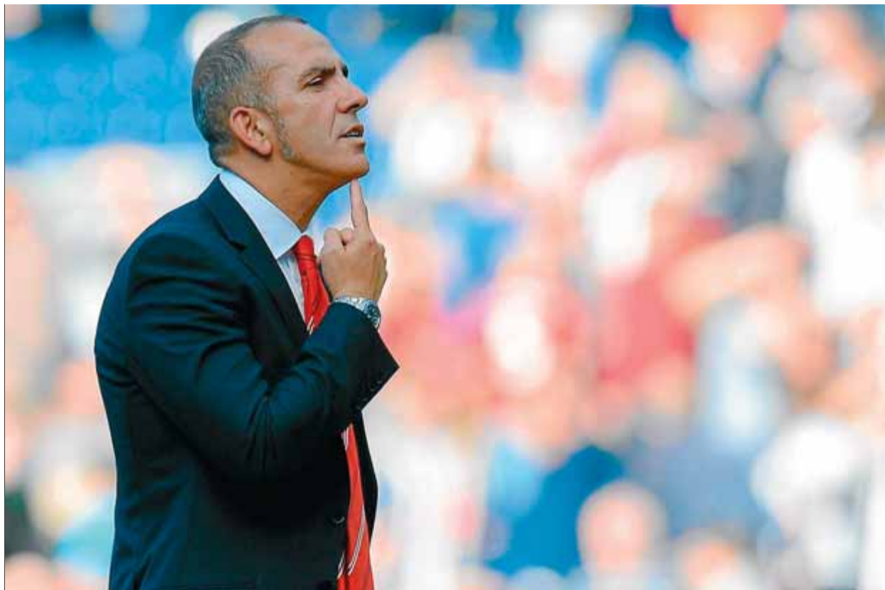
Di Canio , plantant cara als aficionats del Sunderland, després de l'última derrota

El tècnic del Benfica, davant del jutge. La policia de seguretat pública portuguesa va enviar al jutge un informe en què acusa Jorge Jesús d'haver empenyat dos policies que retenien alguns aficionats del Benfica que havien envaït el camp a Guimarães.