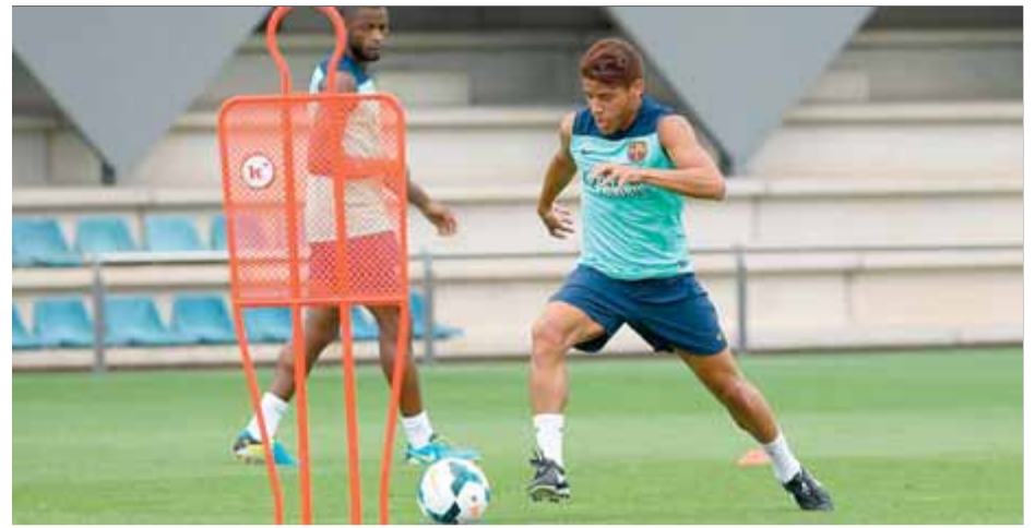
Jonathan dos Santos, en un entrenament d'aquesta temporada

El canvi de posició de Dos Santos durant la pretemporada, com ell mateix va recordar després, es va produir arran d'una conversa amb el Tata Martino, que a diferència de Vilanova prefereix treballar amb plantilles àmplies. "Ho tenia gairebé tancat, però amb l'arribada del Tata vaig decidir quedar-me. Quan vaig saber que em volia em vaig posar molt content, perquè jo vull triomfar aquí", va afirmar Dos Santos. Disputats vuit partits oficials, però, el migcampista ha vist com només ha jugat en dos, a Mestalla i Vallecas, i un total de 17 minuts. Per això, el tècnic, com va admetre ahir, prefereix tornar a conversar amb el jugador, que sempre tindrà la darrera paraula. "A principi de temporada vaig parlar amb ell i li vaig transmetre les meves sensacions. Ara voldria que ell em digués quines són les seves. Hi ha hagut la lesió de Granero i no sé si ell es tornarà a plantejar el tema. No es pot descartar res, però per ara no hi ha cap novetat", va afirmar Martino. ■