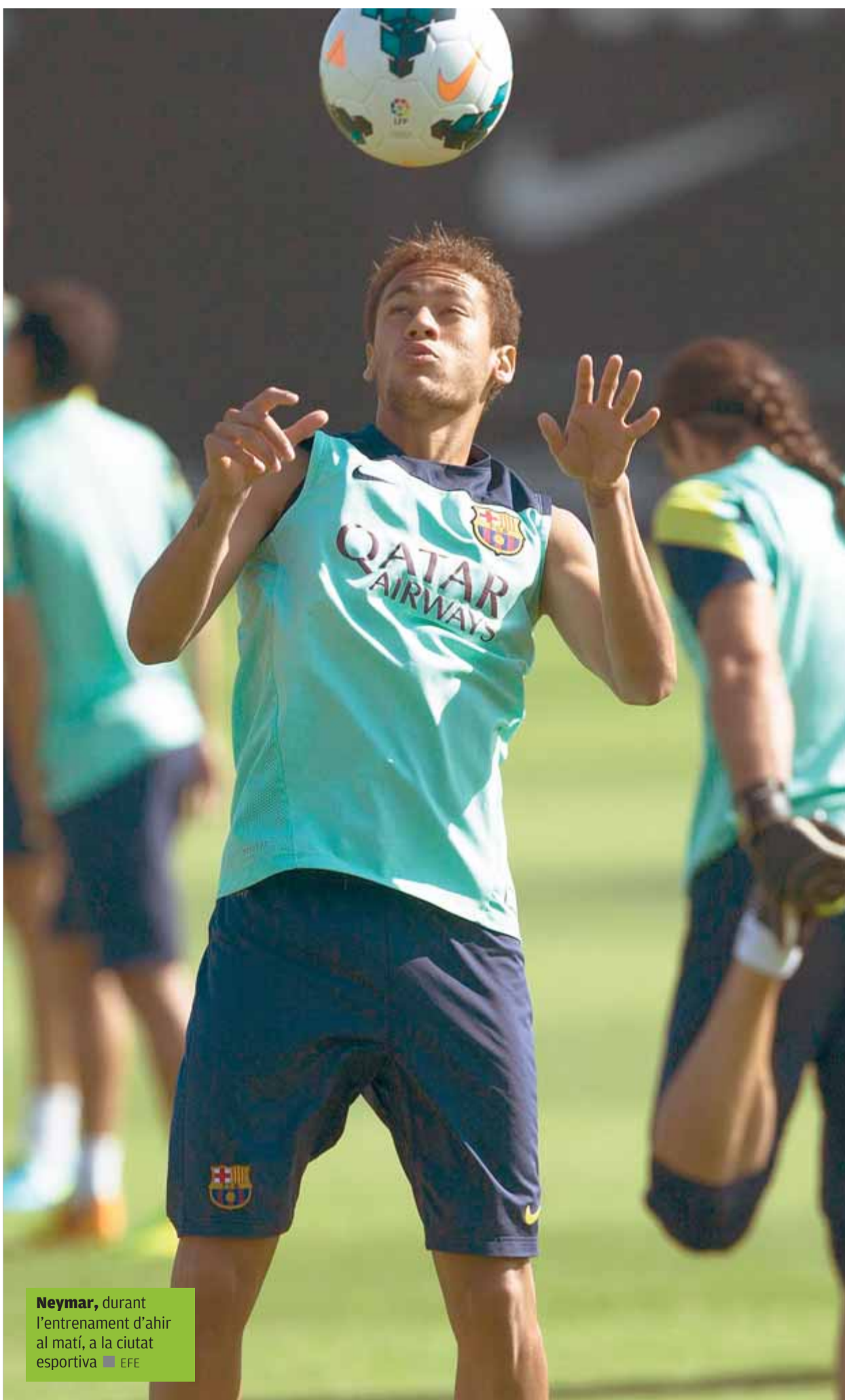
Neymar , durant l'entrenament d'ahir al matí, a la ciutat esportiva

LA IMPORTÀNCIA DEL COM • La Real Sociedad trobarà aquesta nit, a l'estadi, un Barça que no ha acabat de convèncer la seva afició, tot i haver començat la temporada amb uns resultats impecables