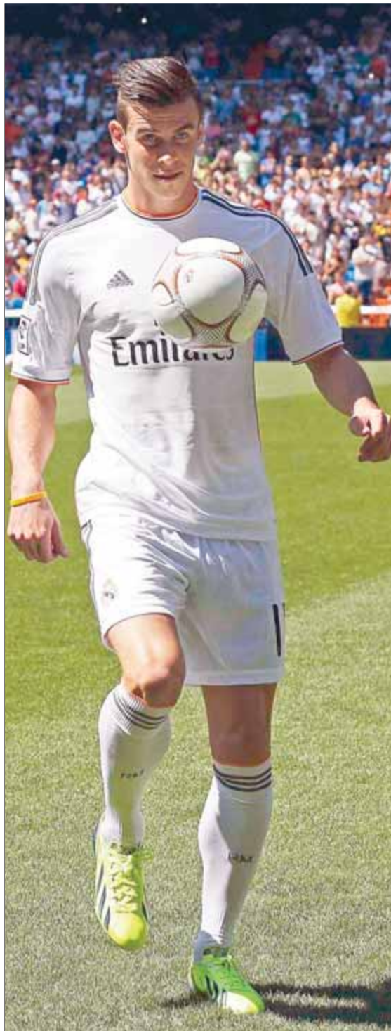
Gareth Bale i Neymar en les respectives presentacions com a jugadors del Barça i del Madrid

Una competició també marcada per l'atapeïment del calen-