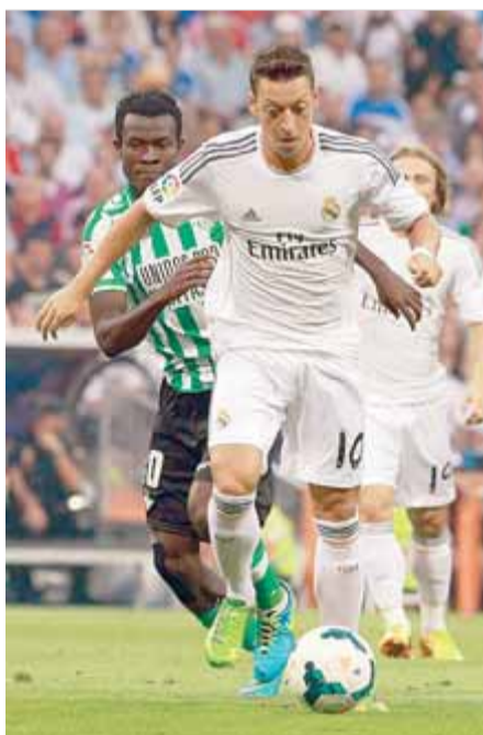
ÖZIL

S que Özil és un excel·lent futbolista, no ho pot discutir, però és clar que el Real Madrid necessitava fer un bon traspàs i arregar uns quants milions per afrontar el pagament de 101 milions d'euros per Gareth Bale. I arribats a aquest punt, vendre el migcampista alemany és una bona decisió. Primer perquè podia treure un bon pessic per ell, com ha quedat demostrat amb els prop de 50 milions que ha ingressat. I segon, i mirant només el vessant esportiu, perquè la seva posició la té ben coberta Carlo Ancelotti. El Real Madrid ha fitxat aquest estiu Isco, que ha iniciat molt bé la temporada i que ha de ser titular amb Cristiano i Bale darrere del davanter. Özil tenia així poques possibilitats de ser titular, tenint en compte que la seva plaça també la pot ocupar un altre bon futbolista com és Modric.