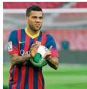
DANI ALVES FUTBOL

Primer, Busquets. Ara Alves també ha hagut d'abandonar la concentració de la seva selecció a causa d'una lesió. Ja veurem com arriba a Barcelona.