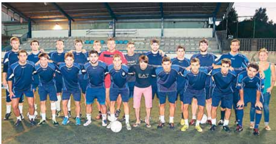
La plantilla del Farners afronta la tercera temporada a primera catalana