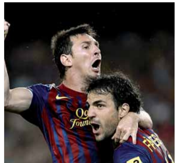
Cesc va debutar guanyant la supercopa al Madrid

Quant al palmarès, l'únic títol que encara no ha aconseguit posar a la seva vitrina és la Cham-