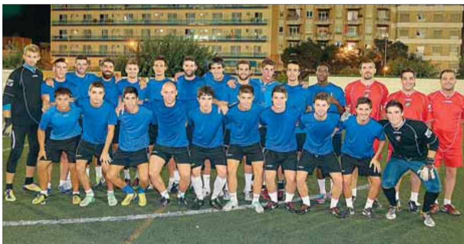
La plantilla del Lloret per a la temporada 2013/2014 ■ MANEL LLADÓ