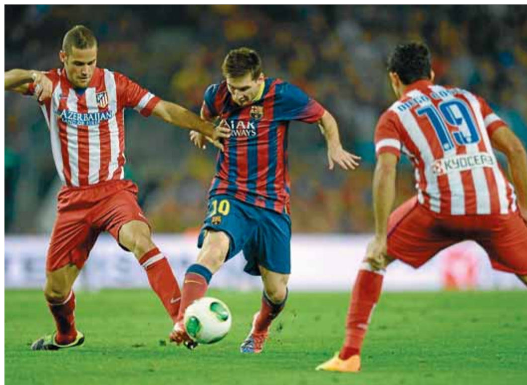
Messi, intentant superar dos jugadors de l'atlético

Quant al Barça, em va interessar un comentari de Rexach, que reflexionava si no era desapropiar l'energia fent pressió quan un equip, i en trobarem molts en aquesta lliga, ja et cedia la pilota d'entrada. El tècnic i assessor del Barça ha donat no cent dies sinó deu partits a Martino perquè resolgui les contradiccions entre la possessió de pilota i els desplaçaments de lluny per guanyar l'esquena a la defensa, que en una gran part és una manera de perdre-la. El cert és que quan el Barça no ataca ho podríem derivar a si perd la possessió de la pilota, es torna molt vul-