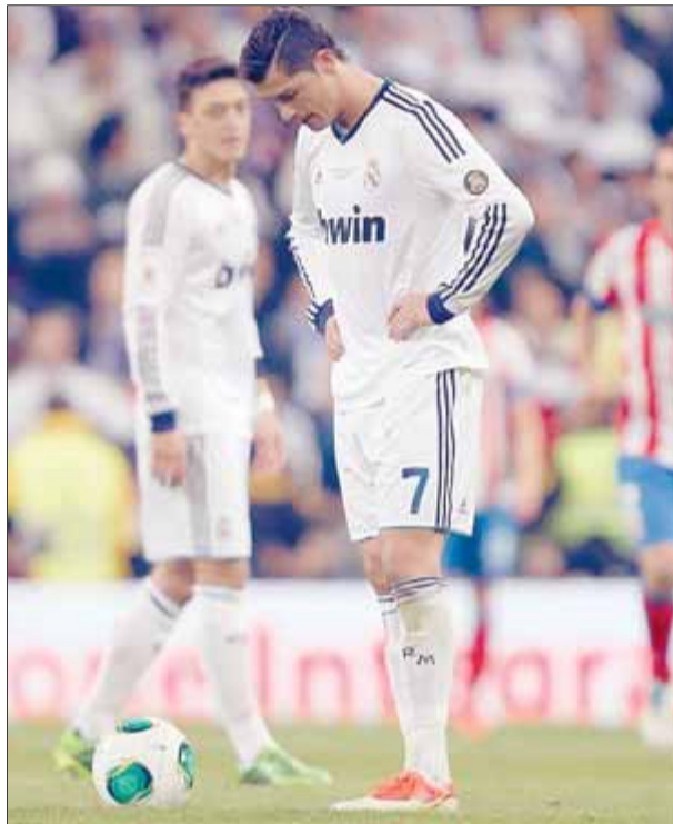
Cristiano i Özil ja no jugaran junts

La marxa d'Özil a l'Arsenal no només ha creat discrepàncies dins del club blanc, sinó que les crítiques també vénen de fora, i de manera unànime. "És incompreensible que el Madrid hagi deixat anar un dels seus jugadors més efectius dels últims anys", va dir ahir el seleccionador alemany, Joachim Löw, i Thomas Müller, company de selecció d'Özil, també hi va dir la seva: "Ell estava a gust en el Madrid, però les coses canvien molt de pressa. El Madrid s'ha gastat un dineral en les noves