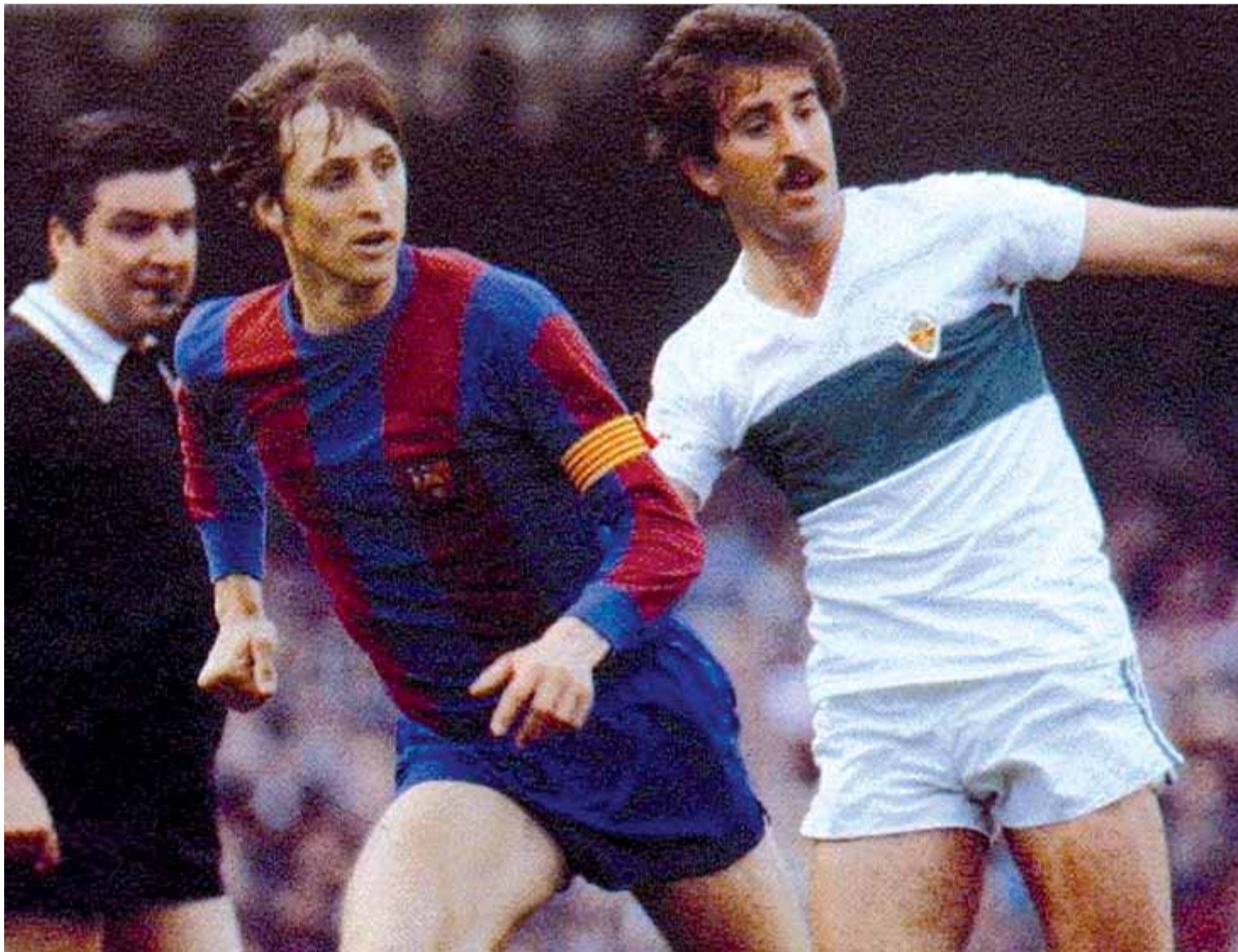
Cruyff, en acció en una imatge històrica de la seva etapa com a jugador del Barça (1973-1978)