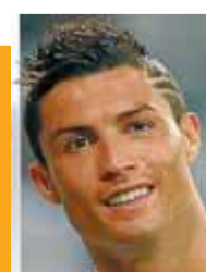
GUTI. Exjugador del R. Madrid

"Messi és el millor. Em costa dir-ho, però és la veritat"