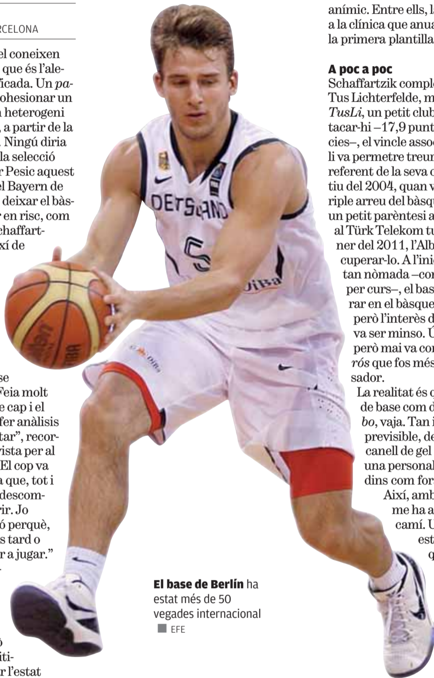
El base de Berlín ha estat més de 50 vegades internacional

Ell tenia fortalesa, però també va rebre ítems positius que ajudaven a reforçar l'estat