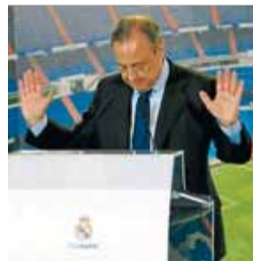
FLORENTINO PÉREZ FUTBOL

Primer, Busquets. Ara Alves també ha hagut d'abandonar la concentració de la seva selecció a causa d'una lesió. Ja veurem com arriba a Barcelona.