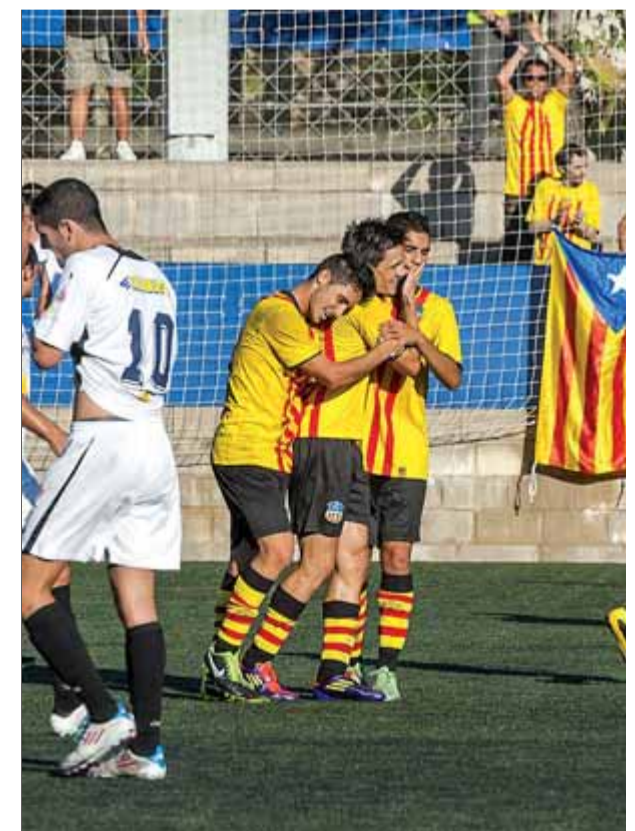
Els jugadors del Sant Andreu celebrant el gol de l'empat, en el duel d'ahir ■ JOSEP LOSADA

A més, hi haurà els partits (10) entre els equips de segona A: Sabadell-Las Palmas ..... 12.00 h Girona-Ponferradina ..... 12.00 h