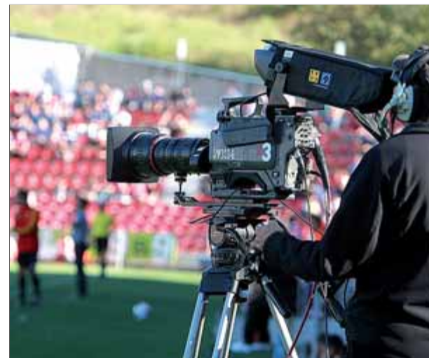
Una càmera de Televisió de Catalunya a Montilivi

La LFP ha afegit aquesta temporada en els horaris que publica al seu web oficial quin operador de televisió els ofereix. Les dades, però, no són del tot fiables. Per exemple, anuncia que el Jaén-Girona de diumenge (a les sis) l'oferirà Esport3, però Televisió de Catalunya no el farà, sinó que retransmet el Tenerife-Barça B. ■