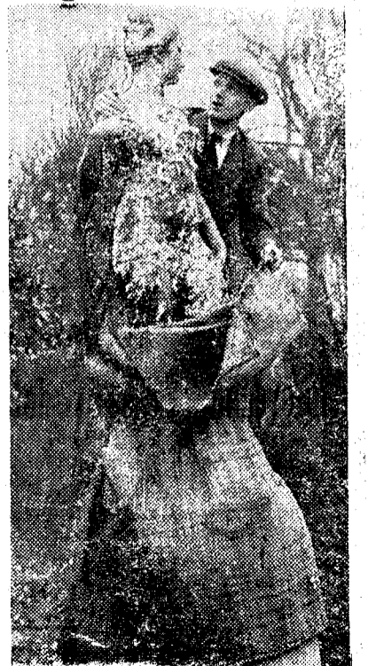
Londres. — Por segunda vez esta estatua de un parque de Londres ha sido maculada porque el desnudo ofende el pudor británico