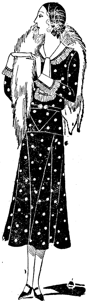
Cliché núm. 12.—Vestido de seda negra bordado con puntos de plata, cuello y puños de georgette blanco, bordados con lamé plata.