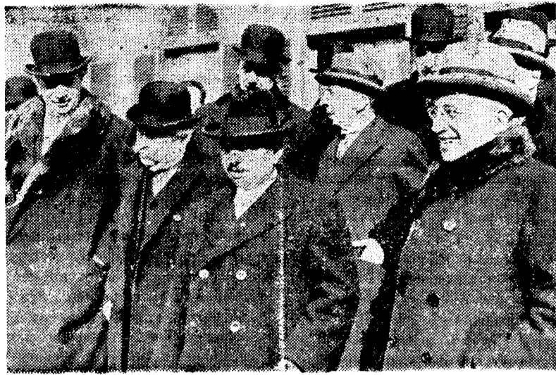
París.— Varios miembros del gabinete Laval, posando ante el objetivo cinematográfico.

Y llegó el día. Al amanecer la banda del buque despertó a los pasajeros con las estentóreas notas de un pasacalle. Durante el día no cesó de jugarse a todos los juegos. Pero el "clou" de la fiesta se guardaba para la noche. El baile de verbena. Iba a haber churros y todo. Los pasajeros contenían su impaciencia, dando innumerables paseos