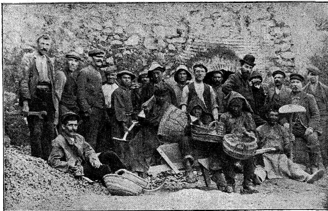
MINAS DEL "PAPA,,