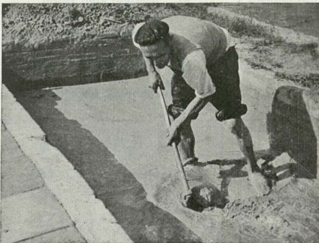
Fotograma del film «Un rajoler»