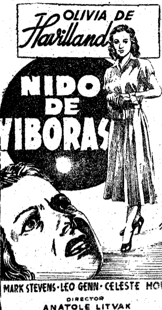
MARK STEVENS-LEO GENN-CELESTE HOLM DIRECTOR ANATOLE LITVAK