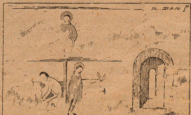
Pintures del cantó de la Epistola