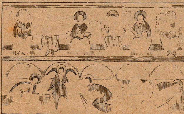
Pintures del cantó del Evangeli