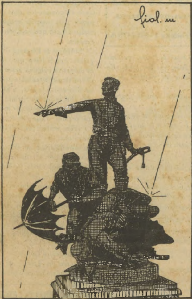
Pel Maig, cada dia un raig

que s'hotatja en aquelles casetes de la Devesa.