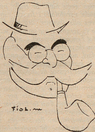
Un ex-quefe de policia.

BOTIGUERS, COMERCIANTS! qui no s'anuncia a «EL SENYOR NARCÍS» no ven. Ho sentiu...?