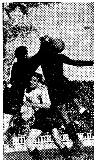
El portero despeja una situación apurada