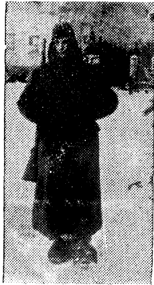
El clima ru o impone este uniforme