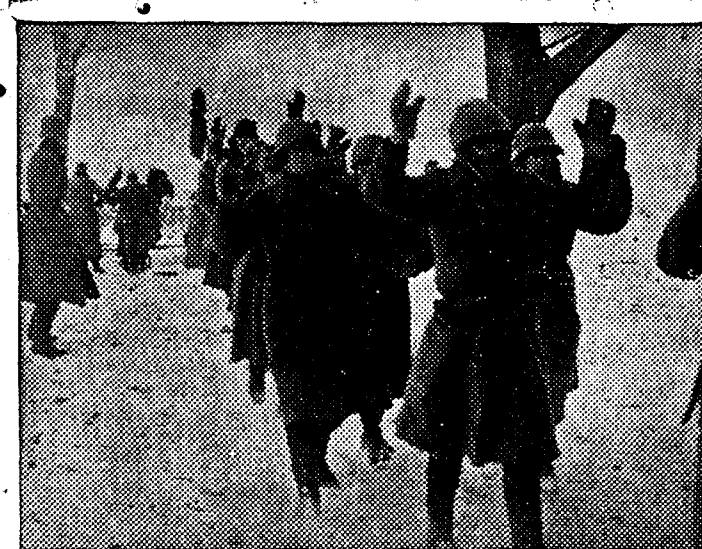
En la lucha contra el comunismo, las tropas del Eje hacen miles de prisioneros