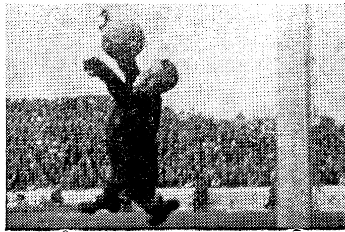
UNA BELLA ESCENA DEL PORTERO BARCELONISTA