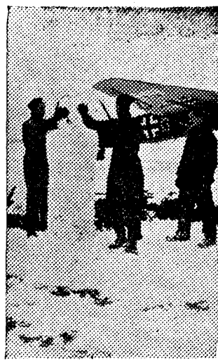
Aviones alemanes preparados para el combate