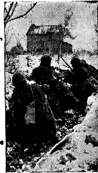
Una linea de trincheras, en Rusia.